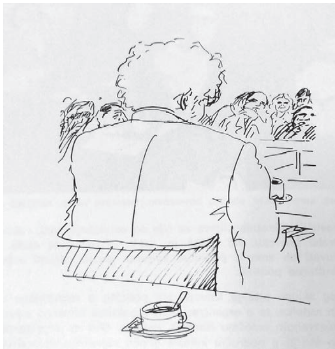
Sl. 1. Karikatura Nedeljka Dragića s tribine Filmske kulture (24. veljače 1977.) 10

Matvejevića, povremenoga gosta na okruglim stolovima i stručnim raspravama 1970-ih, koji je protjecanjem vremena sve više odudarao od službenih stavova te je zbog svojih javnih i privatnih stavova praćen od strane Službe državne sigurnosti i tretiran kao klasni neprijatelj – anarholiberal.