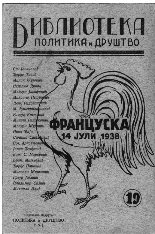
Slika 1. Srpska intelektualna elita Francuskoj Republici povodom njezinog nacionalnog praznika, 14. srpnja 1938.

varaju današnjim duhovnim potrebama sveta”. 36 Odgovor nije potvrđan. Miljković se suprotstavlja trenutku u kome „mahnitaju nacionalne strasti, kad neki glavni ideolozi i vođi ističu ‘moralno biće’ svoje nacije kao superiorno i suprotno drugima” i ostaje veran „idealu francuske kulture o slobodi čovekove misli i njegovog delanja”. 37 Ivan Đaja takođe u francuskoj nauci vidi prevashodno njen univerzalni duh. Đaja piše: