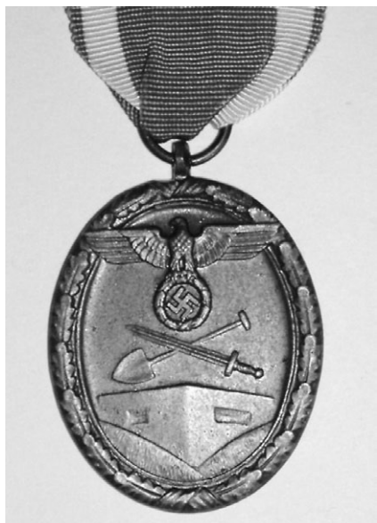
Slika 5. Odlikovanje dodijeljeno graditeljima Siegfriedove linije

su Turci odnosno činili su česte prepade na tu zemlju, pa su se gore spomenuti narodi protiv njih stalno borili i nisu im dali svoju zemlju, to je bila dakle borba za opstanak, borba protiv invazije stranaca, tuđina. 88