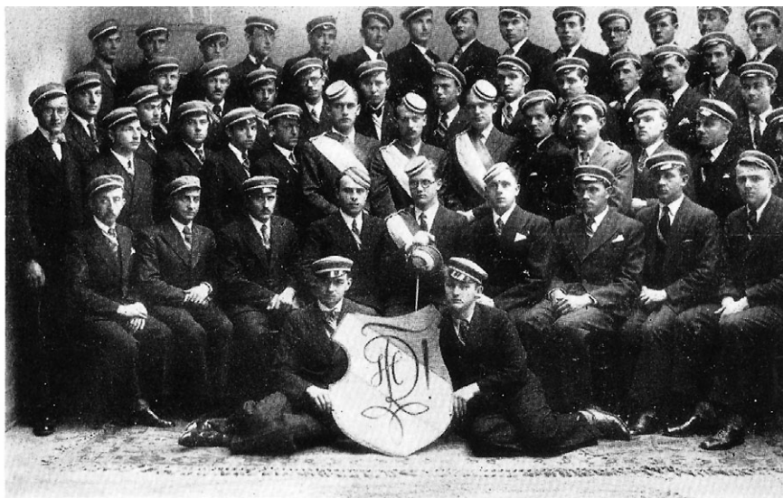
Slika 4. Članovi Udruženja njemačkih studenata u Zagrebu u ljetnom semestru 1934. godine

Nijemaca – pritom očito misleći na Nijemce u Jugoslaviji – odrasla bez ikakvog oblika nacionalnog institucionalnog uključivanja, zbog čega su bili nacionalno neosvijesteni, trebalo ih je osvijestiti. To je značilo uvjeriti ih da biti student ne znači uživati u „akademskim slobodama”, već odgojem postati borac za narod ( völkischer Kämpfer ), to jest školovanjem se osposobiti za rad u narodu ( Volkstumsarbeit ). Zbog toga je svatko po završetku studija trebao steći „zatvorenu sliku (...) narodne skupine” i biti upućen u „sva pitanja u vezi s domovinom”. Pritom je ideologijski najvažniji bio koncept „dužnosti”. Cilj nije bio odgajati „mozgovne akrobate” ( Gehirnakrobaten ) nego „muškarce koji će, kad se vrate u svoje rodno selo, dati uvjerljiv dokaz novog nazora”. 84