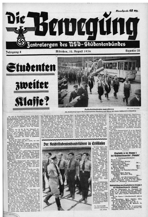
Slika 2. Naslovnica glasila Die Bewegung

nom selu, odvjetnika spremnog pomoći „običnim ljudima” u sporovima oko nasljedstva ili učitelja koji je djecu učio čitati, pisati i računati. Njihova je važnost bila još i veća ako se uzme u obzir da je u to doba udio fakultetski obrazovanih ljudi bio iznimno nizak. 6 Bilo bi, dakle, potpuno suludo pomisliti da je Badl, koji je i sam bio student, u svom „antiintelektualizmu” bio protiv visokog obrazovanja. Naprotiv, fakultetsko je obrazovanje i u „novom poretku” bilo na visokoj cijeni, ali ipak – ono nije smjelo proizvoditi „intelektualce”!