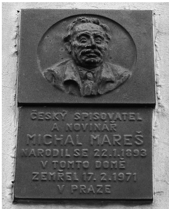
Slika 1. Zakašnjelo priznanje i naknadna rehabilitacija: spomen-ploča Michalu Marešu na njegovoj rodnoj kući u Teplicama, postavljena 1993. godine

odlukom Vrhovnog suda bio posthumno oslobođen svih optužbi i potpuno rehabilitiran.