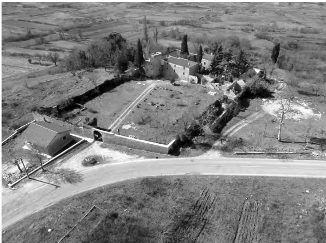
Slika 1. Kula Stojana Jankovića – pogled iz zraka, 2012.

Prošlo nas stoljeće uči da nagla razaranja kulturnih dobara, potresi, poplave ili ratovi, uvijek iznova potiču rasprave kako obnavljati graditeljsku baštinu koja je u njima stradala. Tragična europska iskustva svjetskih ratova bitno su utjecala, kako na odnos prema baštini, tako i na metode njene obnove. Poljski ili njemački gradovi faksimilski su, u relativno kratkom vremenu, rekonstruirani tako reći iz pepela. Bilo je to pitanje od nacionalnog značenja. No, upravo je takav odnos prema obnovi baštine nakon Drugog svjetskog rata na neki način iznjedrio surovu taktiku suvremenih svjetskih sukoba: uništavanje kulturnih dobara kao dio (ne)službene politike. Ako uništimo nasljeđe, uklonit ćemo i svaki dokaz trajanja.