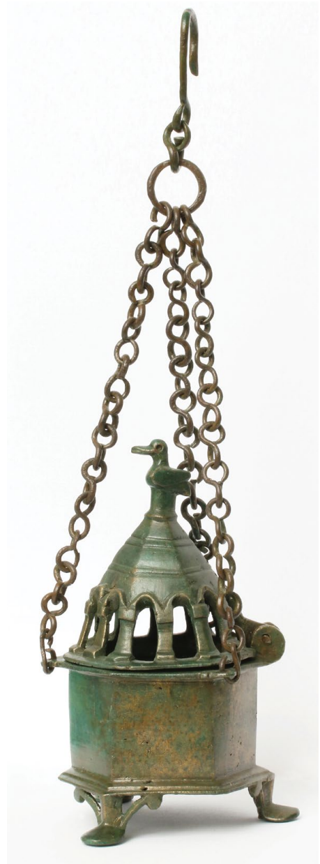
Sl. 6. Kadionica iz Klapavica kod Klisa, kat. br. 5 (inv. br. AMS H-4296)

Kadionica je pronađena s vanjske strane apside crkve u Klapavicama na spoju zidova M i N kako ih je označio don Frane Bulić. 58 Brončana kadionica sastoji se od šesterokutne posude s tri noge u kojoj je gorio tamjan i poklopca u obliku šesterokutne piramide. U donjem dijelu poklopca je dvanaest otvora za dim u obliku prozora sa stupićima pravokutnog presjeka i kapitelima, a na vrhu poklopca ukras u obliku ptice. Uz gornji rub posude su tri ušice o koje su zakačeni lanci spojeni karikom na kojoj je i kuka za vješanje o koju se posuda vješala ili nosila u ruci te njihala kako bi se prostor ispunio mirisom tamjana. Don Frane Bulić u prvoj objavi kadionice navodi kako je prilikom pronalaska unutar šesterokutnog recipijenta pronađen ostatak mekog ugljena 59 i datira je od 5. do početka 7. stoljeća, u vrijeme kad je crkva u Klapavicama bila u upotrebi, što je potvrđeno nalazima na lokalitetu. Uz nalaze kamenog namještaja, dijelova ambona i oltarnih pregrada datiranih u 5. i 6. st. 60 , pronađeni su i sitni nalazi poput dijelova pojasnih garnitura koje pripadaju razdoblju 4. i 5. st. Riječ je o dva pojasna jezičca koji pripadaju različitim tipovima te trnu kopče u