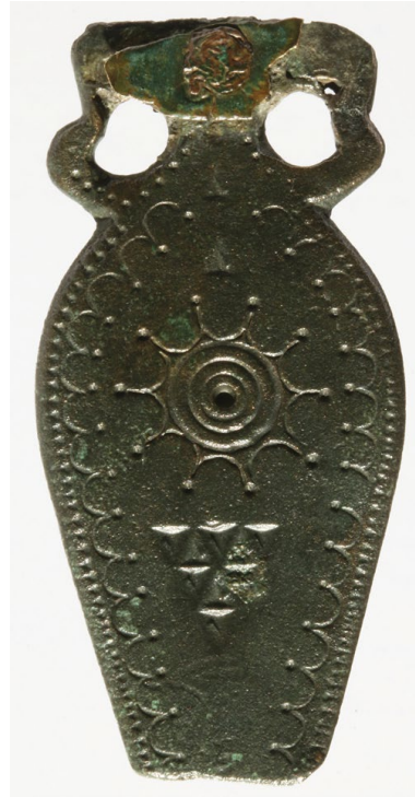
Sl. 9. Pojasni jezičac iz Klapavica kod Klisa (inv. br. AMS H-4357)

Mediterana gdje nema onih s cilindrično oblikovanim tijelom. 74 Važno je uočiti da kadionica iz Klapavica pokazuje možda i veću sličnost s nekim od primjeraka kojima je tijelo oblikovano cilindrično od kadionica s poligonalnim tijelom iz Sirije i Egipta. Tako kadionica iz Sirije ima drugačije oblikovane noge, recipijent joj je dublji nego našoj, a vješala se o jedan lanac. Egipatski primjerak koji je nešto sličniji našoj nema noge i vješao se samo o jedan lanac. Ukrašen na vrhu poklopca kadionice iz Klapavica odgovara onima pronađenima na lokalitetu El Bovalar 75 i u Rimu. 76