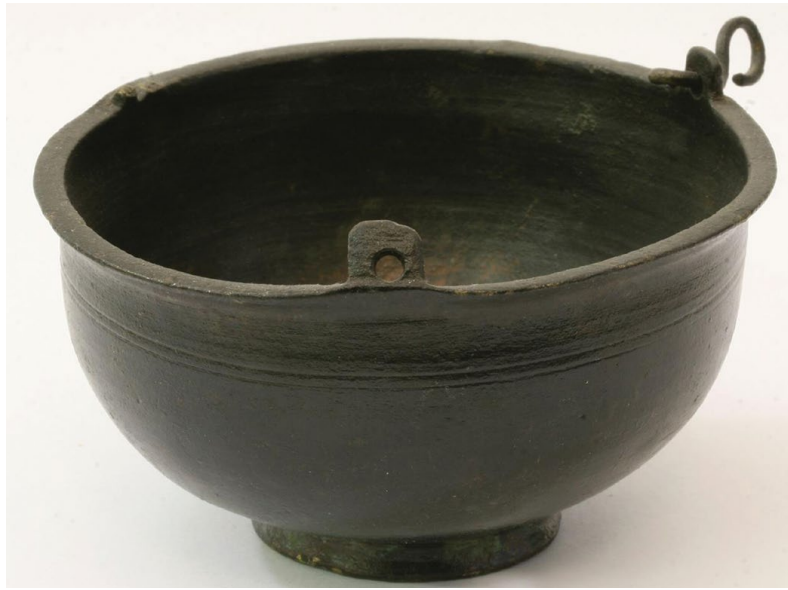
Sl. 1. Kadionica iz Salone, kat. br. 1 (inv. br. AMS H-151)

namještaja i natpisa, nalazi liturgijskog posuđa s područja Salone nisu brojni, možda zbog činjenice da su predmeti korišteni u liturgiji bili vrijedni i dobro čuvani, a u slučaju opasnosti ili rušenja crkve moglo ih se lako zaštititi i prenositi. 24 Treba uzeti u obzir da su se predmeti te namjene mogli koristiti dulje vrijeme pa se i danas u nekim crkvama čuvaju ili koriste predmeti iz ranijeg razdoblja, primjerice renesanse i baroka, a zanimljiv je primjer kasnoantičke svjetiljke koja se još koristi u samostanu Sv. Ante na planini Kolzim na Crvenom moru. 25 Zato je potreban oprez kod datiranja te vrste materijala čak i kod nalaza u zatvorenim cjelinama, primjerice ostavama. Osobito su dugovječne bile lampe jer su se vjerojatno manje trošile u odnosu na druge predmete koji su korišteni tijekom liturgijskih slavlja. Da su i kadionice mogle imati dulje trajanje i uporabu govori navod u popisu liturgijskih predmeta crkve sv. Mihaela (o. Staffelsee) iz 810. god. gdje je, između ostalog inventara, navedena starinska brončana kadionica ( turabulum cuprinum antiquum ). 26