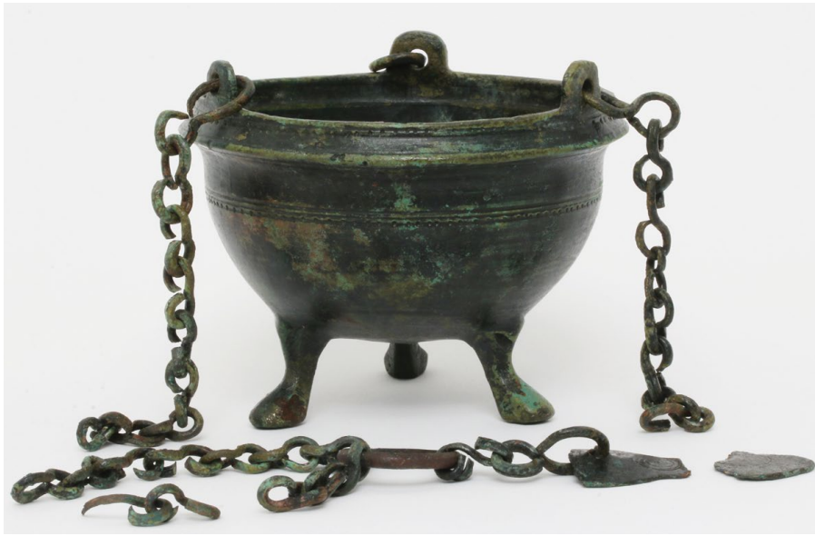
Sl. 2. Kadionica iz Salone, kat. br. 2 (inv. br. AMS 65817)

Siciliji, Delosu, u Egiptu i Efezu 27 , te su datirane u razdoblje 6. i 7. st. Stoga kadionicu iz Salone, na temelju analognih primjeraka, možemo datirati u to razdoblje. Kadionice tog tipa izrađivale su se i u luksuznijim varijantama, primjerice s perforiranim stijenkama recipijenta 28 ili bogato ukrašene kršćanskim motivima. 29