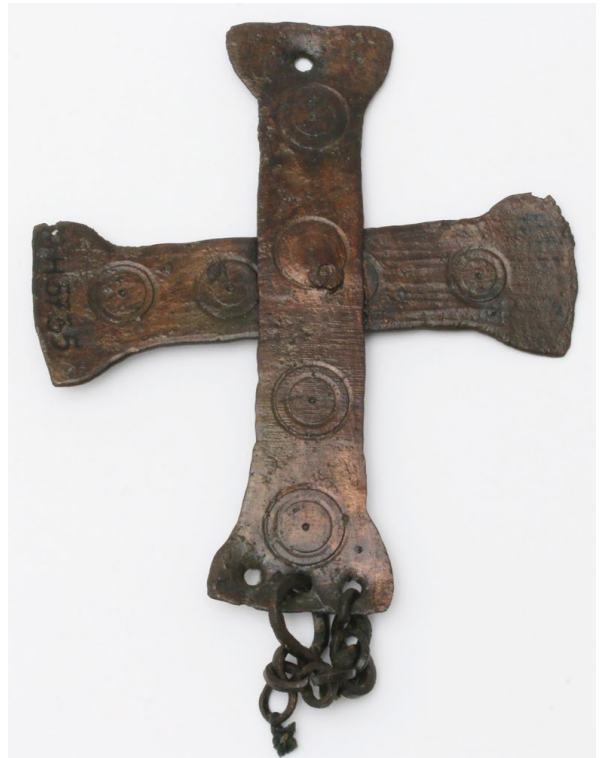
Sl. 4. Križ pronađen u crkvi na Marusincu u Saloni, kat. br. 3 (inv. br. H-5735)

Ovdje bismo skrenuli pozornost na križ, odnosno medaljon s križem i lancima iz Salone (kat. br. 4, sl. 5) koji se interpretira kao dio konstrukcije polikandila. 46 S obzirom na identično izrađene križeve na kadionici iz Sirije koja se čuva u Londonu 47 i za ovaj je križ moguća nova interpretacija,