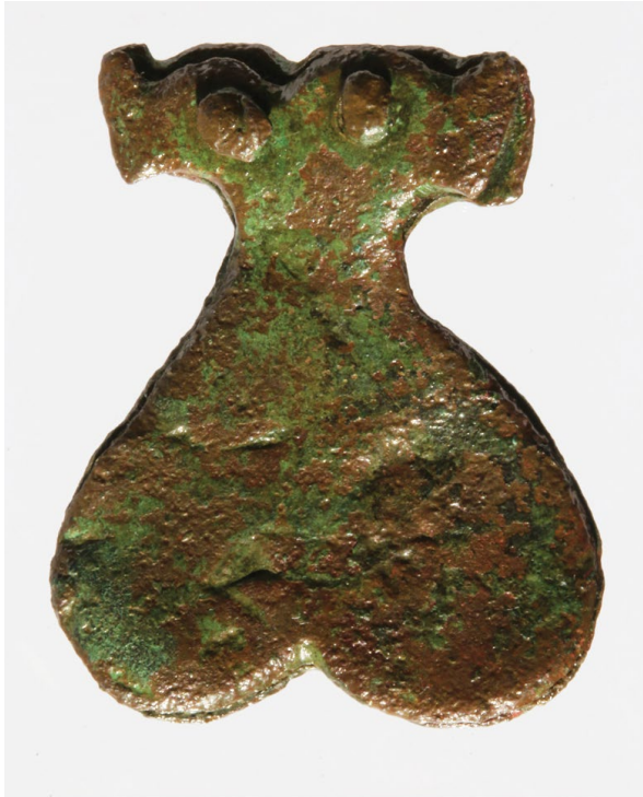
Sl. 8. Pojasni jezičac iz Klapavica kod Klisa (inv. br. H-4356)