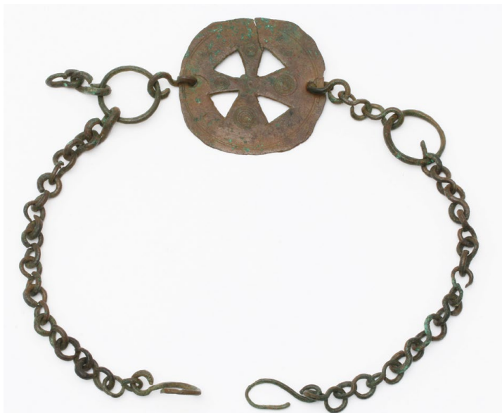
Sl. 5. Medaljon s križem iz Salone, kat. br. 4 (inv. br. AMS H-608)

no ne možemo potpuno odbaciti dosadašnju interpretaciju da je služio kao dio nosača stropne svjetiljke s obzirom na to da slične nalazimo na polikandilu sirijskog porijekla datiranom u 6. st. koje se čuva u zbirci Dumbarton Oaks u Washingtonu. 48 Sličan medaljon, nešto većih dimenzija od našeg, iz Muzeja Benaki u Ateni također je interpretiran kao dio nosača polikandila. 49 Gotovo identičan predmet pronađen je devedesetih godina prošlog stoljeća u arheološkim istraživanjima ranokršćanske crkve u Sutivanu na otoku Braču 50 , s jedinom razlikom što s jedne strane ima tri lanca dok salonitanski s obje strane ima po jedan lanac. Interpretiran je kao nosač svjetiljke. 51 Medaljon poput našeg pronađen je također u istraživanjima crkve u Tunisu (Sbeitla) sredinom prošlog stoljeća 52 , a jedan se čuva u muzeju u Kairu. 53