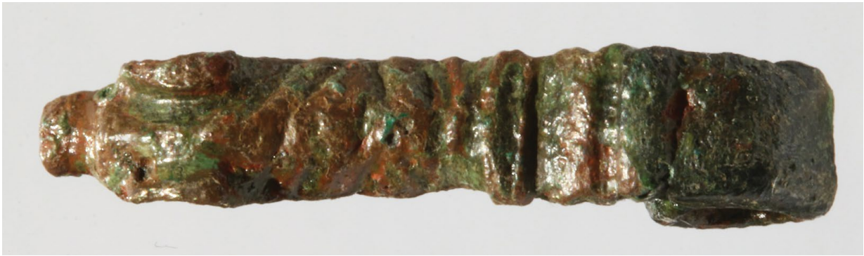
Sl. 7. Trn kopče iz Klapavica kod Klisa (inv. br. AMS H-4358)

obliku životinjske glave (sl. 7). 61 Sroliki jezičak 62 (sl. 8) pripada brojno zastupljenom tipu (formi Sommer A, varijanta b) 63 na području Rimskog Carstva u razdoblju 4. i početka 5. st. 64 Drugi jezičak 65 (sl. 9) pripada tipu amforastih jezičaka (forma Sommer B tip b, varijanta 4) koji su također dobro zastupljeni, a datiraju se u okvire 4. st. 66 Za oba primjerka nalazimo analogne primjerke na području Carstva. 67