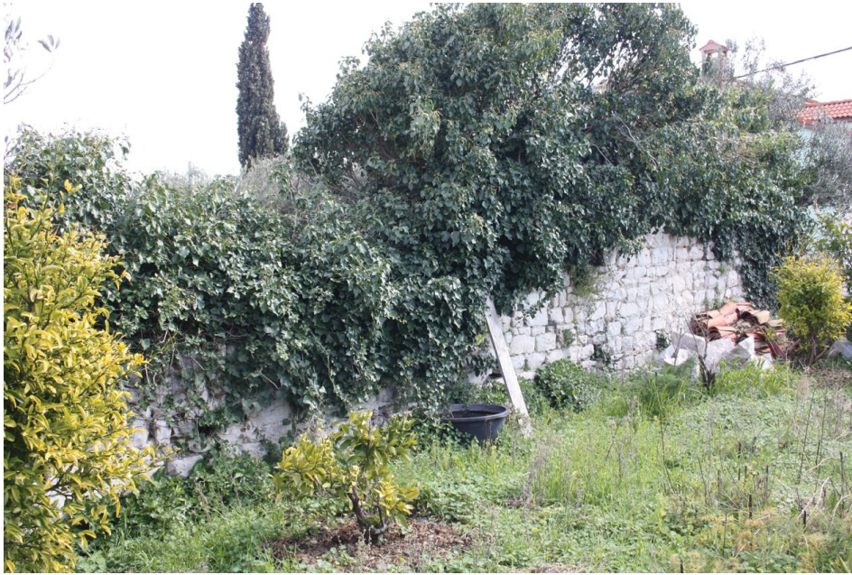
Sl. 3. Miri, sadašnje stanje