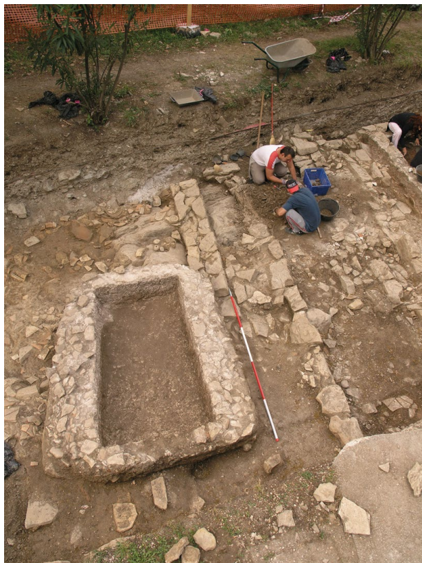
Sl. 5. Resnik, grob 3-2007

ko uhvatilo korijene te se može pretpostaviti postojanje kršćanskog kulturnog objekta. Ali to tek treba potvrditi ili odbaciti daljnjim istraživanjima.