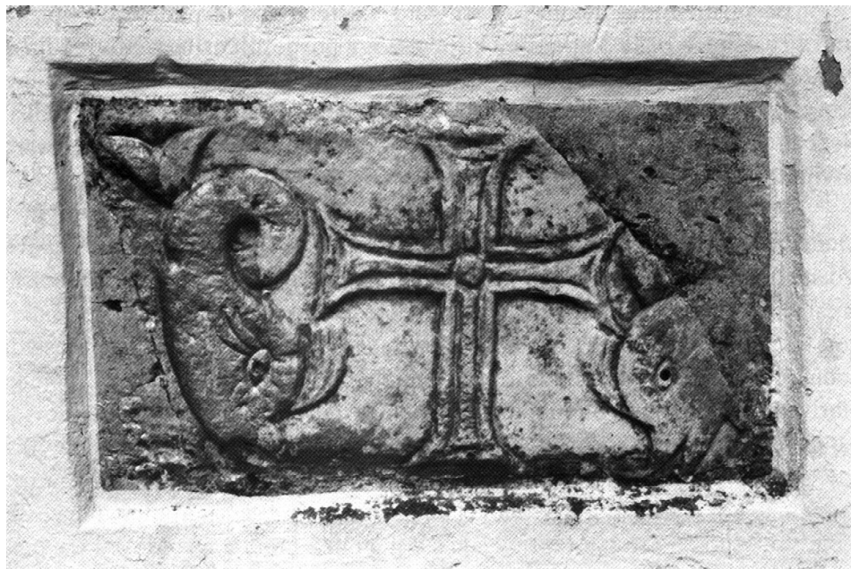
Sl. 4. Stomorija