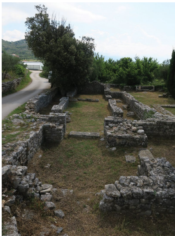
Sl. 6. Bijaci, pogled na ranokršćansku baziliku

Ipak, ostaci većine vila rustika mogu se smjestiti u proučavano razdoblje. Pitanje je jesu li izgrađeni u promatranom razdoblju ili su nastali ranije te nastavljaju živjeti i dalje, neki sve do dolaska Hrvata pa i dalje. Nekoliko izrazitih nalaza daje nadu kako će buduća sustavna istraživanja iznjedruti i arhitekturu koju ćemo moći povezati uz ranokršćanske kultne građevine.