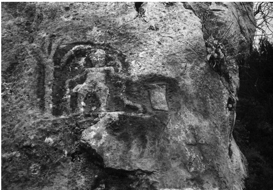
Sl. 1. Tomića tori (preuzeto iz: Omašić 2001)

sani križ čija je okomita hasta izduženija. Kako i na drugom kozjačkom prikazu Silvana 10 također imamo uklesane križeve, može se pretpostaviti kako je i ovaj jedan iz vremena neposredno nakon prihvaćanja kršćanstva, nakon 4. st.