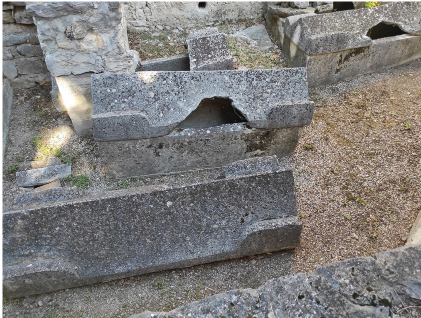
Sl. 2. Sv. Kuzma i Damjan, sarkofazi, detalj