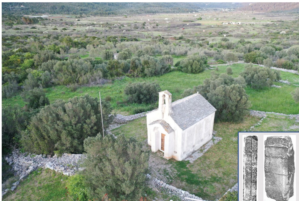
Slika 2 Crkva Svetog Kuzme i Damjana u Zablaću (snimio: I. Borzić); u isječku ulomci ranokršćanske plastike iz temelja crkve (slike ulomaka preuzete iz Fisković 1980a)

su stanovnici ovdašnjih naselja zadovoljavali kultnu praksu. Sintagma „gotovo konkretne“ iskorištena je jer se govori o svojevrsnim spolijama, odnosno elementima ranokršćanske crkve ugrađene u onu ranoromaničku Svetog Kuzme i Damjana, prvi put spomenutu tek 1363. godine. 18 Naime, prilikom konzervatorsko-restauratorskih radova u temeljima crkva ulaza te oltara pronađeni su fino uklopljeni ulomci starokršćanske plastike, konkretno pilastar prozora i baza stupa oltarne pregrade te ulomak stupa oltarne menze (sl. 2, isječak). 19 Oni svojim dimenzijama sugeriraju da pripadaju većem zdanju no što je to ono u koje su ugrađeni, ali arheološka istraživanja, osim nalaza srednjovjekovnih, a moguće i kasnoantičkih grobova, „temelja rustično građenih objekata“ te izraženog antičkog sloja, nisu dala odgovor na pitanje je li njihova izvorna, ranokršćanska crkva stajala na istom mjestu kao i ona ranosrednjovjekovna ili pak negdje u njezinoj blizini. 20 Pretpostavlja se da je i sam titular preuzet od prvotne crkve, posebice jer je riječ o svetcima čiji se kult širi Mediteranom pa tako i Jadranom tijekom 5. i 6. st., u potonjem upravo posredstvom Justinijanovih osvajanja. 21 Njihovo prihvaćanje kao liječnika i čudotvorca moguće je uklopiti u prirodni ambijent Blatskog polja na kojem su zbog plavljenja i močvarnog tla bolesti bile konstantna prijetnja.