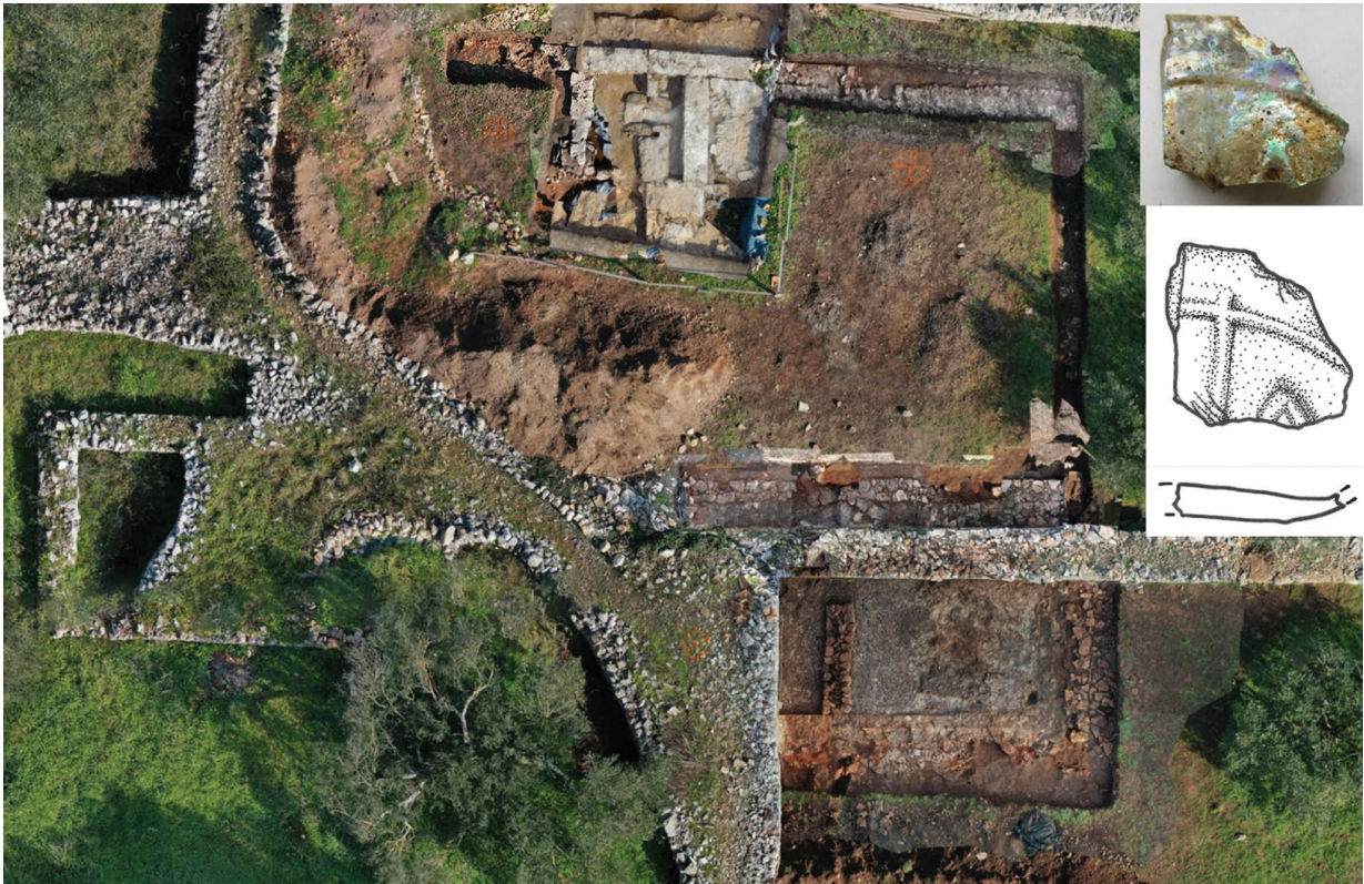
Slika 4 Ortofoto snimak istraženih struktura na lokalitetu Beneficij-Gudulija (izradio: L. Bogdanić); u isječku ulomak dna staklene posude s reljefnim ukrasom (snimio: I. Borzić)

mirno vrijeme u podnožju gradine egzistira nekoliko imanja, prema nekoj logici usmjerenih na ukapanje svojih pokojnika u nekropolama vezanima uz samo imanje ili čak i crkvene građevine.