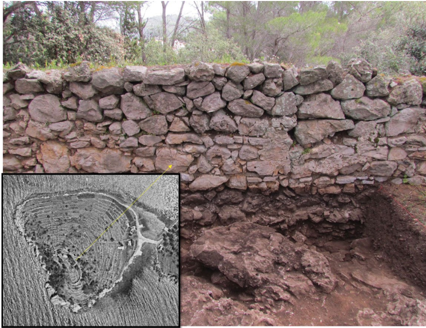
Slika 6 Detalj obzida uokolo glavice Gradine svetog Ivana; u isječku zračni snimak Gradine svetog Ivana iz 1968. g.

Sveučilišta u Zadru „Gradina i luka svetog Ivana na Korčuli – izolirana točka otočnih dodira“, tijekom kojeg su u dvije kampanje 2022. i 2023. g. provedena manja arheološka istraživanja u okolici ranije spomenute kasnosrednjovjekovne crkvice s nadom u pronalazak njezinih ranijih ranokršćanskih slojeva. 46 Nažalost, oni nisu pronađeni u in situ položaju, ali na nedvojbeno pret- hođenje ranokršćanskog crkvenog objekta na mjestu ili u blizini danas stojeće crkve uputili su popratni pokretni nalazi pronađeni uglavnom u svojevrsnom sloju destrukcije, a riječ je o ulomcima mramornog stupa i ploče oltarne menze te bordure pluteja, kao i mnogobrojnim ulomcima raznobojnog prozorskog stakla.