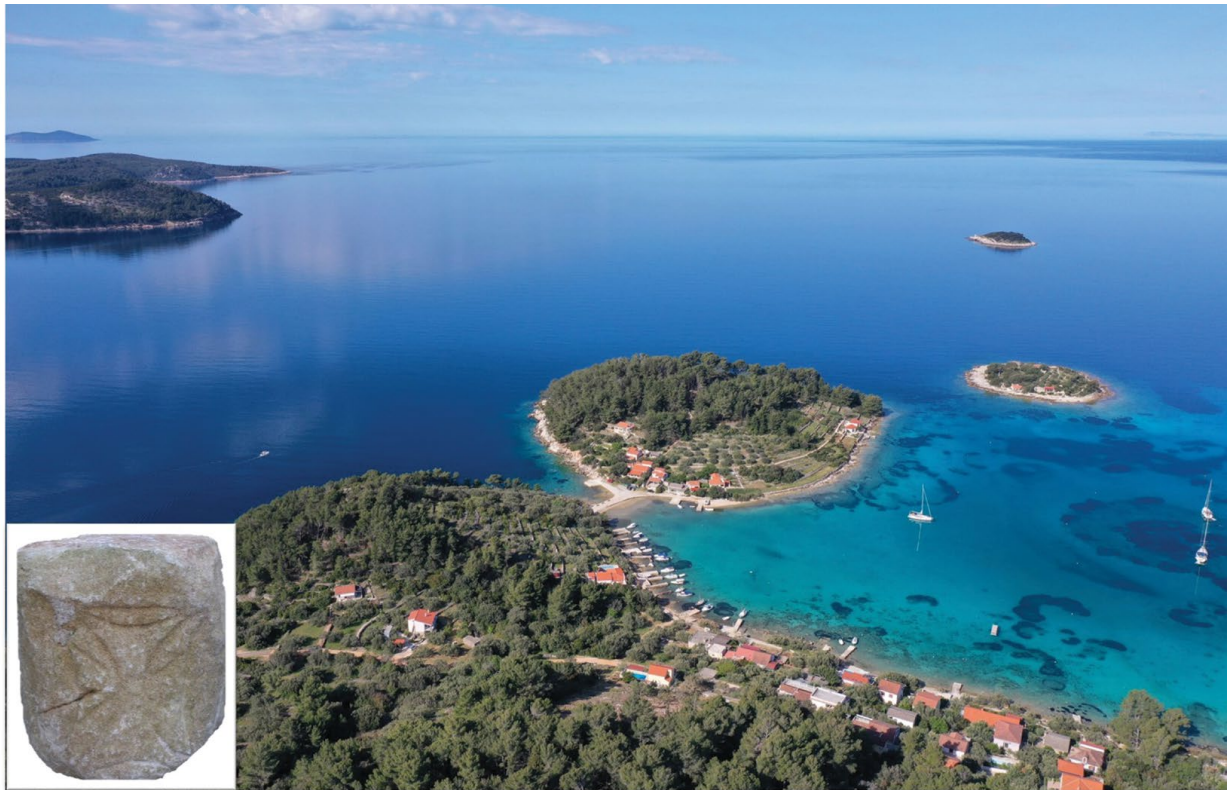
Slika 5 Gradina svetog Ivana i uvala Gradina; u isječku kapitel s Gradine svetog Ivana

promjera 15 cm pronađen u ispuni Cisterne 2, a koji bi analogno sličnim predmetima mogao pripadati ili oltarnoj pregradi crkve ili tomu sličnom. U kontekstu kršćanstva kao na ovom imanju ispovjedane religije može se spomenuti i ulomak dna staklene posude, a na kojem se u reljefu vidi ukras u formi kružnice sa središnje pozicioniranom okomitom hastom kraj koje se moguće nalazi vrh grčkog slova A (Alpha) (sl. 4, isječak), dakle potencijalnog otiska Kristograma sa slovima A i \Omega .