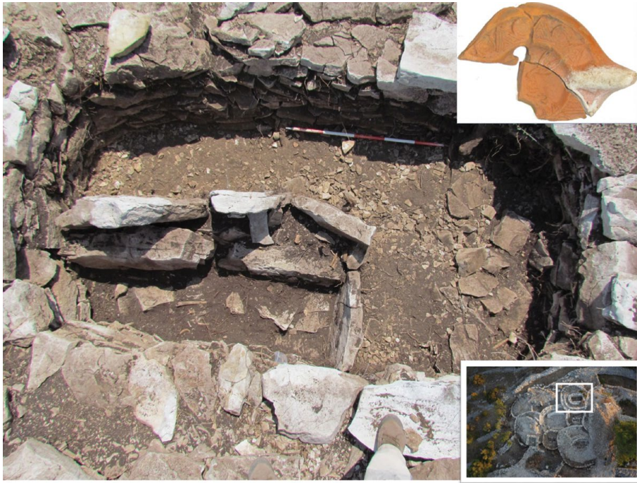
Slika 3 Kopila, kasnoantički ukop (Grobnica 5) na mjestu kasnoželjeznodobne Grobnice 6 (snimio: I. Borzić); u isječku ulomak keramičke svjetiljke tipa Hayes IIA (snimio: I. Borzić)

na korist cjelokupnom stanovništvu Blatskog polja. 22 Na njegovim su se obodima registrirala središta minimalno četiriju rimskih imanja, Gospe od Poja, Zmalovšćice-Rudodme, Svetog Kuzme i Damjana te Dugog poda, 23 a prva tri su sa sigurnošću egzistirala i tijekom kasne antike pa ne bi trebalo iznenaditi da su svi oni bili upućeni na religijsko središte u Zablacu.