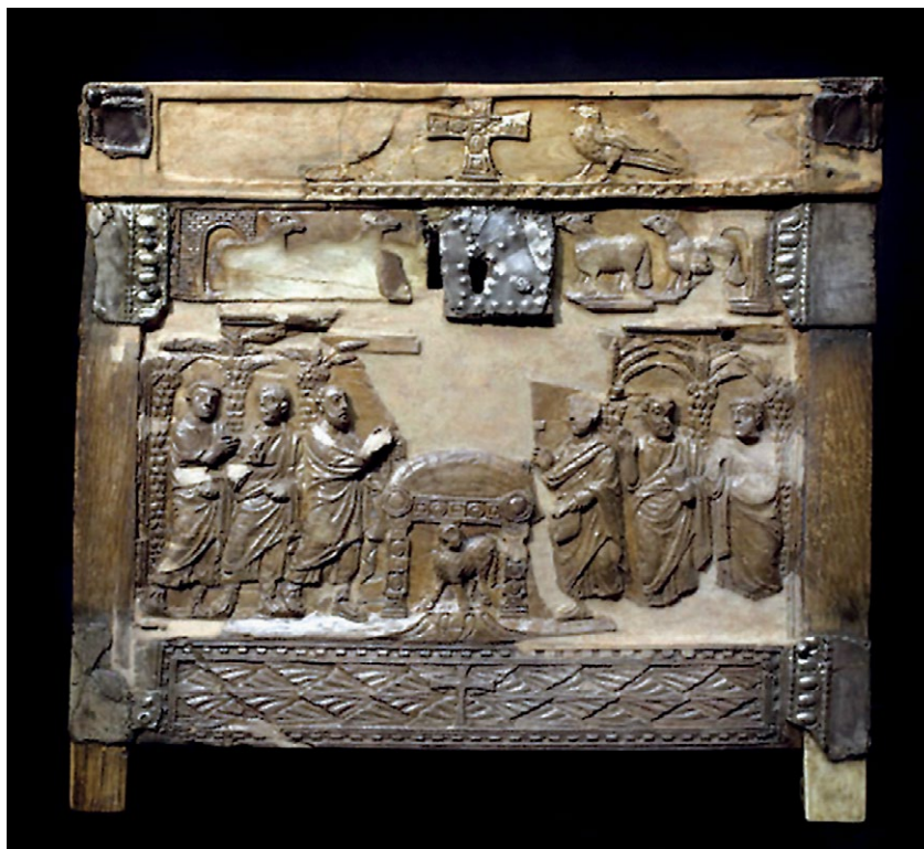
Slika 7. Prednja strana relikvijara iz Samagera, 1. pol. 5. st., Museo Archeologico di Venezia, Venecija ( https://www.restituzioni.com/opere/capsella-di-samagher/ , pristupljeno: 06.09.2019.).