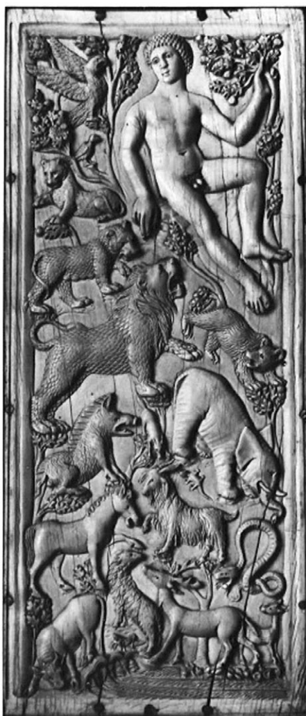
Slika 2. Lijevi panel bjelokosnog diptiha iz Rima, kraj 4./poč. 5. st., Museo Nazionale del Bargello, Firenza (Weitzmann 1979: 506, kat. br. 454).

Prikazi rajskih rijeka u ranokršćanskoj umjetnosti nesumnjivo su bili nadahnuti drugim poglavljem Knjige Postanka u kojem čitamo o tome kako je Bog zasadio vrt na istoku u Edenu, a u stihovima 10–14 biblijski pisac nas izvještava: Rijeka je izvirala iz Edena da bi natapala vrt; odatle se granala u četiri kraka. Prvom je ime Pišon, a optječe svom zemljom havilskom, u kojoj ima zlata. Zlato je te zemlje dobro, a ima ondje i bdelija i oniksa. Drugoj je rijeci ime Gihon, a optječe svu zemlju Kuš. Treća je rijeka Tigris, a teče na istok od Ašura; četvrta je Eufkrat. 2 Izgled tog vrta možemo si dočarati ako se prisjetimo prizora Adama u raju izvedenog na lijevoj strani bjelokosnog diptiha iz Rima (dim. 29,6 x 12,7 cm) s kraja 4./početka 5. stoljeća (slika 2). Na njemu je Adam prikazan u opuštenoj pozi, oslonjen o drvo te okružen raznovrsnom vegetacijom i životinjama. S obzirom da je vrt zelena oaza, u njemu se nalaze i četiri rijeke, prikazane na dnu bjelokosnog panela (Weitzmann 1979: 505–507, kat. br. 454). One su potvrda da se radi o raju. Na ovome, i sličnim primjerima, rijeke su poslužile kao jednostavan ukrasni element kojemu je svrha stvoriti vjernu sliku rajskog prizora (Février 1956: 179–180).