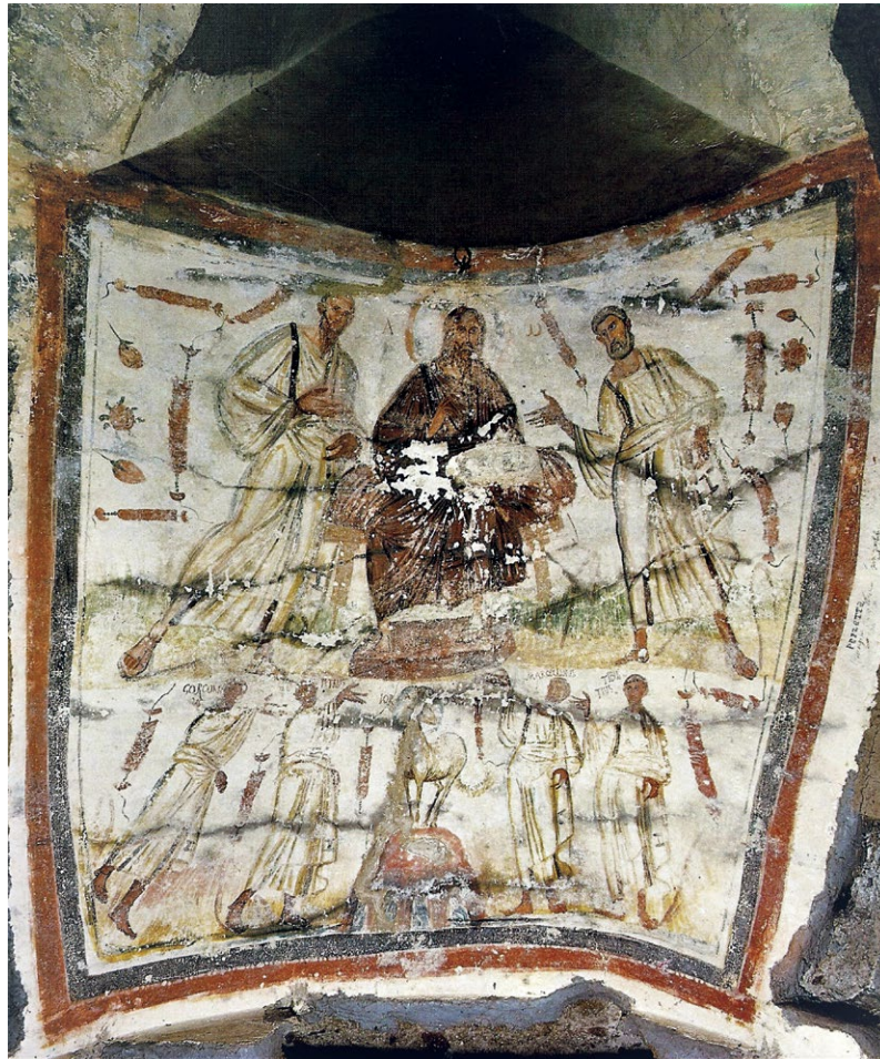
Slika 5. Freska iz Svetačke kriptе, kraj 4. st., katakombe sv. Marcelina i Petra, Rim (Deckers et al. 1987: br. 3, T. 1).

Ovi primjeri jasno ukazuju na to da se motiv četiriju rajskih rijeka u početku javlja u okviru monumentalne umjetnosti i to u grobnim kontekstima. Na tragu toga, često se nalazi i na ranokršćanskim sarkofazima, gdje je scena traditio legis također omiljena te je u pravilu smještena u središnjem polju prednje strane sarkofaga. Takav prikaz izveden je na jednom arhitektonskome sarkofagu iz Arlesa datiranom u kraj 4. stoljeća, 14 a sličnih sarkofaga ima i u Rimu, Ravenni, Veroni, Padovi, Marseilleu i na drugim lokalitetima