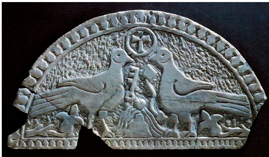
Slika 1. Luneta iz Gata, mramor, 6. st., Gradski muzej Omiš (Jeličić-Radonić 1994: 71).