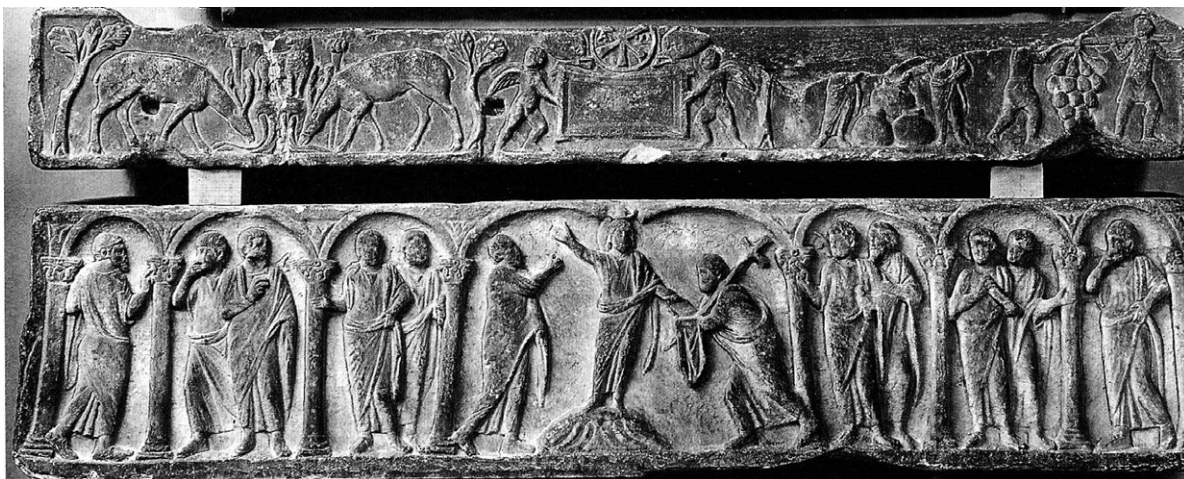
Slika 6. Sarkofag s poklopcem iz Marseillea, poč. 5. st., Musée archéologique de Marseille, (Repertorium III, T. 77: 1).

Italije, Galije i Hispanije (Repertorium II; Repertorium III). Upravo iz Marseillea potječe sarkofag, datiran u početak 5. st., kojemu su sačuvani i sanduk i poklopac (slika 6). U središtu sanduka još je jednom prikazana scena predaje zakona gdje se Krist nalazi na brežuljku niz koji teku rajске rijeke. Na prvoj, lijevoj sceni poklopca (dim. 1,84 x 0,64 x 0,28 m) prikazani su brežuljak i janje na njemu, 15 a vodu rajskih rijeka, koje se slijevaju niz obronke brežuljka, piju dva jelena. 16 Rubove i pozadinu prikazane scene upotpunjuju stabla i palme predstavljajući rajski krajolik (Repertorium III, 150–151, kat. br. 300, T. 77: 1).