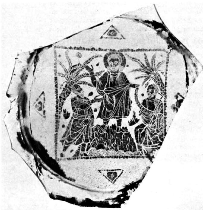
Slika 8. Pozlaćeno stakleno dno iz Rima, kraj 4./poč. 5. st., The Toledo Museum of Art, Toledo, Ohio (Weitzmann 1979: 560, kat. br. 503).

Križ se javlja i na srebrenoj plitici (pr. 18,6 cm), nastaloj u Konstantinopolu u kasnom 6. stoljeću (slika 10). Na njoj su, za razliku od prethodnog primjera, prikazani arkanđeli Gabrijel i Mihovil, svaki s