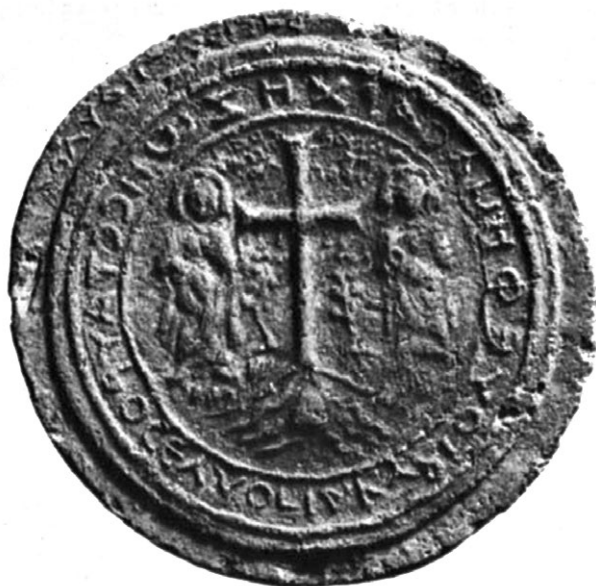
Slika 9. Okrugli keramički žig za kruh iz Palestine, 6. st., Kunsthistorisches Museum, Beč (Weitzmann 1979: 628, kat. br. 566).