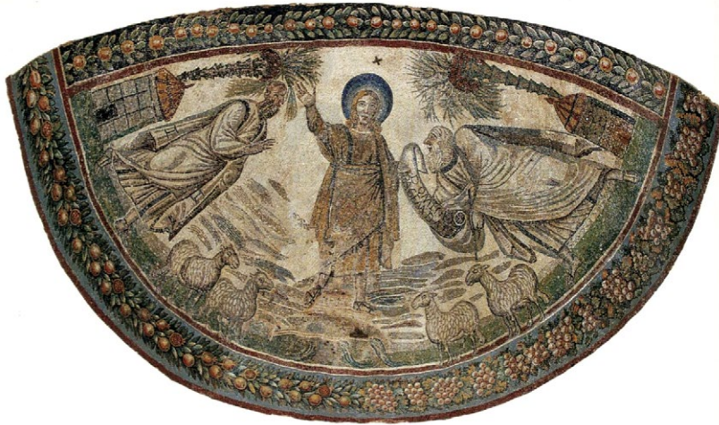
Slika 4. Mozaik s motivom predaje zakona, sredina 4. st., mauzolej Sv. Konstance, Rim (Brandenburg 2005: 82).