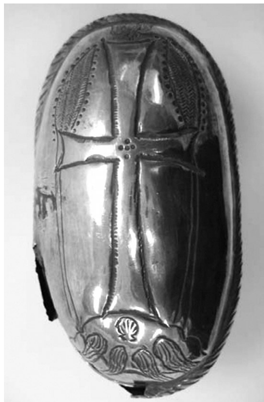
Slika 11. Poklopac ovalnog srebrenog relikvijara iz Palestine (?), rano 7. st., Royal Ontario Museum, Toronto (Noga-Banai & Safran 2011: 6, sl. 3).

ranokršćanskoj umjetnosti od sredine 4. stoljeća. Njegova popularnost gotovo da nije slabila sve do početka 7. st. Kroz svo to vrijeme nalazimo ga na različitim predmetima te se razvija u nekoliko različitih varijanti. U sklopu prizora sa životinjama okruženima bujnom vegetacijom, četiri rajske rijeke jednostavno upućuju na raj, baš poput prikaza na bjelokosnom panelu diptiha iz Rima s Adamom u rajskom vrtu. Rijeke su ipak najčešće smještene u središte kompozicije, odnosno uklopljene su u glavni prikaz. One izvire iz brežuljka na čijem vrhu dominira Kristov lik, Jaganjac Božji ili križ. U nekim slučajevima s lijeve i desne strane brežuljka prikazani su apostoli, svetci, arkanđeli ili ovce, a u drugima jeleni ili košute koji se dolaze napojiti na tokovima tih rijeka. Potonja varijanta ima i nešto drugačije značenje (Poeschke 2004: 382, s. v. Paradiesflüsse ). Vegetacija koja se nalazi u pozadini ovakvih prikaza također je pokazatelj rajske sredine, a palme mogu biti i simboli pobjede.