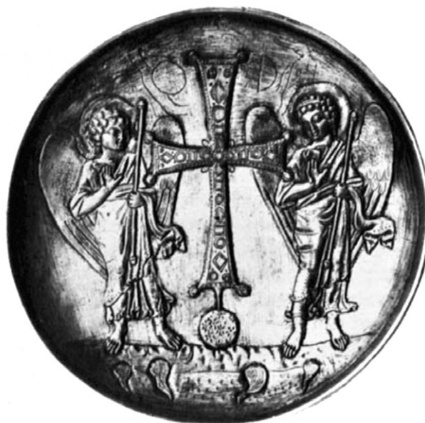
Slika 10. Srebrna plitica iz Konstantinopola, kasno 6. st., State Hermitage Museum, Leningrad (Weitzmann 1979: 538, kat. br. 482).

imati liturgijsku ulogu. Tako je srebrna plitica mogla služiti za pričest, keramičkim žigom mogao se izrađivati euharistijski kruh, a škrinjica iz Samagere, kao i relikvijar iz Toronta, očito su poslužili za pohranu relikvija. S obzirom na sakralni kompleks u kojem je pronađena, liturgijsku funkciju potvrđuje i vrijedna mramorna luneta iz Gata za koju se predlaže da je bila element ranokršćanskog oltara tipa cippus s otvorom (tzv. fenestella confessionis ) (Jeličić-Radonić 1991: 17).