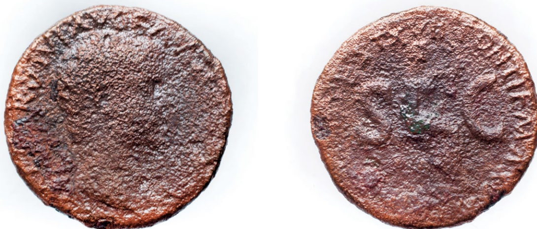
Slika 1. kat. br. 3 avers i revers

Primjerci rimskog carskog novca od prvog do prve polovine 3. stoljeća nisu brojni. Determinirano ih je tek 7 primjeraka. Premda su u prvoj polovini 1. stoljeća bakreni asevi igrali najveću ulogu u svakodnevnom optičaju, determiniran je tek jedan Tiberijev primjerak (kat. br. 3, slika 1). Slijedi Trajanov dupondij (kat. br. 4), novac u vrijednosti dva asa, te srebrni denar Marka Aurelija iz druge polovine 2. stoljeća (kat. br. 5). Razdoblje Antonina zastupljeno je s još dva primjerka koji bi po portretu mogli pripadati Marku Aureliju ili Komodu (kat. br. 6, 7). Jedan je as, a drugi sestercij, brončani novac u vrijednosti četiri asa. Iz samog kraja drugog i prve polovine 3. stoljeća su dva srebrna denara, jedan Septimija Severa, a drugi Aleksandra Severa s likom Julije Mameje (kat. br. 8, 9).