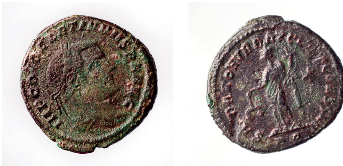
Slika 2. kat. br. 20 avers i revers

Druga polovina 3. stoljeća donosi nešto veći intenzitet dotoka novca. Isključivo je riječ o antoninijanima među kojima su s pet primjeraka najbrojniji primjerci cara Galijena (kat. br. 10–14). Ovima valja pribrojati i jedan primjerak za koji se ne može točno utvrditi pripada li Valerijanu I. ili Galijenu (kat. br. 15). S dva antoninijana zastupljen je car Klaudije II Gotik (kat. br. 16, 17) dok se po jedan primjerak može pripisati Aurelijanu (tip Divus Claudius ) (kat. br. 18) i Maksimijanu (kat. br. 19).