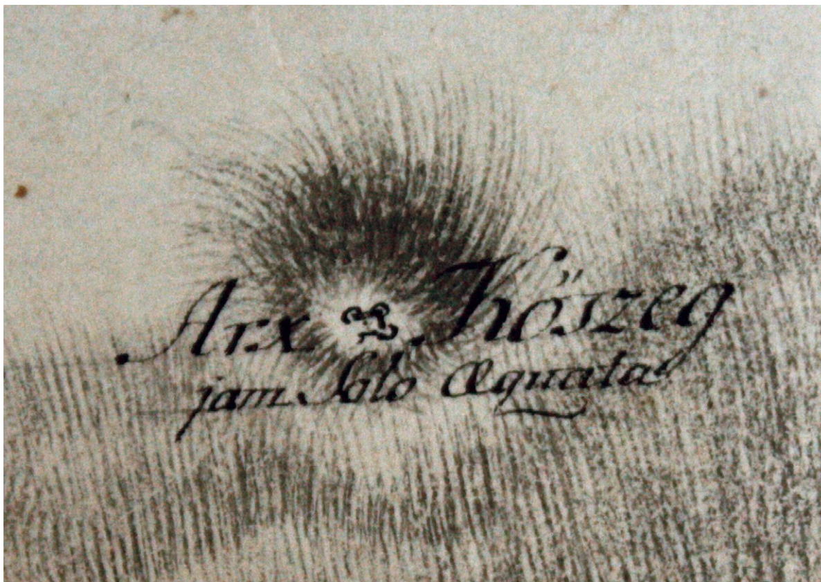
Slika 1. Batina (Gradac) – zemljovid (dio) iz 1796. s ucrtanim položajem i izgledom rimske fortifikacije (HR-DAOS-470-C,1/1).

Flavianenses (NDO XXXIII: 45). Premda se i equites i cuneos ponekad običava datirati poslije 378. g. (Haas 1845: 113; Várady 1897: 84), iz izvora ( Jord., Get. 166; Marcell., Chron. Min. , 427, 1) je jasno da su oni pogranične fortifikacije u Panoniji tada već bili napustili (Kovács 2004; Quast 2008).