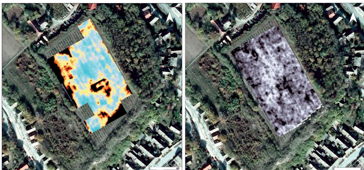
Slika 2. Zmajevac ( Várhegy ) – rezultati istraživanja metodom geoelektričnog otpora i georadarskom metodom na dubini 0,5–1 m na snimci Državne geodetske uprave RH-a (Muzej Slavonije & Gearh d. o. o., 2017).