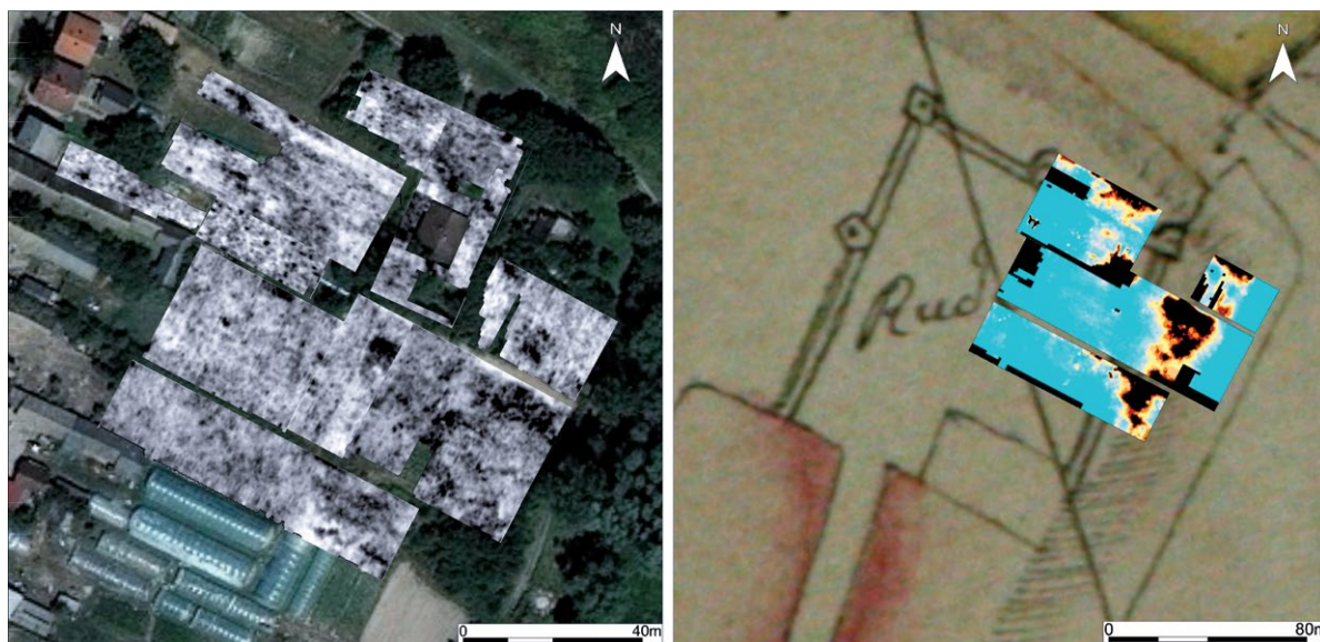
Slika 5. Kopačevo (Baksád) – rezultati istraživanja georadarskom metodom i metodom električnog otpora na snimci Državne geodetske uprave RH-a i zemljovidu (dio) HR-DAOS-470-C,11/18 (Muzej Slavonije & Gearh d. o. o., 2016).