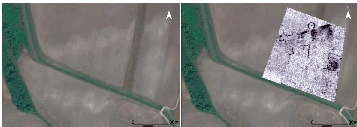
Slika 4. Popovac (Pogan, Mala Lačka i Loĝor) – izgled fortifikacije i rezultat istraŝivanja georadarskom metodom na sjeveroistoĉnom dijelu lokaliteta na snimci Drŝavne geodetske uprave RH-a (Arheoloŝki muzej Osijek & Gearh d. o. o., 2018).

tetragona povrŝine oko 5 ha (sl. 4). Uz sjeverni bedem te fortifikacije, ŝirok do 5 m, na razdaljini od oko 40 m identificirane su dvije, prema van usmjerene, okrugle kule promjera oko 15 m, te dijelovi triju pravokutnih graĊevina ĉvrstih temelja od kojih je ona u sredini poduprta kontraforima. Najistoĉnija graĊevina mogla je obuhvaćati prostor od oko 30 x 30 m i tek je – jer je podignuta s otklonom prema utvrdi – potrebno razjasniti u kakvom je odnosu s ostatkom fortifikacije, izgraĊene prije 378. g. Unutra, istoĉniji segmenti zidova objekta u oĉuvanome dijelu mjere 25 x 20 m, a zapadniji oko 30 x 10 m.