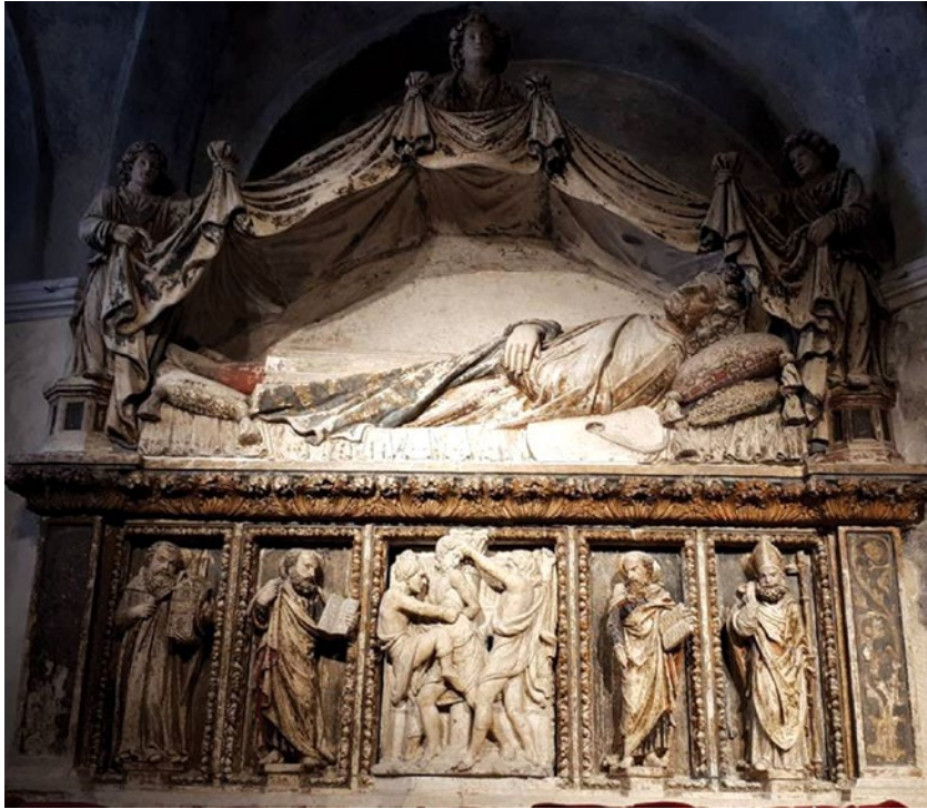
Sl. 9. Oltar s moćima sv. Anastazija, katedrala sv. Dujma, Split, rad J. Dalmatinca, 1448. g.

ski patrijarh Pompon otkrio relikvije svetih mučenika Hermogena i Fortunata (Sl. 12). 124 Zapisi bizantskih kroničara Teodora lektora i Teofana spominju da je patrijarh Genadije zapovjedio 468. g. da se relikvije sv. Anastazije prenesu ( translatio ) iz Sirmija u Konstantinopol i ondje pohrane na sigurno. 125 S druge strane, podatak o prijenosu relikvija može se nalaziti i na materijalnim izvorima, kao onaj na ploči s natpisom da su relikvije sv. Justine i Zenona u srednjem vijeku bile prenesene u katedralu sv. Justa u Trstu. 126