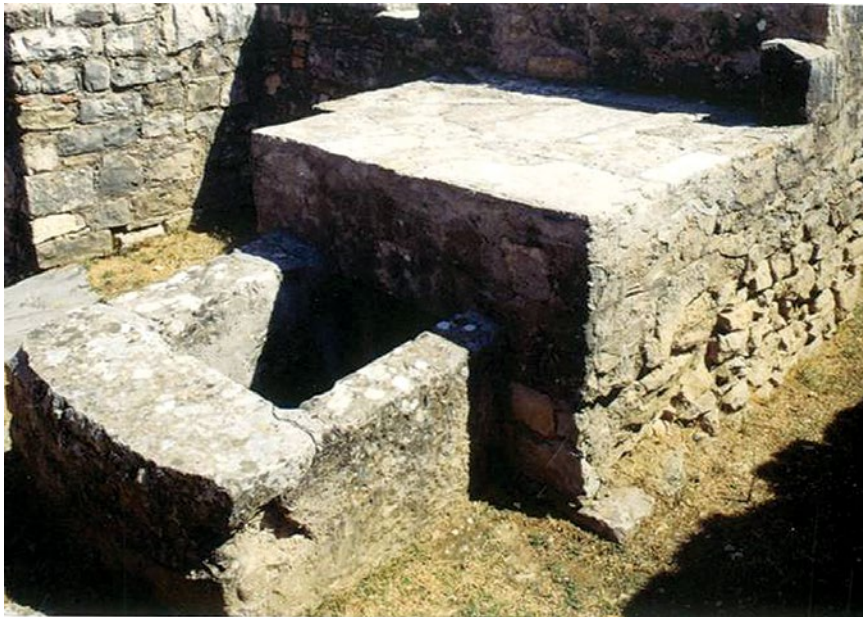
Sl. 3. Grobnica Salonitanskih mučenika u memoriji, Manastirine, Salona, rano 4. st. (Cambi 2002, 303, sl. 8)

Zidani grob može varirati izgledom; imati dodatke poput fenestella confessionis pokrivene mramornim pločama kao za Domnija, 102 i profilirana menza na Manastirina za Venancija, 103 ili poput groba s tesellom kao oltarom na Kapljuču – Antiohijan, Gajan, Telij i Paulinijan, 104 a u jednostavnijim slučajevima grob je samo pokriven pločom sa ili bez natpisa mučenika – Asterije, Justina i Zenon. 105