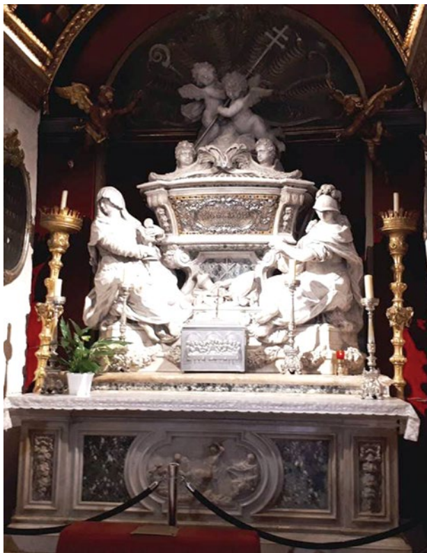
Sl. 10. Oltar s moćima sv. Dujma, katedrala sv. Dujma, Split, rad G. M. Morlaitera, 1767. g.