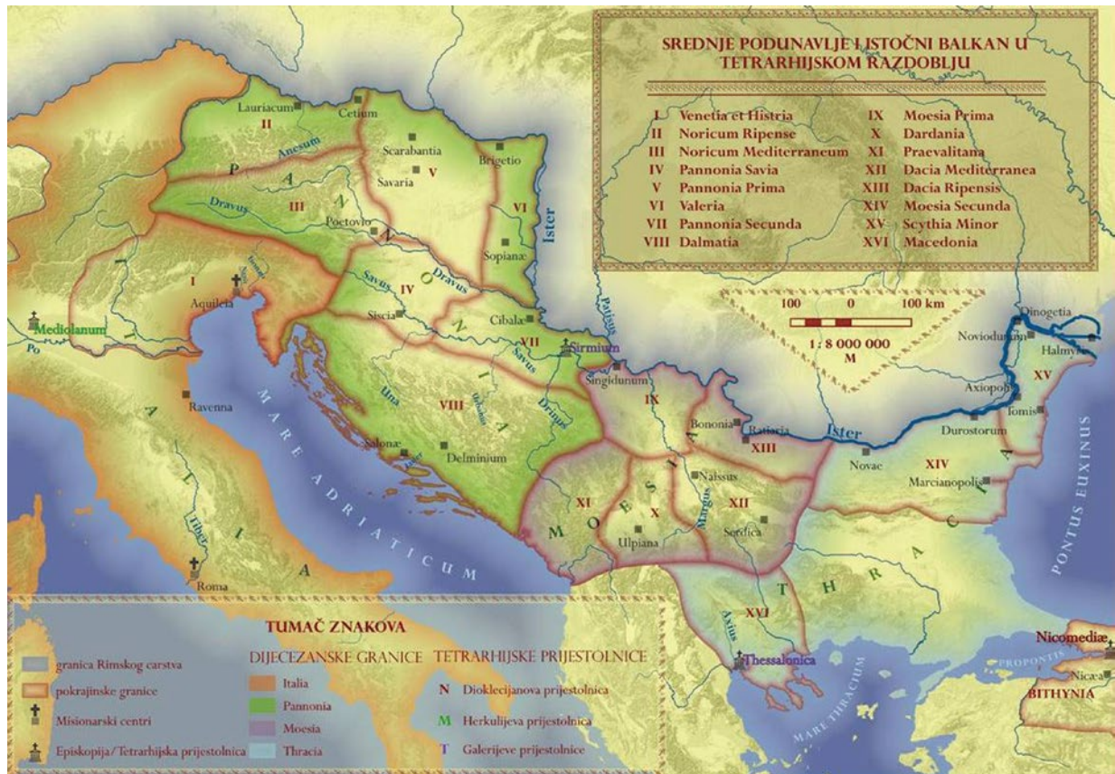
Karta 1. Srednje Podunavlje i istočni Balkan u tetrarhijskom razdoblju (izradila F. Kovačić)

Područje današnje Istre bilo je u X. italskoj regiji Venetia et Histria koja je bila dio dijeceze Italije, a dijeceza Panonija imala je sedam provincija: Noricum Ripense , Noricum Mediterraneum , Pannonia Inferior , Savensis , Dalmatia , Valeria , Pannonia Superior . 3 Granice ovih dijeceza izlaze iz okvira hrvatskog povijesnog prostora, stoga će se u radu promatrati i oni mučenici koji su stradali u pokrajinskim centrima koji se danas nalaze u susjednim državama.