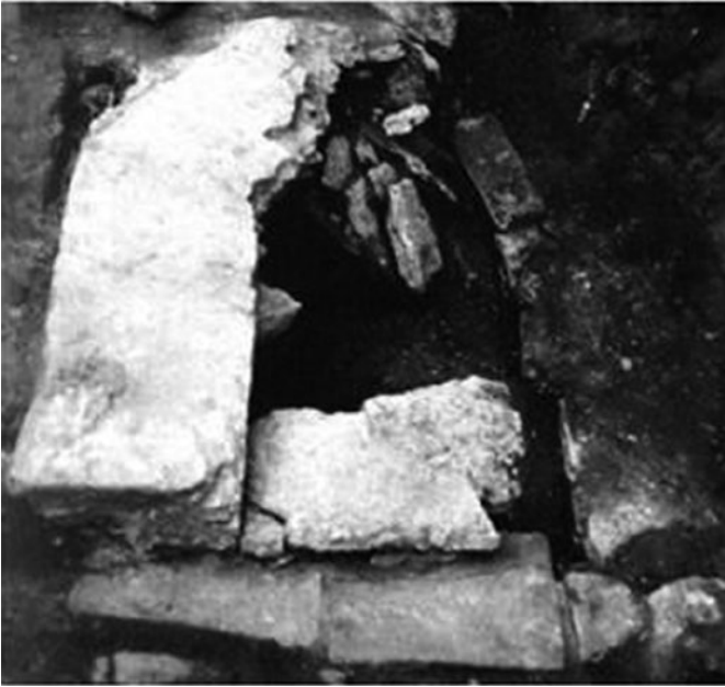
Sl. 2. Grob Kancija, San Canzian d'Isonzo, 4. st. (Luciano 2014, 371, sl. 502)

ili relikvije Zenona uz Justinu u Trstu. Najjednostavniji način bio je polaganje u nišu u kubikulu u rimskim katakombama ad duos lauros na via Labicana u Rimu za Četvoricu Ovjenčanih. 101