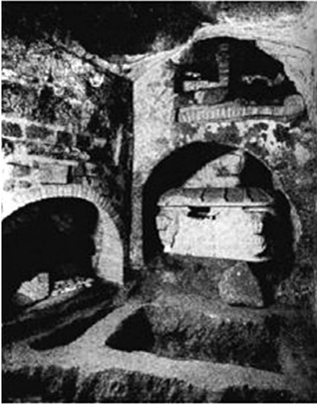
Sl. 6. Kubikul 54 Quattro Coronati u katakombama ad duos lauros u Rimu, 4. st. (Luciano 2014, 304, sl. 98)

vanja kulta to mogla učiniti, relikvije su bile položene u oltar crkve, poput Kvirina Sisačkog u oltaru u Santa Maria Trastevere u Rimu (Sl. 7); 119 Kanciji u oltar istoimene crkve u San Canzian d' Isonzo (Sl. 8); 120 ili polaganje relikvija Četvorice Ovjenčanih u oltar crkve Santi Quattro Coronatti u Rimu. 121 Nezaobilazni su oltari u splitskoj katedrali sv. Dujma u kojima su pohranjeni ostaci salonitanskih mučenika: u lijevi bočni oltar iz 1448. g. pohranjene su relikvije sv. Anastazija (Sl. 9), a u glavni oltar iz 1767. g. moći sv. Dujma (Sl. 10). 122