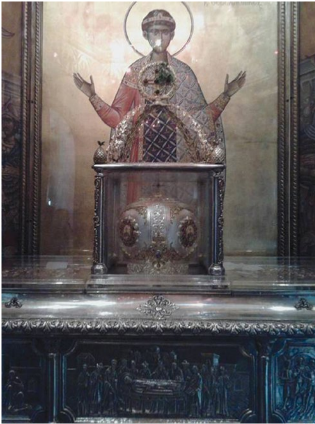
Sl. 4. Relikvije sv. Demetrija, Solun, sadašnje stanje

Sirmija u Konstantinopol, 109 Domnii iz Salone u Split, 110 Demetrije iz Soluna u Sirmij (Sl. 4). 111