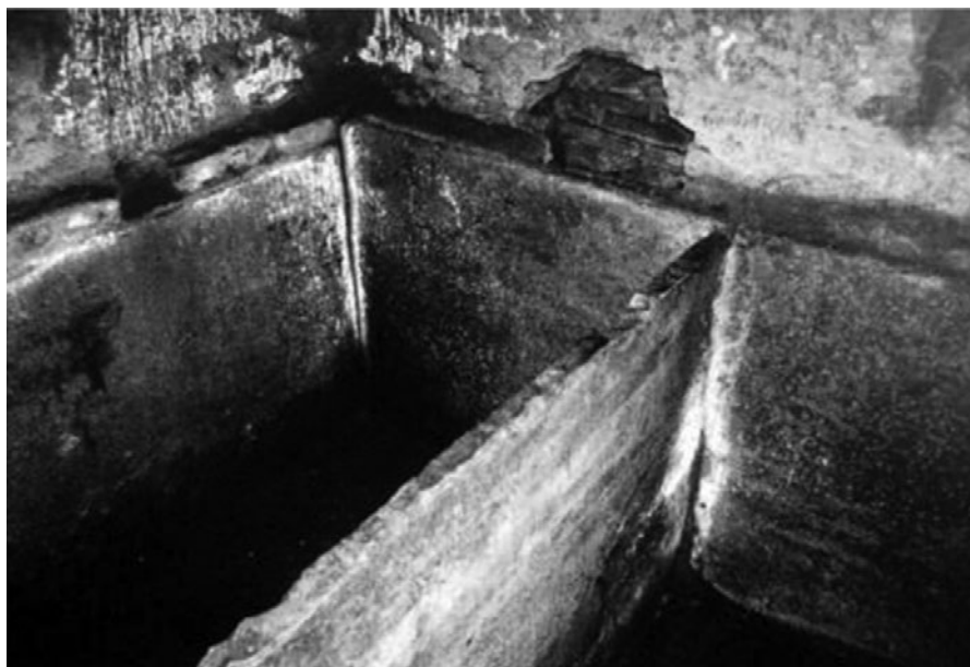
Sl. 5. Kaseta za polaganje relikvija u katakombi sv. Sebastijana, Rim, poč. 5. st. (Luciano 2014, 347, sl. 358)