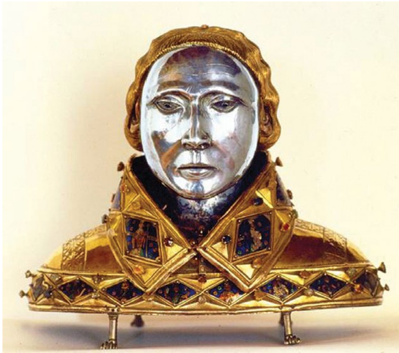
Sl. 12. Relikvijar sv. Donata, Cividale, 15. st. ( http://www.dizionariobiograficodefriulani.it/ , pristupljeno: 30.09.2019.)