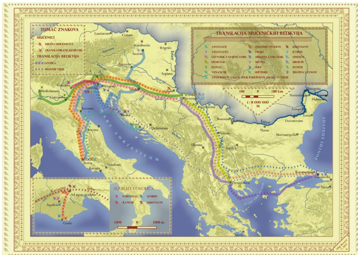
Karta 2. Translacija mučeničkih relikvija u kasnoj antici (izradila F. Kovačić)