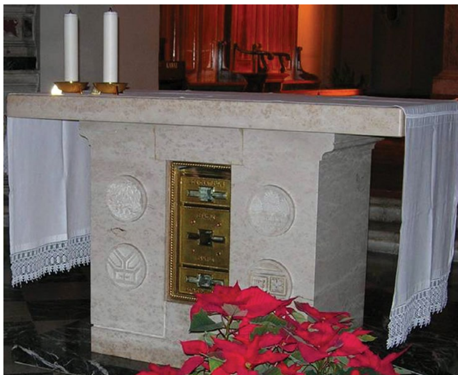
Sl. 8. Relikvije Kancija u oltaru crkve sv. Kancija, San Canzian d'Isonzo, sadašnje stanje