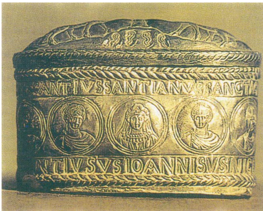
Sl. 11. Relikvijar s prikazom Kvirina i Kancija, Grado, 5. st. (Wiewegh 2004, 26)