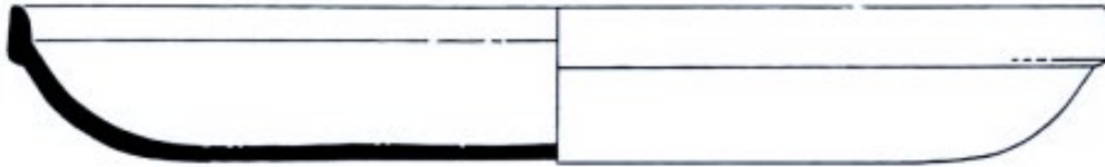
Hayes 61 B