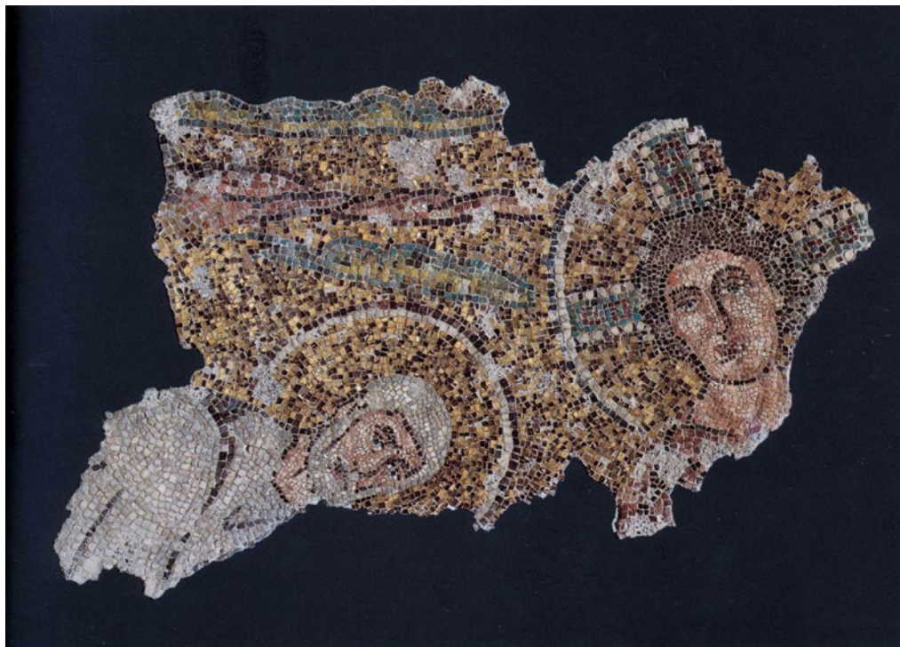
Sl. 4 Pula, fragment mozaika s prikazom Traditio legis iz sv. Marije Formoze, sredina 6. st. (prema Cambi 2002)

like. Njegova je važnost u tome što jasno potvrđuje da su, uz Sv. Mariju Formozu, u Puli i mnoge druge građevine imale bogatu mozaičku tradiciju.