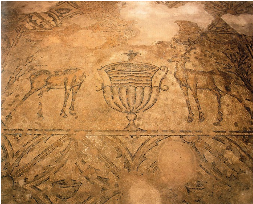
Sl. 2 Zadar, mozaik s prikazom jelena sa strana kantara, oratorij u kompleksu katedrale, 6. st. (prema Meder 2003)

Južno od katedrale u Zadru, u katekumeneju, izrađen je također motiv s jelenima sa strana kantara, a datira se u 6. st. (Sl. 2). 31 Ovaj je motiv vještije i raskošnije izveden nego onaj u saloničanskom baptisterijalnom sklopu. Boje su bogatije, a figure su vitkije i gipkije, što govori o njegovoj kvaliteti. U odnosu na solinski fragment mozaika s glavom jelena, ovaj je prikaz ipak inferiorniji. Velika površina apsida bazilike u Novalji na otoku Pagu prekrivena je u cijelosti mozaikom geometrijskog tipa. Apsida je bila ukrašena s tri međusobno odvojene mozaičke kompozicije. Djelomično je očuvana središnja mozaička kompozicija (dio rubne ukrasne trake – motiv „pasji skok“). 32 Lijeva je mozaička kompozicija uokvirena motivom „pasjeg skoka“, dok je unutrašnja površina raščlanjena nepravilnom mrežom osmerokuta i četverokuta, u čijim se središnjim dijelovima nalaze vegetabilni i geometrijski motivi (rozete, Solomonov čvor, stabljike s lišćem i s pupovima i sl.). Desna mozaička kompozicija uokvirena je ukrasnom trakom koju formiraju trokuti, a unutar te kompozicije nalaze se kvadrati i ukras sličan „malteškom“ križu.