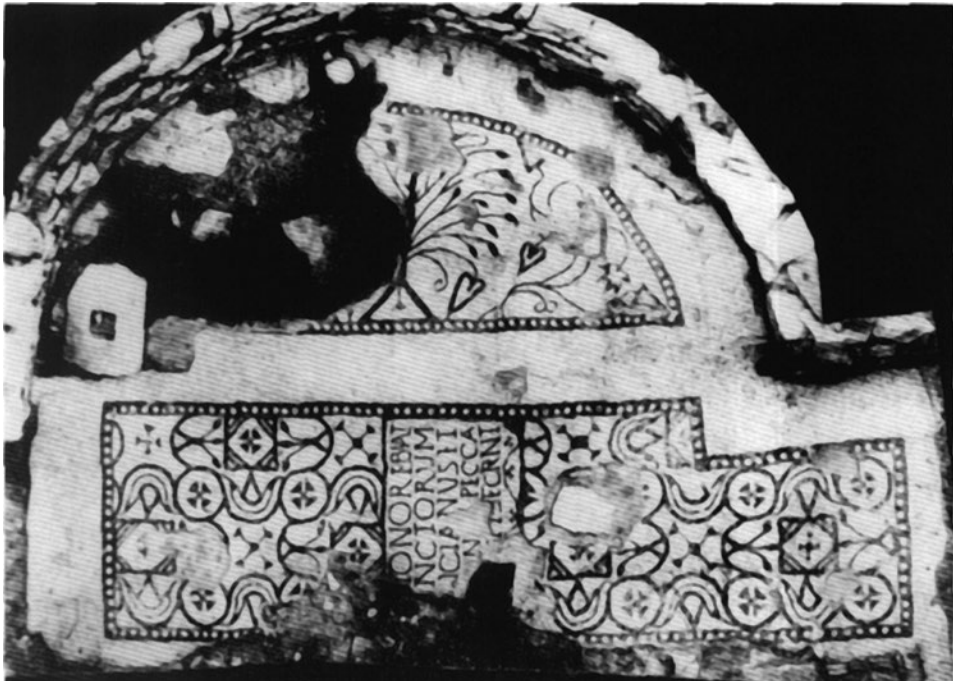
Sl. 3 Betika, mozaici iz trolisne kapele sv. Andrije, 1. pol. 5. st. (prema Marušić – Šašel 1986)

Mozaični tepisi u Istri češće su podijeljeni na polja, nego oni u Dalmaciji. Slično kao u Poreču, bilo je i u Betiki. 49 Tepisi su zavjeti pojedinaca ili porodica i koncepcijski su nekoherentni. 50 Ipak ima podova koji su izvedeni po jedinstvenom planu i figuralno su znatno bogatiji. U omanjim poljima tih mozaika mogu se nalaziti razni motivi vegetabilnoga i figuralnoga karaktera. U Betiki se javlja podni mozaik izveden u crno-bijeloj tehnici (trolisna kapela) (Sl. 3) te polikromni (trobrodna bazilika). U kapeli su ornamentalni motivi u središnjem dijelu geometrijski, dok su u apsidama samo vegetabilni te u dva slučaja sa simboličkim značenjem. Motivi sa simboličkim značenjem svakako su stilizirana palmeta – drvo života (u sredini) te sa strane trs loze – simbol Krista. 51 Mozaički pod središnje lađe bazilike dosta je oštećen, no mozaički su natpisi dobro očuvani. Veće istočno polje bilo je ispunjeno uglavnom s jednakim uzorcima, kakvi su ukrašavali i kapelu, dok je manje zapadno bilo ispunjeno koncentričnim krugovima, duguljastim rombovima te viticama. 52