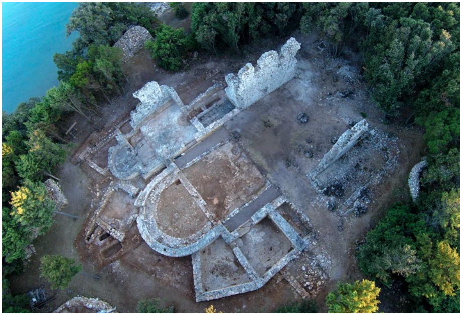
Sl. 3 Zračna snimka crkve u uvali Martinšćica na Punta Križi, otok Cres po dovršetku istraživanja 2017. g. (slikao M. Vuković u okviru sustavnih istraživanja pod vodstvom M. Čaušević-Bully i S. Bully)

“Crkveni sklop” koji se nalazi u uvali Martinšćica na Cresu blizak je onom otkrivenom na položaju Cickini kod Malinske na otoku Krku. Razdvaja ih samo činjenica da je prva izgrađena uz more, dok je potonja, kako smo to već objasnili, izgrađena dalje od mora, u uskoj vezi s kopnom otočnom prometnicom. Crkva u Martinšćici nalazi se na poluotoku Punta Križa, koji je u antičko vrijeme zasigurno pripadao ageru grada Osora ( Apsorus ), a u kasnoj antici osorskoj dijecezi. Uvala u kojoj se smješta ovo crkveno zdanje nalazi se uz plovni kanal kojim se plovilo uz otoke Cres i Lošinj, na putu za Kvarnerić, plominski, pa riječki zaljev (Sl. 3).