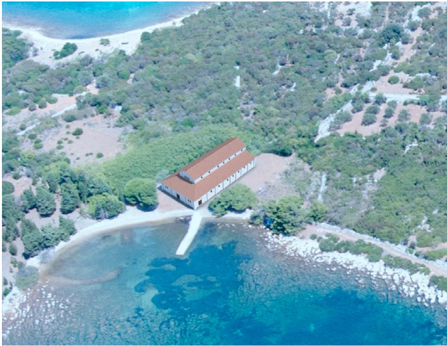
Sl. 4 Prijedlog 3D rekonstrukcije ranokršćanske crkve otkrivene na otočiću Sveti Petar kod Ilovika (D. Vuillermoz, prema S. Bully i M. Čaušević-Bully)

Izgradnja bazilike takvih dimenzija vezana je uz postojanje velike pomorske vile, smještene na nekoliko stotinjaka metara od bazilike. Vila je zasigurno pripadala akvilejskoj senatorskoj porodici u Ranom Carstvu, kako to možemo pretpostaviti na temelju nadgrobnog natpisa Gaja Kornelija, akvilejskog kvatuorvira s kraja 1. st. pr. Kr., 44 no koja je bila u funkciji i tijekom kasne antike, sudeći prema nalazima keramike pronađene prilikom njenog rekognosciranja. No veza s antičkom vilom, koliko god ona prestižna mogla biti, nije dovoljna da bi objasnila veličinu same bazilike, koja dimenzijama ravnima velikim gradskim bazilikama nadilazi skromne dimenzije otočića Sv. Petar. Uzmemo li u obzir širi kontekst u kojem se ovaj lokalitet nalazi, shvatit ćemo moguć razlog zašto je tomu tako. U nedavnoj smo objavi 45 sugerirali da su otoci Ilovik i Sveti Petar imali funkciju značajne pomorske postaje na glavnom plovnom putu istočnom jadranskom obalom između Salone i Akvileje, s ulogom posrednika u organizaciji prijevoza i trgovine unutar kvarnerskog otočja, odnosno prema riječkom zaljevu i Senju, pa time i kontinentalnim provincijama.