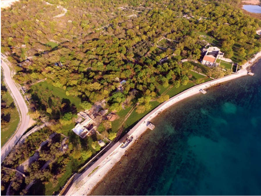
Sl. 2 Zračna snimka "crkvenog sklopa" na Mirinama (lokalitet Fulfinum – Mirine, Omišalj, otok Krk) (slikao Kaducej d. o. o. u okviru sustavnih istraživanja pod vodstvom M. Čaušević-Bully i S. Bully)

Slučaj ranokršćanske crkve na Mirinama u Omišlju na otoku Krku posebno je složen. Crkva se smješta na skutovima rimskog municipija Fulfina osnovanog u 1. st. po. Kr., najkasnije sredinom 5. st., u trenutku u kojem grad, iako još uvijek naseljen, opada, da bi bio u potpunosti napušten tijekom 7. stoljeća (Sl. 2). 20