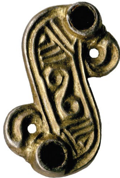
Sl. 4 S-fibula iz zasipa groba 917

Istom periodu pripadaju još barem dva groba: jedan, većim dijelom uništen, grob 878, pronađen je istočnije od crkve, u pravcu prilaznog puta. U njemu je bila mala brončana četvrtasta pređica. Drugi grob nalazi se sjevernije, desetak metara udaljen, od spomenutog groba 50. Posve je uništen kasnijim višestrukim pokopima od 11. do 14. st. Uz kosti pronađene u raci, naknadno u razvijenom srednjem vijeku iskopanog groba 917, pronađena je S-fibula (sl. 1; sl. 4). Takvoj fibuli analogije se mogu naći diljem zapadnog dijela Panonske nizine, a posebno su česte u južnoalpskom prostoru, upravo na visinskim utvrdama kakva je i ova. Nositelji tih fibula mogu biti Romani kao i Germani, u ovim krajevima gotski saveznici Alamani ili možda Langobardi. S-fibula pripada vrlo čestom tipu Várpalota – Vinkovci i datira se, između ostalog, na temelju arheoloških slojeva pete crkve ovdje spominjanog Hemmaberga, u kraj 5. i u prvu trećinu 6. st. 10 To odgovara poziciji i loborskog uništenog groba uz crkvu. O tom tipu fibule puno je pisano te je zanimljivo da se u alpskom prostoru pripisuje kako Romanima, tako i Alamanima koji su taj nakit vjerojatno preuzeli od Langobarda, a u istočnim dijelovima Panonije najčešće samo Langobardima. Taj tip nošen je upravo u turbulentnim vremenima