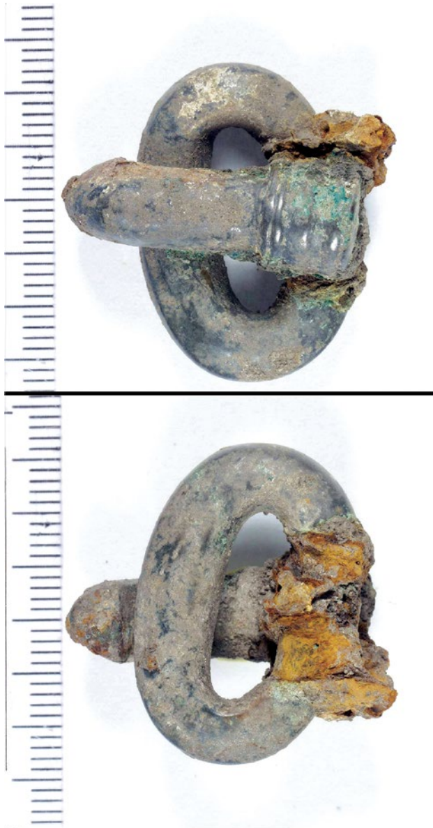
Sl. 3 Grob 50 – brončana pređica s ostacima željeznog okova

Također, iste te 2002. god. prigodom arheoloških istraživanja sa sjeverne strane postojeće crkve na vrlo maloj dubini, odmah ispod humusa, uza zid spomenute najsjevernije prostorije, sa sjeverne strane ranokršćanske crkve pronađen je grob 50 s predmetima (sl. 1; sl. 2, 1; sl. 3). Grob je iskopan tik uza zid ranije spomenute najstarije prigradene prostorije, gledano od istoka prema zapadu, te ima istu orijentaciju (Z – I) kao temelj zida. U grobu su pronađeni dijelovi pojasne garniture koja se sastoji od brončane pređice za zakapčanje s naglašenom bazom trna na kojem su vidljivi ostaci željeza, možda željeznog okova. U tor-