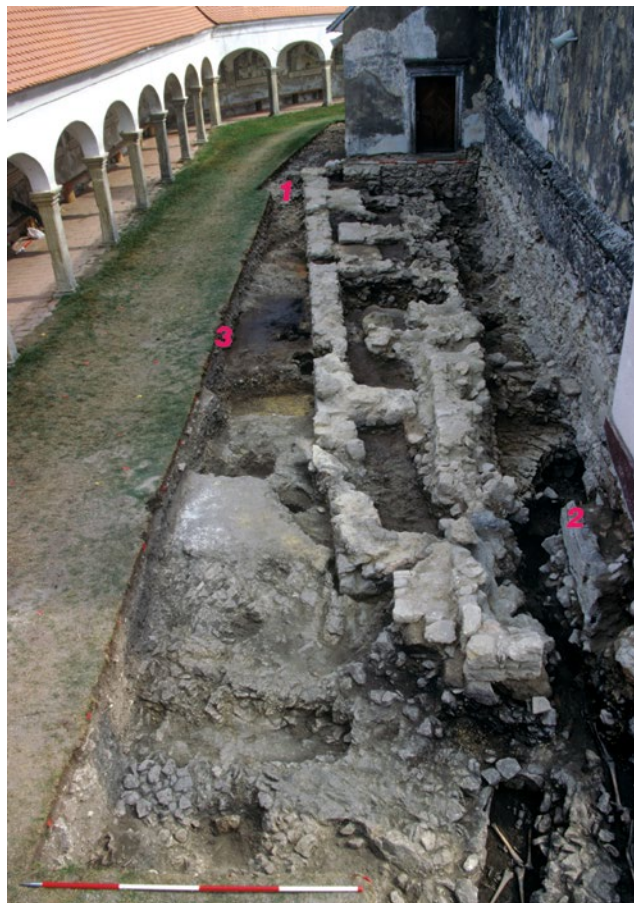
Sl. 2 Arheološka istraživanja 2002. god. Ranokršćanska i predromanička crkva s označenim položajem groba 50 (1), grobnice u nartekusu (2) i crnim slojem s garom i pepelom iznad kanala za zagrijavanje (3)

sazidana vrlo kvalitetno od kamena lomljenca s ožbukanom i lijepo uređenom unutrašnjošću (sl. 2). Zatrpani su prilikom podizanja novih prostorija vezanih uz ranokršćansku crkvu. U kanalu i oko njega pronađeno je dosta pepela i gara, što bi upućivalo na to da su one bile zahvaćene požarom. Sličan sloj s paležom, garom i naslagama pepela može se pratiti i na drugim pozicijama uz crkvu, ali i podalje od crkve. Taj sloj s tragovima paleži nije povezan s kasnijim slojem paljenja kojim je definitivno završila upotreba crkve, utvrde te cijelog naselja pred kraj 6. ili možda na početku 7. st (sl. 2, oznaka 3). 2 Taj drugi, kasniji, sloj paleži najbolje je vidljiv u zgradi ranokršćanske prostorije, na zidovima crkve popucanima od visoke temperature i pretvorenima u vapno, na obrambenom bedemu, ali također u i oko crkve u sloju koji se jasno odvajao od ovog spomenutog sloja. Između najrazličitijeg zbira predmeta u tome starijem sloju paleži nađena je kasnoantička strelica, što bi možda sugeriralo na vojni sukob, ili na nemire, uslijed kojeg je ta zgrada bila zapaljena, a bliža okolica popaljena. Strelica ima tri brida i podsjeća na kasnoantičke strelice 4. i 5. st. Spomenuti kanali, ako nisu vezani uz stariju građevnu fazu crkve, mogu pripadati nekoj starijoj kasnoantičkoj zgradi, mogućem hramu, kojem je mogao pripadati