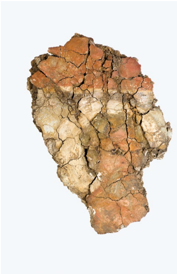
Sl. 4 Freska s prikazom glave sveca (4. st.) nađena u istraživanjima bazilike 1953. godine (foto: I. Krajcar)