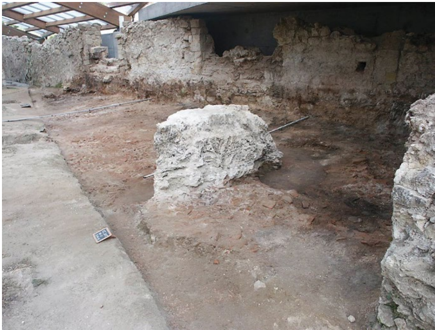
Sl. 2 Bazilika, pogled na istočni zid s prozorima, istraživanje 2004. godine