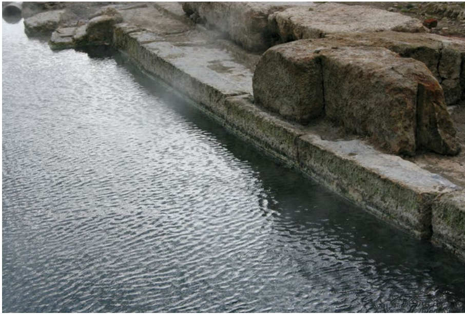
Sl. 7 Termalna voda u izvorišnom bazenu

rištena je postojeća građevina i, s relativno manjim intervencijama, preuređena u sakralni objekt. Povećanjem poda i dodatnim povišavanjem prostora apside, koja dobiva funkciju prezbiterija, te vjerojatno i novim oslikavanjem stropnih površina (glava sveca) postignut je karakter ranokršćanskog objekta. Zbog toga se može zaključiti da je oblik ranokršćanske bazilike s upisanom apsidom ovdje bio direktna posljedica korištenja postojeće rimske arhitekture koju se prilagodilo potrebama kršćanskih obreda. S obzirom na pretpostavku da nađene slikarije (glava sveca i rajska ograda) vremenski nisu nastale u istoj fazi, može se pretpostaviti da se radilo o opremanju prostora u više faza, odnosno pretpostavlja se još jedan građevinski zahvat krajem 4. st. kada je dograđen i prostor južno od bazilike. Premda je ranokršćanski horizont posljednja faza funkcioniranja ovog kompleksa, vrlo je malo nalaza iz tog vremena, što je vjerojatno posljedica planskog napuštanja objekata. 46