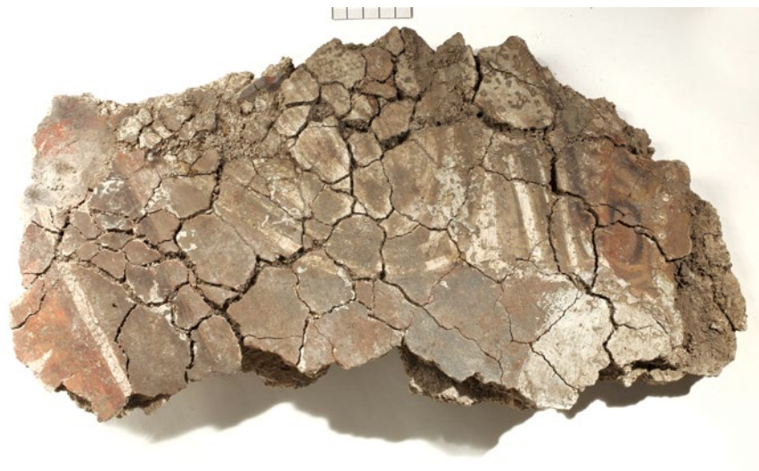
Sl. 5 Freska s prikazom draperije (4. st.) nađena u istraživanjima bazilike 1953. godine