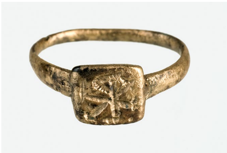
Sl. 6 Brončani prsten s kristogramom (4. st.) nađen u izvorišnom bazenu 2012. godine

Da se radilo o sakralnom prostoru, pokazuje i sačuvana zidna slikarija s prikazom dvije dijagonalno prekrizene crvene crte (na žučkastoj podlozi s nešto zelene boje), a koja se tumači kao fragment stilizirane rajske ograde. 37 Upravo stilska razlika u sačuvanim freskama (glava sveca i rajska ograda) daje argumente za dvije građevinske faze tijekom 4. st. vezane uz ranokršćanski horizont na lokalitetu. 38 U raniju fazu može se smjestiti realistični prikaz glave sveca, ali s obzirom na gore opisanu arheološku situaciju tek oko sredine 4. st., dok se pojednostavljeni prikaz rajske ograde treba povezati s nešto kasnijom fazom, odnosno datirati u kraj 4. st.