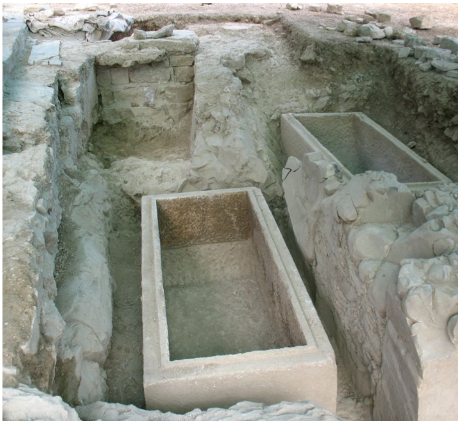
Sl. 6 Pogled na grobnicu i sarkofage smještene ispod poda sjevernog broda „bazilike“

zato dijelovi njegove konstrukcije, pretežito ulomci tegula i kamena, pronađeni u njenoj ispuni. Sačuvani su samo sjeverni i južni zid grobnice u visini od 0,75 do 1 m i u dužini od oko 2,30 m. Širina grobnice iznosi 1 m. Na istočnom kraju južnog zida grobnice uočen je početak konstrukcije svoda (57,49 m / nv) od tegula. Pod grobnice je bio pokriven debljim slojem žbuke koja se samo djelomice očuvala (56,60 m / nv). U njoj nisu pronađeni osteološki ostatci, što upućuje da je još u antici izgubila svoju funkciju. Na to ukazuje i solidno građena zidana konstrukcija postavljena u njezinom istočnom dijelu. 44 Zapadni zid grobnice nije sačuvan i najvjerojatnije je srušen kad se kopala raka za sarkofag (S-6). Na sjevernom i južnom zidu grobnice otkriveni su ostatci višebojnih oslika. 45 Iako je žbuka prekrivena slojem skrame, naziru se biljni motivi u crvenoj, zelenoj i oker boji na bijeloj podlozi. 46 U ispuni grobnice su pronađeni brončani novci s kraja 4. st., a među njima jedan pripada Konstanciju II., što bi upućivalo na vrijeme njena rušenja. Nakon toga se uređuje