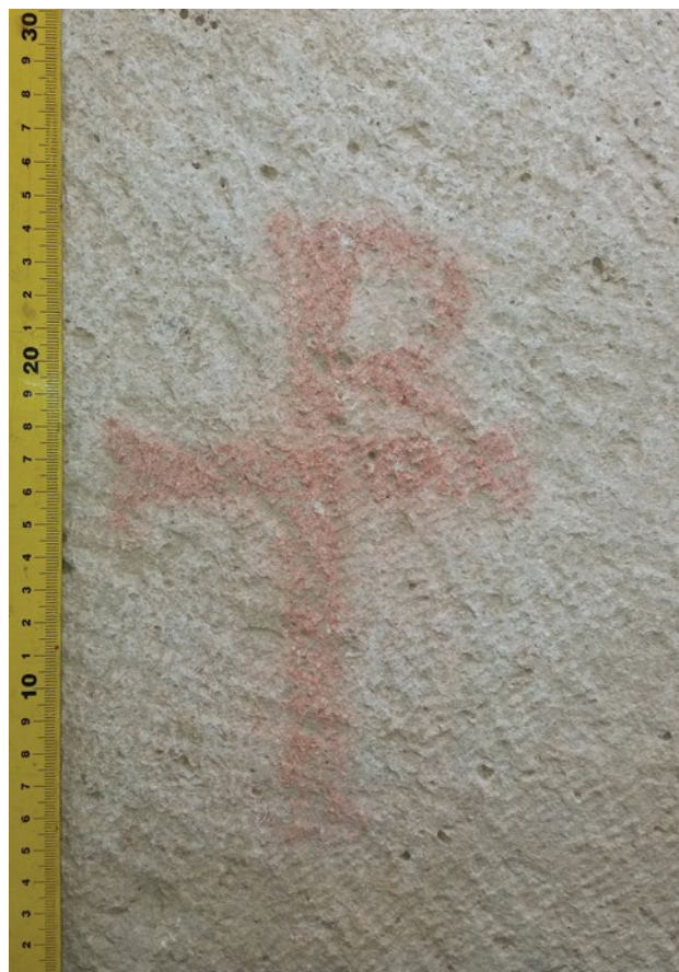
Sl. 5 Desni akroterij s prikazom monogramatskog križa

U sjevernom brodu „bazilike“ pronađen je i jedan novi sarkofag (S-6) smješten sjevernije od tri već ranije poznata anepigrafska sarkofaga ( o , p i q ), otkrivena 1893. godine. 28 Svi sarkofazi su položeni u smjeru istok-zapad. Novootkriveni sarkofag je dužine 220 cm, širine 98 cm i visine 115 cm, od čega na poklopac otpada 63 cm. Nalazi se ispod slabo očuvanog poda ovog dijela građevine položen u grobnu jamu iskopanu u tupini. Sanduk sarkofaga je imao istaknuto postolje uz prednju južnu i dvije bočne strane, a na sjevernoj strani poklopca se nalazila velika rupa nastala tijekom pljačkaških pohoda nakon pada grada. U sarkofagu su pronađena dva skeleta djelomice zatrpana zemljom iz gornjih slojeva u kojoj je, osim brončanog novca Arkadija, pronađeno više ulomaka mramornih i vapnenačkih ploča, dijelova popločanja koje se nalazilo nad sarkofagom. Nalaz novca s kraja 4. st., ili samog početka 5. st., ukazuje da je sarkofag tu položen najvjerojatnije neposredno prije gradnje i uređenja ovog dijela „bazilike“ koje je nastupilo početkom 5. st. 29 Na sanduku sarkofaga nije nađen natpis, ali su na akroterijima južne, prednje strane poklopca otkriveni Kristogrami, odnosno monogramatski križevi (sl. 5) napisani crvenom bojom direktno na finije klesarski obrađenu površinu kamena. 30