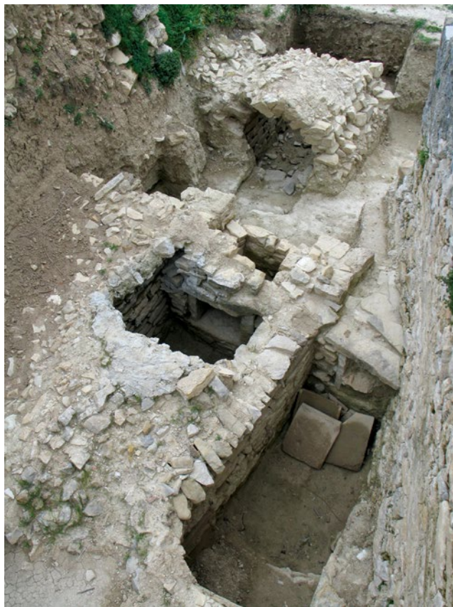
Sl. 1 Presvođene grobnice istočno od Raum -a IV

Od 2007. godine započelo se s provođenjem konzervatorsko-restauratorskih radova kojima su obuhvaćeni arhitektonski ostatci sjevernog i istočnog dijela građevine, otkriveni u revizijskim istraživanjima pod vodstvom E. Marina. Izvršena je sanacija i konsolidacija te djelomična rekonstrukcija arhitektonskih ostataka u Raum I, II, IV i V te u sjevernom brodu i sjevernom aneksu „bazilike“. 17 Tijekom ovog procesa došlo je i do otkrića novih grobova. Prilikom razlaganja sre-