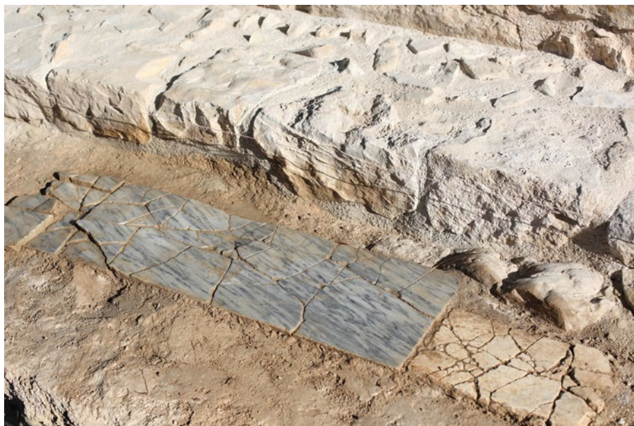
Sl. 3 Dio popločenja in situ u sjevernom brodu „bazilike“

aciju. 24 Uz klupu su otkriveni dijelovi poda građevine izvedenog pretežito od mramornih ploča i južnije smještene ostatke zidane grobnice iz ranije faze. Istraživanja su nastavljena 2017. godine otvaranjem sonde (11 x 3,5 do 4 m) kojom je obuhvaćena klupa cijelom dužinom i prostor južno od nje (sl. 2). Obje istraživačke kampanje su pokazale da se uz klupu prostiralo popločanje koje se sastojalo od mramornih i vapnenačkih ploča. Popločanje se najbolje očuvalo uz istočnu stranu klupe u dužini od oko 1,80 m i širini 1,15 m. Sastojalo se od nekoliko pravokutno oblikovanih mramornih ploča raznih veličina koje su postavljene jedna do druge. Samo je jedna ploča, smještena najistočnije (57,55 m / nv) sačuvana gotovo u cjelosti tako da smo bili u mogućnosti utvrditi njene dimenzije koje iznose 95 x 27,2 cm (sl. 3). Preostale su slabije očuvane. Debljina ploča varira od 1,8 cm do 2,7 cm. Dio popločanja je činila i jedna manja vapnenačka ploča (dim. 30,5 x 18,5 cm) koja