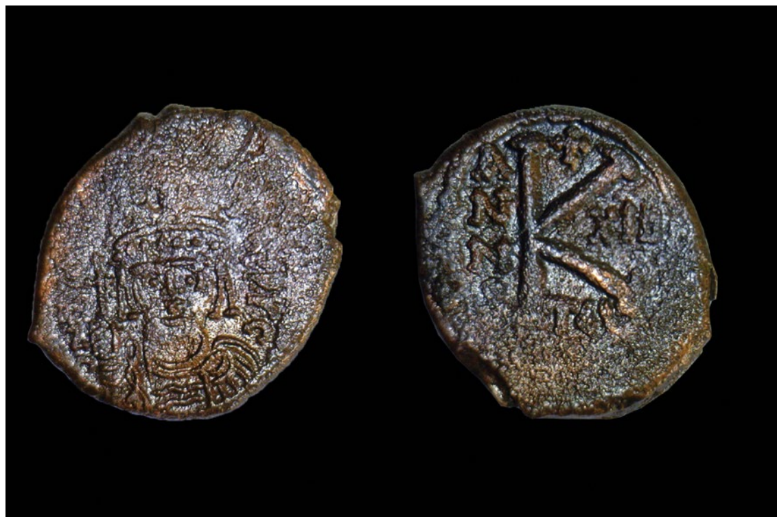
T. 1.4 Bizantski novac u vrijednosti 20 numa cara Mauricija Tiberija, emitiran iz Tesalonike