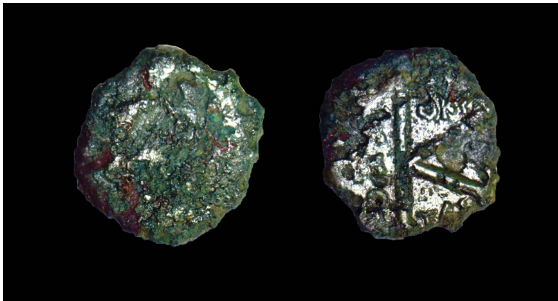
T. 1.3 Bizantski novac u vrijednosti 20 numa cara Justina II, emitiran iz Tesalonike