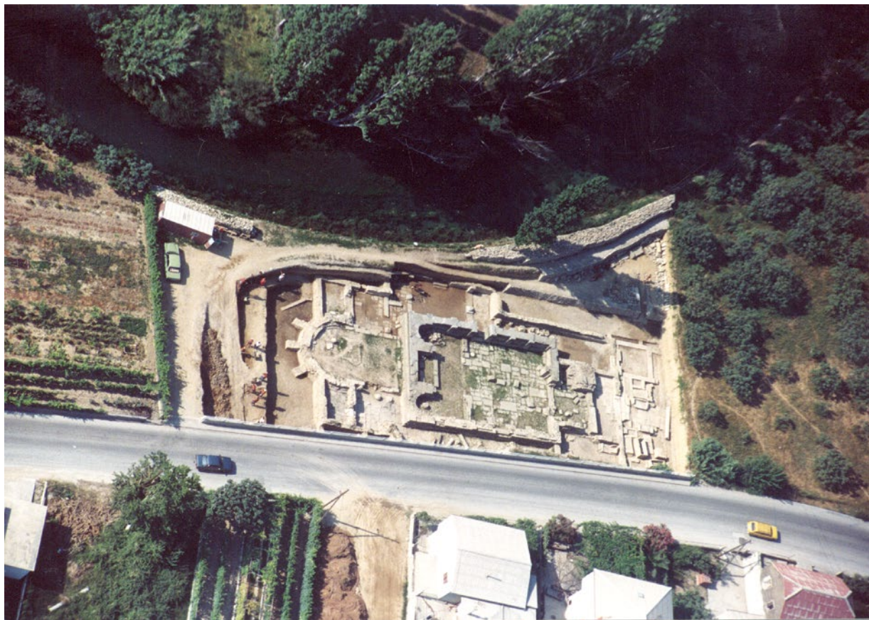
Sl. 1 Zračni snimak Šuplje crkve (autor Tonko Bartulović, preuzeto iz Piteša 2012, 134)