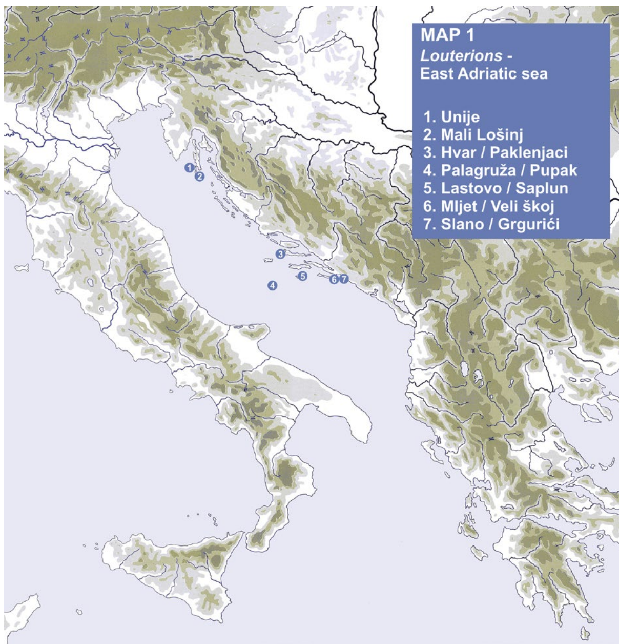
Karta 1. Luteriji na istočno jadranskoj obali (autor: D. Perkić, 2018).

U podmorju hrvatskog dijela Jadrana, za sada je, zajedno s predmetnim luterijem, poznato 7 nalaza