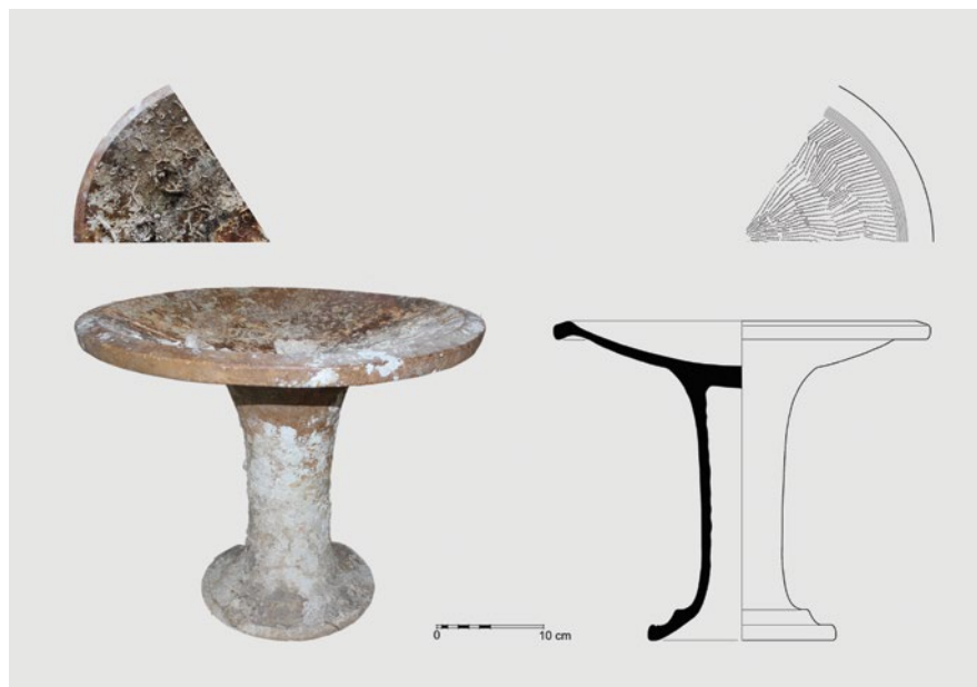
Slika 2. Luterij (louterion) iz privatne zbirke, Grgurići, Slano (crtež: M. Perkić, 2017).

Najiscrpniji prikaz i pregled luterija, kao podvodnih arheoloških nalaza, na hrvatskom dijelu istočne ja-