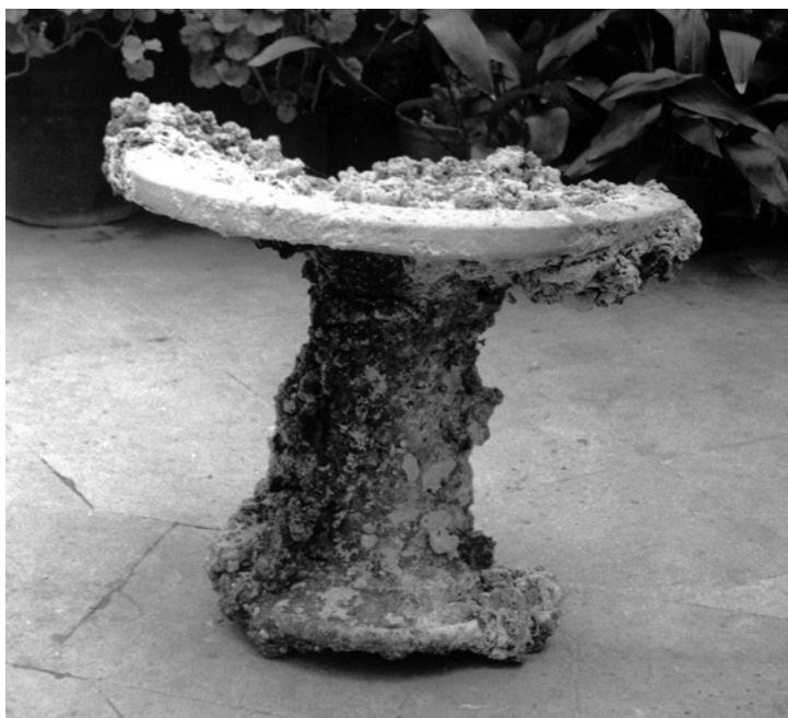
Slika 3. Luterij (louterion), Veli škoj, Mljet

Pored navedenih, poznat nam je i jedan primjerak luterija pronađenog na lokalitetu Veli škoj kod Mljeta (sl. 3). Nažalost, podatci o njemu se temelje tek na jednoj fotografiji nakon ilegalnog vađenja i navodnog nestanka na crnom tržištu na području Njemačke 3 . Mljetski luterij nije u potpunosti sačuvan, ali oblikom u mnogočemu sliči primjerima s Lastova i našeg iz Slanog. U podmorju Velog škoja nalazi se više arheoloških lokaliteta, odnosno ostataka brodoloma. Najpoznatiji je brodolom s teretom mramornih sarkofaga i mramornih ploča različitih dimenzija iz 3. st. po. Krista (Miholjek & Mihajlović 2011: 216–218; Zmaić 2011: 727–729; 2012: 854–855). No, u njihovoj blizini su i ostatci brodoloma s teretom amfora Lamboglia 2 i Dressel 6A (1. st. pr. Krista) (Zmaić 2010: 763), što bi ujedno bio i najstariji lokalitet. Prema usmenim informacijama, koje imamo vezano uz mljetski luterij, nije moguća uža