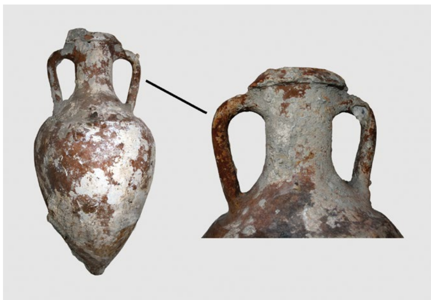
Slika 1. Grčko-italska amfora iz privatne zbirke, Grgurići, Slano.

U prosincu 2013. godine, u Konzervatorskom odjelu u Dubrovniku, zaprimljena je prijava o izvjesnim arheološkim nalazima, koji su davno prije pronađeni u moru, a danas se nalaze kod gosp. Miljenka