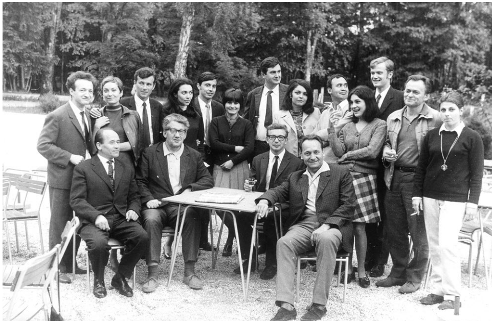
Profesori i studenti Odsjeka za sociologiju Fiozofskog fakulteta u Zagrebu - generacija 1965./1966.