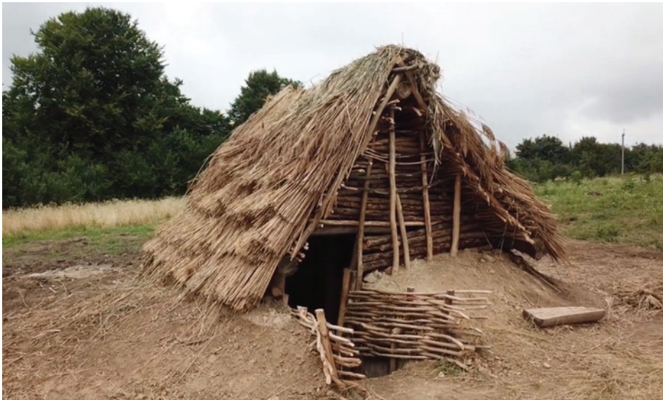
Slika 15: Rekonstrukcija slavenske kuća iz 9. – 10. st.