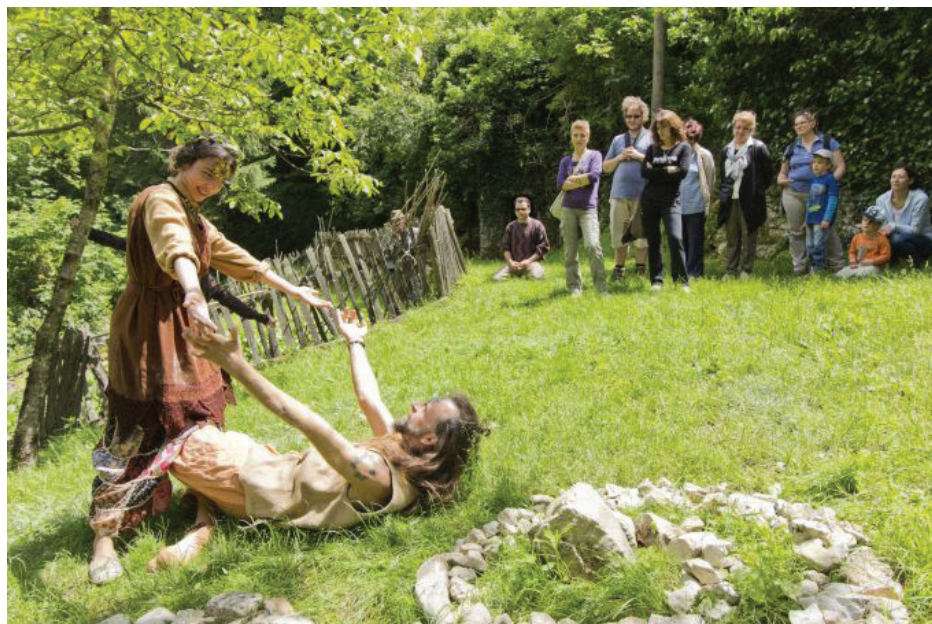
Slike 5: Uprizorenje mitske predstave u Trebišćima 2014. godine

nematerijalne baštine te zaboravljenih vjerovanja starih Slavena. Izleti, koji se održavaju nekoliko puta godišnje od proljeća do jeseni, imaju i svrhu poticanja razvoja ruralnog područja dok Staraj naglašava važnost zadržavanja intimnog karaktera te izbjegavanje amerikanizacije i plastičnih priča u razvoju Mitskopovijesne staze. Predstava je interaktivna, a u suradnji s lokalnim stanovništvom,