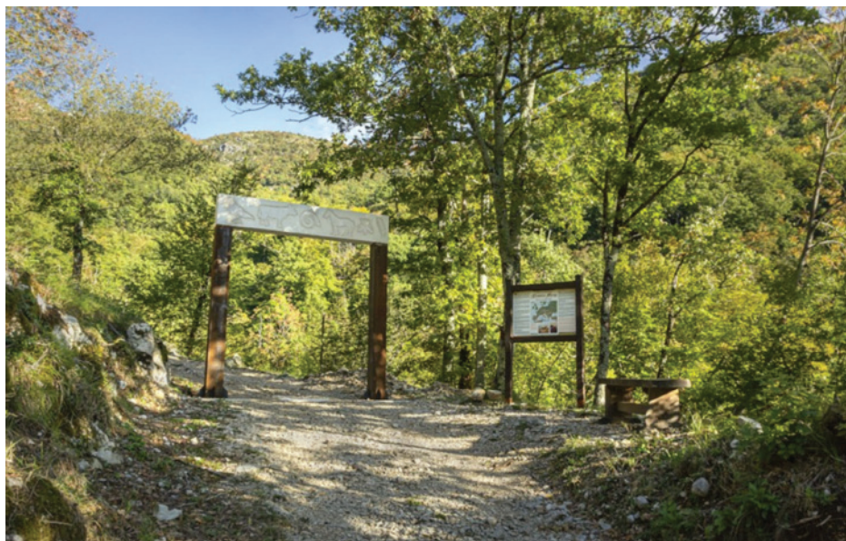
Slika 7: Oznaka ulaza na mitsku stazu, skulptura “Perunov portal” Ljube de Karine