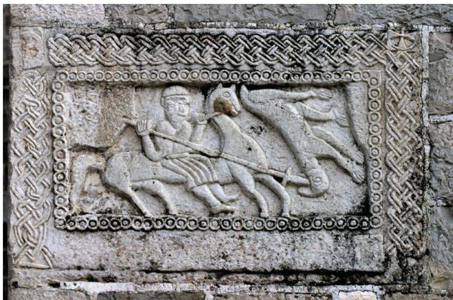
Slika 10: Reljef konjanika na crkvi Uznesenja Blažene Djevice Marije u Žrnovnici

da je na reljefu prikazan mitski boj starog slavenskog boga Peruna i njegovog suparnika Velesa te pomiče dataciju u 8. st. čime smješta taj reljef u najvažnije kulturne spomenike na hrvatskom prostoru (a i puno šire), budući da slični prikazi boga Peruna zasada nisu pronađeni. Jedan od razloga zašto je to tako u širem slavenskom kontekstu bio bi taj da se smatra kako su objekti štovanja starih slavenskih bogova bili izrađeni većinom od drveta koje nije preživjelo ispit vremena ili je bilo vrlo lako uništeno, dok je na području Dalmacije osnovno sredstvo svih aspekata života bio kamen pa ipak postoji veća mogućnost “preživljavanja” ostataka. Reljef konjanika je prema ovakvim interpretacijama trebao postati središnje mjesto žrnovničkoga mitskog prostora no događaji su se odvili drugačijim tijekom. Prvotno je, uz suglasnost Župnog ureda Uznesenja Blažene Djevice Marije i Splitsko-makarske nadbiskupije, dogovoreno da se prema donešenom rješenju Konzervatorskoga odjela u Splitu napravi demontaža kamenog reljefa s pročelja crkve i započne s izvođenjem konzervatorsko-restauratorskih radova u Muzeju hrvatskih arheoloških spomenika u Splitu. Radovi su i započeli krajem 2017. godine, no prilikom vađenja reljefa građani Žrnovnice saznali su informaciju da će nakon restauracije na pročelje crkve biti vraćena samo replika reljefa, a original ostati u Muzeju, što je bilo dovoljno da se oko cijelog postupka