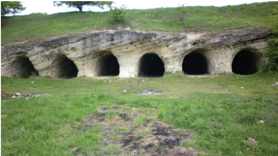
Slika 14: Kompleks izdubljenih pećina u Stiljskom

Taj slavenski kompleks poganskih svetišta iz razdoblja između 8. i 10. st. sa središtem u selu Stiljsko većina ukrajinskih znanstvenika smatra jedinstvenim spomenikom hrvatsko-ukrajinske povijesti i kulture ranoga srednjeg vijeka (slika 14). Povijest istraživanje Stiljskog seže još u 1980-te godine zahvaljujući naporima lokalnih entuzijasta koji su poslali pismo Ukrajinskom društvu za zaštitu spomenika povijesti i kulture spominjući brojne predaje i priče koje mještani