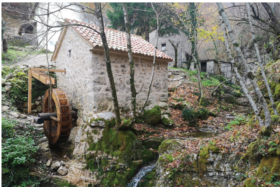
Slika 6: Obnovljen mlin u Trebiščima, otvoren 2020. godine