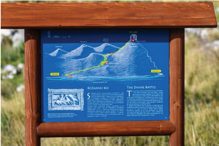
Slika 13: Jedna od informativno-edukativnih ploča na stazi

prosječnim hodom se prijeđe u 1,5 h, a opremljena je interpretativnim tablama, koje šetača provode kroz kulturne slojeve od vremena antike, preko praslavenske mitologije do kršćanstva” (“Tematska staza ‘Put do sv. Jure’ na Perunu” 2021). Staza je 2021. u cijelosti snimljena i tehnologijom Google Street View te ju posjetitelji mogu proučiti na Google kartama prije polaska na planinarenje. Zajedničke kulturno-turističke aktivnosti Žrnovnice i Podstrane svake godine se dodatno razvijaju pa su tako u srpnju 2022. udruga Žrvanj i Općina Podstrana organizirale prvi Full Moon Perun , susret tradicionalnih dalmatinskih klapa u noći punog mjeseca, u okviru 1. Perun art festivala. Lokalni mediji izvještavaju da je