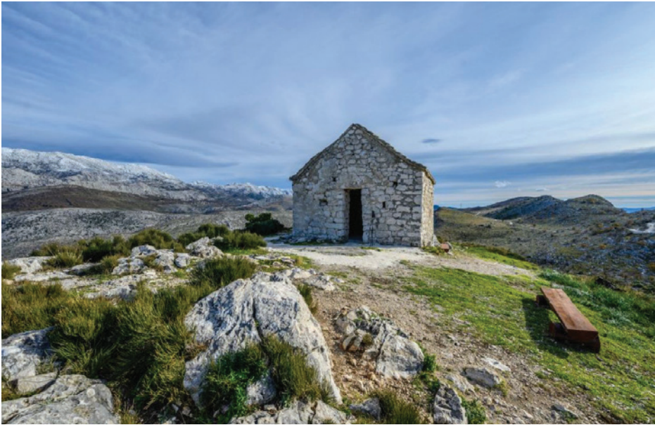
Slika 9: Jedna od crkvice sv. Jure (iz 15. st.) na Perunu danas

je arheolog Andrej Pleterski tijekom svojih dugogodišnjih istraživanja utvrdio da je većina takvog monumentalnog kamenja (baba) uništena zadnjih 50-ak godina, sugerirajući kako se tu možda radi o pokušaju sustavnog negiranja pretkršćanske baštine. Svetost tog prostora u pretkršćanskom smislu potkrepljuju i drugi toponimi, među kojima je jedan od najvažnijih već spomenuti Zmijski kamen , a izdvojio bih još i toponim izvora u današnjem zaseoku Amižići koji se zove Amižića vrelo ili Tribišće , noseći gotovo identičan naziv kao Trebišća u Istri. Žrnovnica je zbog svoga geografskog položaja (“vrata Poljica”) upravo idealan primjer za istraživanje kontinuiteta života na tako malom, ali kroz povijest za sve “vlasti” strateški vrlo važnom prostoru. Arheološki nalazi već iz kasnoga neolitika na lokalitetu Gračić potvrđuju taj kontinuitet, a recentna analiza reljefa smještenoga na matičnoj crkvi Uznesenja Blažene Djevice Marije u Žrnovnici koji prikazuje konjanika koji kopljem probada zvijer baca potpuno novo svjetlo na važnost toga područja (slika 10). Splitski arheolog Ante Milošević, ikonografski analizirajući postojeći reljef umetnut na pročelje današnje matične crkve izgrađene u 18. st. vjerojatno na mjestu starije crkve, dolazi do zaključka kako se na tom prikazu ne radi o Mihovilu koji ubija zmaja, kako su povjesničari umjetnosti ustvrdili ranije datirajući reljef u 12. ili 13. stoljeće. Milošević (2011) smatra