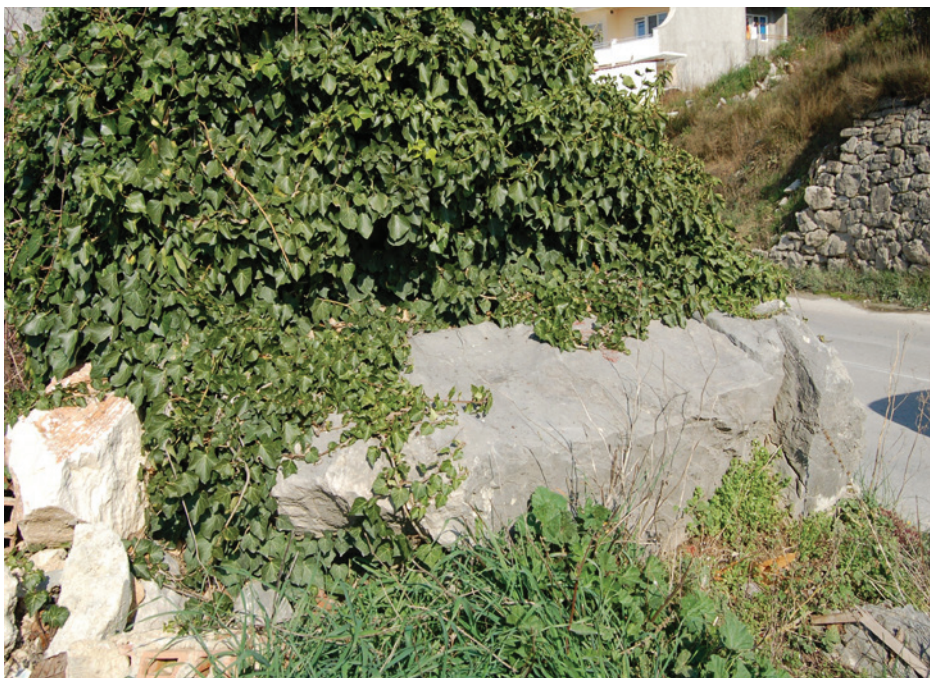
Slika 11: Zmijski kamen prije uređenja