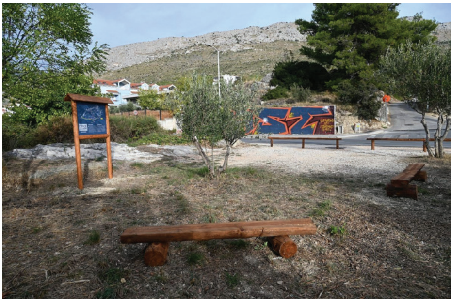
Slika 12: Zmijski kamen poslije uređenja i zaštite