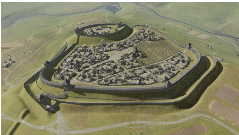
Slika 16: Fragment iz 3D rekonstrukcija grada Plisneska (izvor: Historical and Cultural Reserve 'Ancient Plisnesk', https://www.facebook.com/plisnesko , objavljeno 26. 1. 2023.)

godine je izrađena i 3D video rekonstrukcija ovoga grada (vidi “Пліснеський археологічний комплекс відтепер можна переглянути у 3D” 2019) (slika 16).