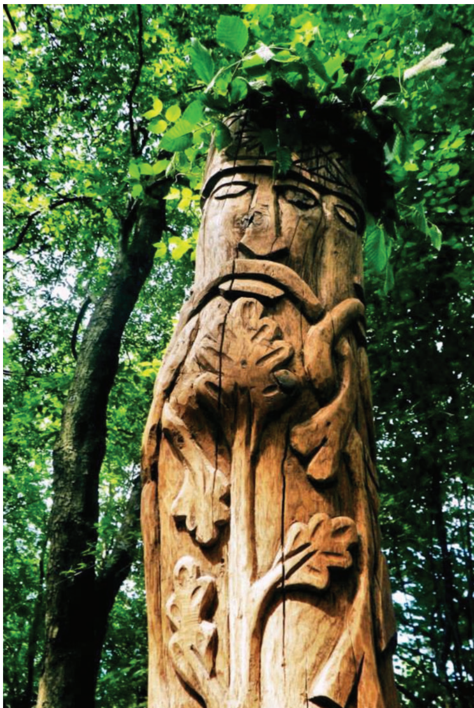
Slika 4: Perunov kip na Perunu