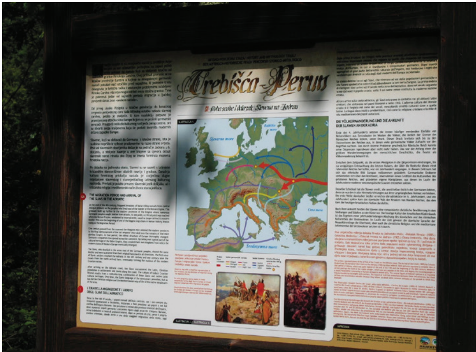
Slika 1: Jedna od edukativnih ploča na stazi