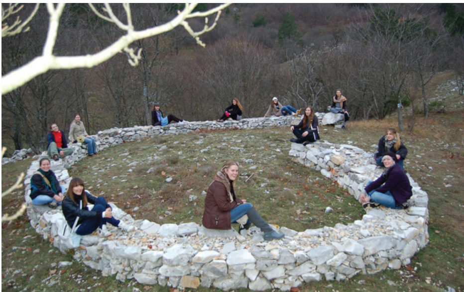
Slika 3: Kamena zmija – “Ulaz u Velesov svijet”, kipara Ljube de Karine

Idući korak u proširenju sadržaja staze bilo je postavljanje nekolicine umjetničkih skulptura s motivima iz slavenske mitologije akademskoga kipara Ljube de Karine u krajobraz oko Peruna i Trebišća. Uz pomoć udruge Dragodid i uz zajedničko volontersko sudjelovanje 70-ak studenata arhitekture, etnologije i kulturne