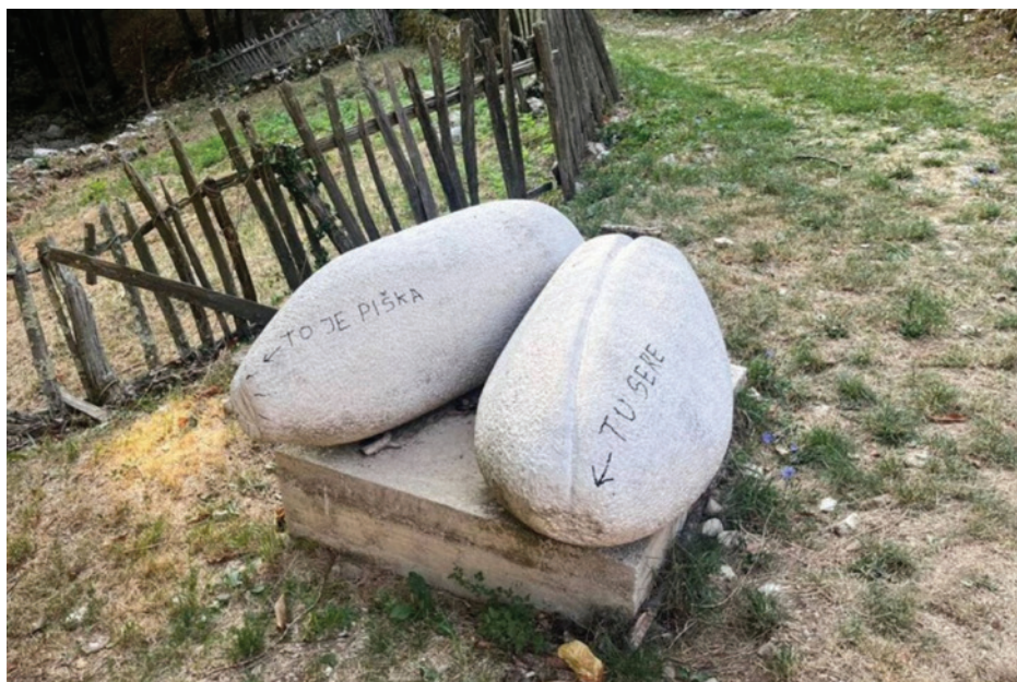
Slika 8: Vandalizirana skulptura zrnja 2022. godine

“Interpretacijski centar nalaziti u ruralnoj kamenoj kući u Trebišćima te će muzeološki i muzeografski interpretirati staroslavensku mitologiju i kroz njenu optiku predstavljati ostale baštinske vrijednosti ovog područja. Završetak uređenja planiran je u listopadu 2023. godine. Uređenje Interpretacijskog centra Kuća stabla svijeta sufinancirano je sredstvima EU (EFRR) u sklopu projekta Povežimo se baštinom. ” (Kužel Ilić 2023)