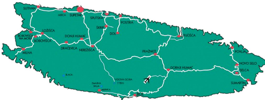
Slika 3. Otok Brač

Brač (najveći otok srednjodalmatinske skupine) (Slika 3) je treći otok po veličini na Jadranu. Sveukupno ima 13 931 stanovnika (DZS, 2022), od čega najveći broj ima općina Supetar, a najmanji Sutivan. Od istraživanih mjesta, Povlja imaju 343 stanovnika, Bol 1694 stanovnika, a Postira 1.448 stanovnika (DZS, 2022).