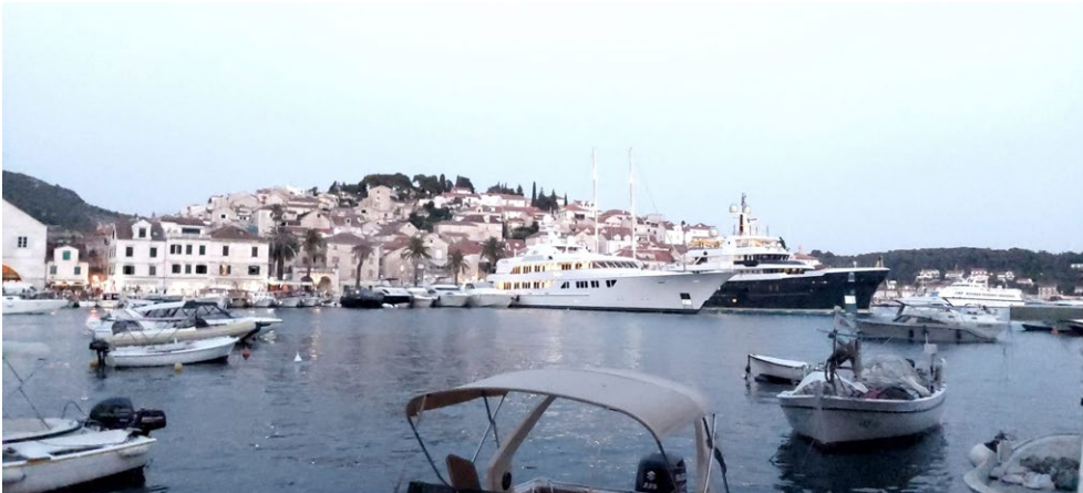
Slika 2. Panorama grada Hvara

„Jedino komunalci još uvijek nekako drže korak s neredom, ali iz godine u godinu sve teže. Turistički razvoj negativno djeluje na ekološko stanje, svake godine je sve više smeća i bezobzirnosti. Fizički, grad je još očuvan i prepoznatljiv, ali za identitet bi rekao da je Hvar poput muzeja koji je prenamijenjen u dječju igraonicu bez nekih intervencija” (informatičar, sezonski).