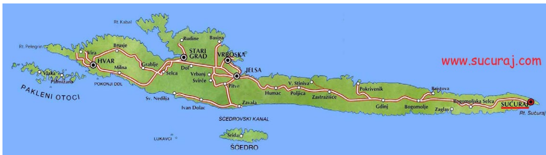
Slika 1. Otok Hvar

Otok Hvar po geografskoj klasifikaciji spada pod srednjodalmatinski i veliki otok (veći od 110 km 2 ), a ima 10.739 stanovnika (DZS, 2022) (Slika 1).