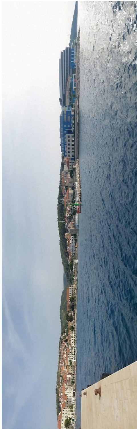
Slika 4. Hotel View i panorama Postira