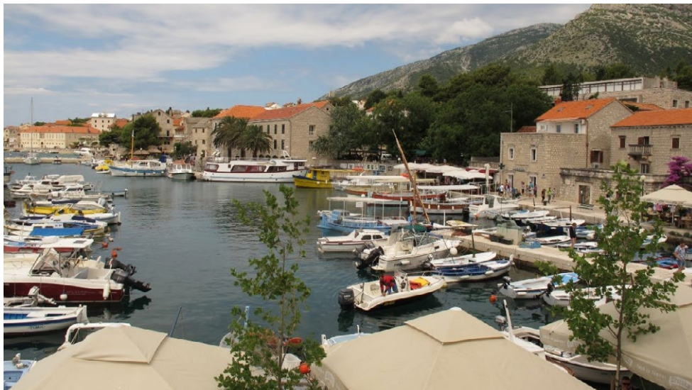
Slika 6. Bol - Panorama

„Ja radim na tome da ispred samostana bude jedan veliki display na kojemu bi se onda moglo predstaviti sve u vezi samostana, Povaljske listine i svemu ostalom. Sve što mi radimo i pokazujemo mora biti originalno i prepoznatljivo. Temelj svih naših projekata mora biti naša izvorna kulturna baština jer je kulturni turizam temelj održivog razvoja turizma“ (knjižničarka, Bol, stalni).