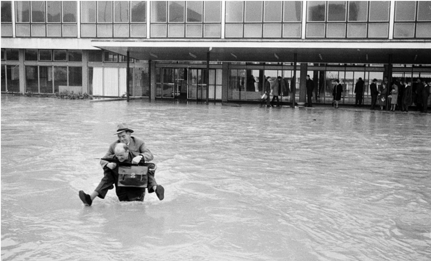
Solidarnost na djelu: Filozofski fakultet tijekom poplave 1964.

prethodno ispitivanje potreba tržišta rada, anketiranje poslodavaca i zaposlenika koji su diplomu stekli na Fakultetu, vrednovanje njihovih kompetencija u svjetlu zahtjeva koje pred njih postavlja određeno radno mjesto te izradu standarda zanimanja i standarda kvalifikacija. Dva su projekta Hrvatskoga kvalifikacijskog okvira provedena pri Fakultetu – „Usklađivanje studijskih programa iz područja društvenih i humanističkih znanosti s potrebama tržišta rada“ i „Izazovi za društvene i humanističke znanosti: novi studiji i sustav kvalitete Filozofskog fakulteta u Zagrebu“ (voditelj: Dragan Bagić, Odsjek za sociologiju) – od 2015. do danas rezultirala revizijom 24 postojećih i uvođenjem triju novih studijskih programa temeljenih na uvidu u recentne transformacije rada. „Učenje kroz rad i sustav upravljanja studentskim iskustvom na Filozofskom fakultetu u Zagrebu“ naslov je još jednoga projekta sufinancirana iz sredstava Europskog socijalnog fonda, kojemu je polazište društveno korisno učenje. Taj projekt započet je 2020. godine posredstvom Klinike Filozofskoga fakulteta, vježbaonice za stjecanje studentske stručne prakse, i uspostavlja mrežu suradnje s potencijalnim poslodavcima, ali ujedno na volonterskoj osnovi nudi stručne usluge u neposrednu društvenom okruženju.