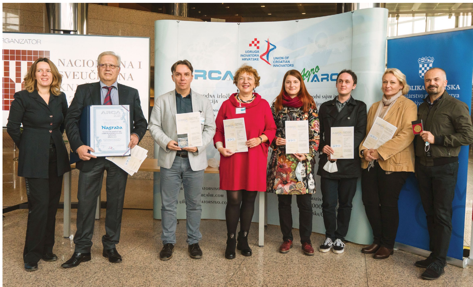
Dodjela nagrada predstavnicima Filozofskoga fakulteta na međunarodnoj izložbi inovacija ARCA, 2021.