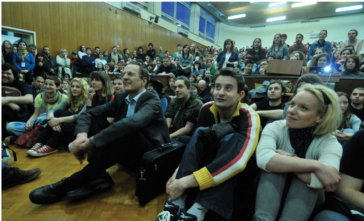
Plenum u Sedmici tijekom studentske blokade nastave na Fakultetu 2009. U prvome redu u sredini sjedi tadašnji rektor Aleksa Bjeliš.

Posljednji društveni pokret na koji ću se osvrnuti iniciran je na Filozofskome fakultetu. Riječ je o prosvjedima i blokadi nastave koju je u proljeće 2009. pokrenula nezavisna studentska inicijativa za pravo na (studentima) besplatno obrazovanje, pri čemu se misli na potpuno javno financiranje obrazovanja bez studentske participacije (Mesić 2009: 79–80). Ta je inicijativa stasala na valu aktivnosti Međunarodnoga studentskoga pokreta, koji se pod parolom „One World – One Struggle“ zalagao za globalnu socijalnu pravdu (Kurelić 2011: 38). U hrvatskome se kontekstu otpor komercijalizaciji visokoga obrazovanja konkretizirao kao protest protiv uvođenja studentske „participacije“ administrativnim dekretom bez prethodne javne rasprave“ (Slobodni Filozofski 2009). Odluku da Filozofski fakultet pretvori u žarište prosvjeda studentska je inicijativa obrazložila sljedećim riječima: „Jedini javni prostor koji nam je neposredno dostupan prostor je javne ustanove na kojoj se obrazujemo. Pretvarajući ga u prostor za artikulaciju zahtjevâ u obranu demokratskih interesa javnosti, preuzimamo svoj dio odgovornosti u obrani općih društvenih interesa od socijalno destruktivnih procesa komercijalizacije i socijalne polarizacije po imovinskom ključu“ ( ibid. ).