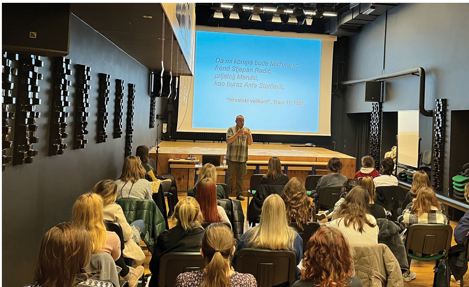
Popularizacija studija kroatistike u Klasičnoj gimnaziji u Zagrebu, 2021.

kao ključnu odgojno-obrazovnu vrijednost u domeni očuvanja identiteta (Hrvatski sabor 2014). Na našem se Fakultetu k tomu obrazuju stručnjaci i prevoditelji za 27 stranih jezika.