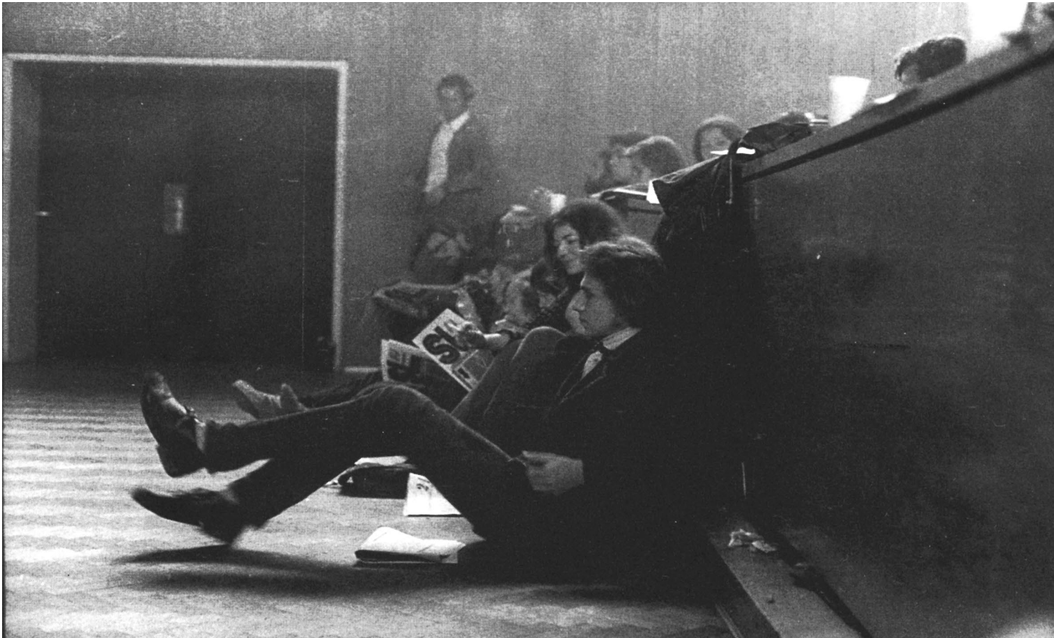
Studentski zbor u Sedmici, 1971.