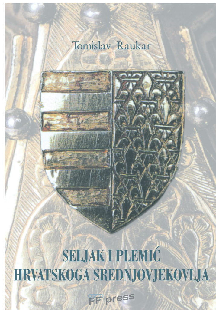
Naslovnica priručnika Tomislava Raukara Seljak i plemić hrvatskoga srednjovjekovlja (2002), službeno prve publikacije objavljene u FF pressu.

FF press potpisuje i cio niz zbornika u čast ( Festschrift ) zaslužnih profesora i znanstvenika, ali i spomenica preminulim profesorima. Mnogi su zbornici i spomenice objelodanjeni u suradnji i na inicijativu odsjekâ Filozofskoga fakulteta koji su nemalim prinosom svojih djelatnika prikupili, uredili i za objavu priredili u njima publicirane radove i članke. U formi spomenica objavljena su primjerice izdanja posvećena Filipu Potrebici (2004), Danku Grliću (2004), Josipu Adamčeku (2009), Reneu Lovrenčiću (2016) i Marini Bricko (2019). Među zbornicima u čast možemo izdvojiti one za Miru Kolar-Dimitrijević (2003), Tomislava Raukara (2005), Miroslava Šicela (2006), Antu Peterlića (2006), Milivoja Solara (2007), Aleksandra Stipčevića (2008), Mirka Tomasovića (2008), Vitomira Belaja (2009), Nikšu Stančića (2011), Dunju Fališevac (2012), Anticu Menac (2012), Radoslava Katičića (2014), Igora Fiskovića (2015), Milenka Popovića (2016), Augusta Kovačeca (2018), Zvonka Makovića (2018), Dragu Roksandića (2019), Mirjanu Sanader (2020), Miru Menac-Mihalić (2021), Nenada Moaćanina (2022), Ekrema Čauševića (2022), Boženu Vranješ-Šoljan (2022), Vinka Brešića (2022), Željku Fink Arsovski (2022), Nedu Pintarić Kujundžić (2023) i dr.