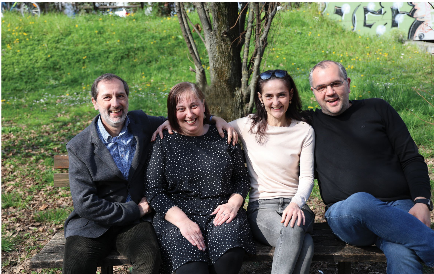
Djelatnici FF pressa, 2023.

Kao što je ranije spomenuto, iako Filozofski fakultet nije izdavač, ipak predstavlja svojevrsan dom mnogim časopisima koji su iznimno važni za pojedina područja koja se na Fakultetu studiraju i izučavaju. Od trenutno aktivnih časopisa treba spomenuti one koji su izdanja znanstvenih društava: Hrvatskoga sociološkog društva ( Revija za sociologiju i Polemos ), Hrvatskoga filozofskog društva ( Filozofska istraživanja , Synthesis philosophica i Metodički ogledi ) te prije svega Hrvatskoga filološkog društva ( Književna smotra , Umjetnost riječi , Suvremena lingvistika , Strani jezici , Govor i Hrvatski ).