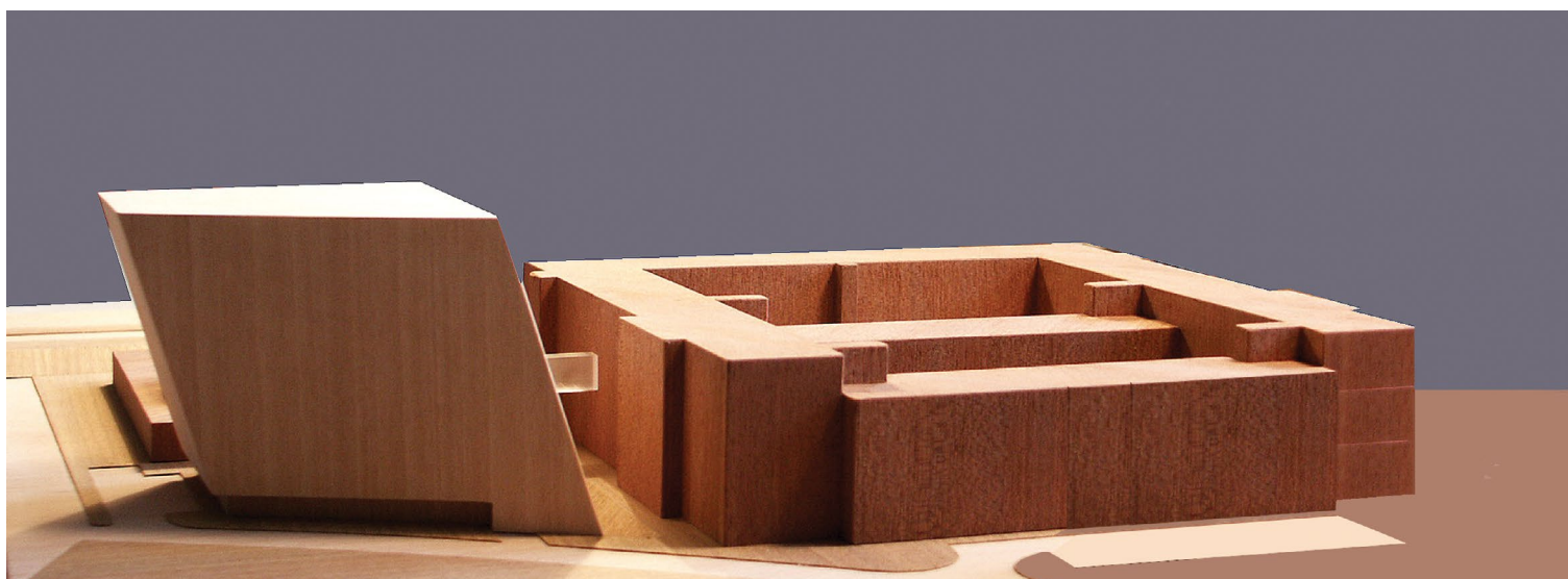
Drvena maketa zgradâ Filozofskoga fakulteta i novoizgrađene fakultetske Knjižnice.