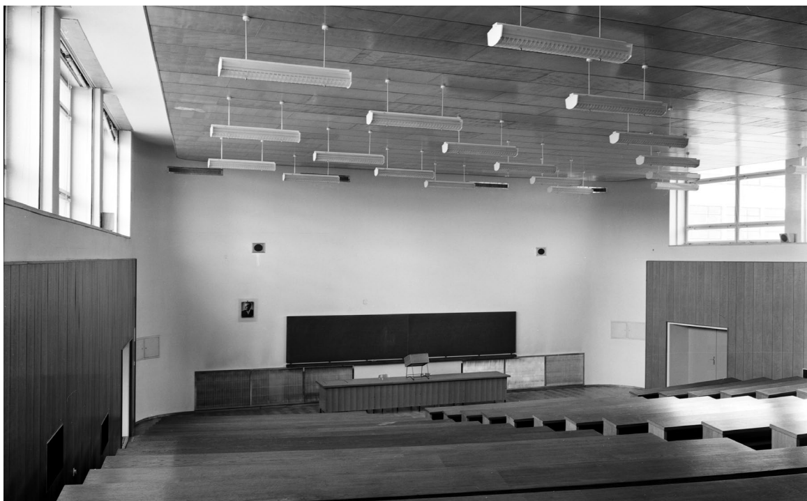
Dvorana D7 u novoj zgradi Filozofskoga fakulteta.