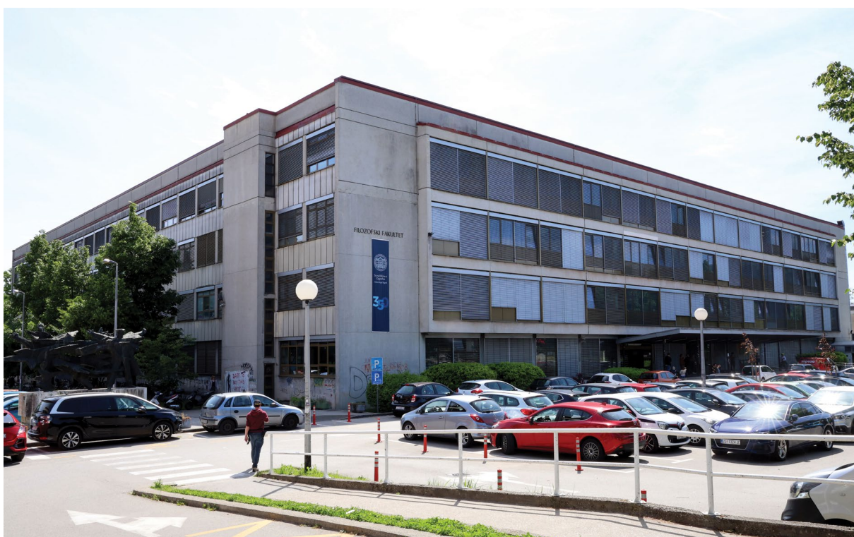
Filozofski fakultet sad.