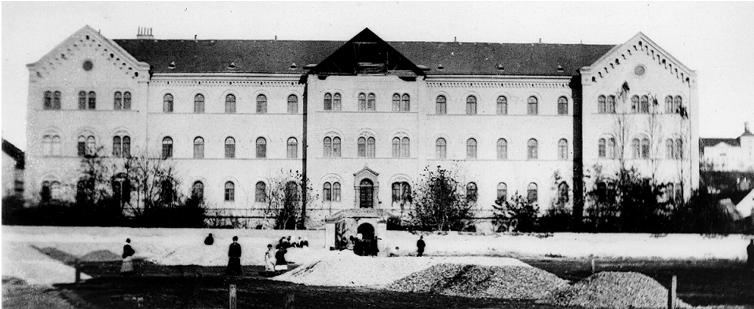
Fotografija zgrade Sveučilišta u vrijeme zagrebačkoga potresa 1880. godine, kad je u njoj bila smještena tvornica duhana. Odlukom Zemaljske vlade i bana Károlya Khuen-Hédervárya godine 1880. odlučeno je da će postati glavna sveučilišna zgrada. Izvor: Arhiv Sveučilišta u Zagrebu, virtualna izložba „Sveučilište – jučer, danas, sutra“ (autorica Tatjana Petrić); Dragan Damjanović, „Organizacija obnove Zagreba nakon potresa 1880. godine“, Prostor , 28/2 (2020), 272. Fotografija: Hermann Fickert.