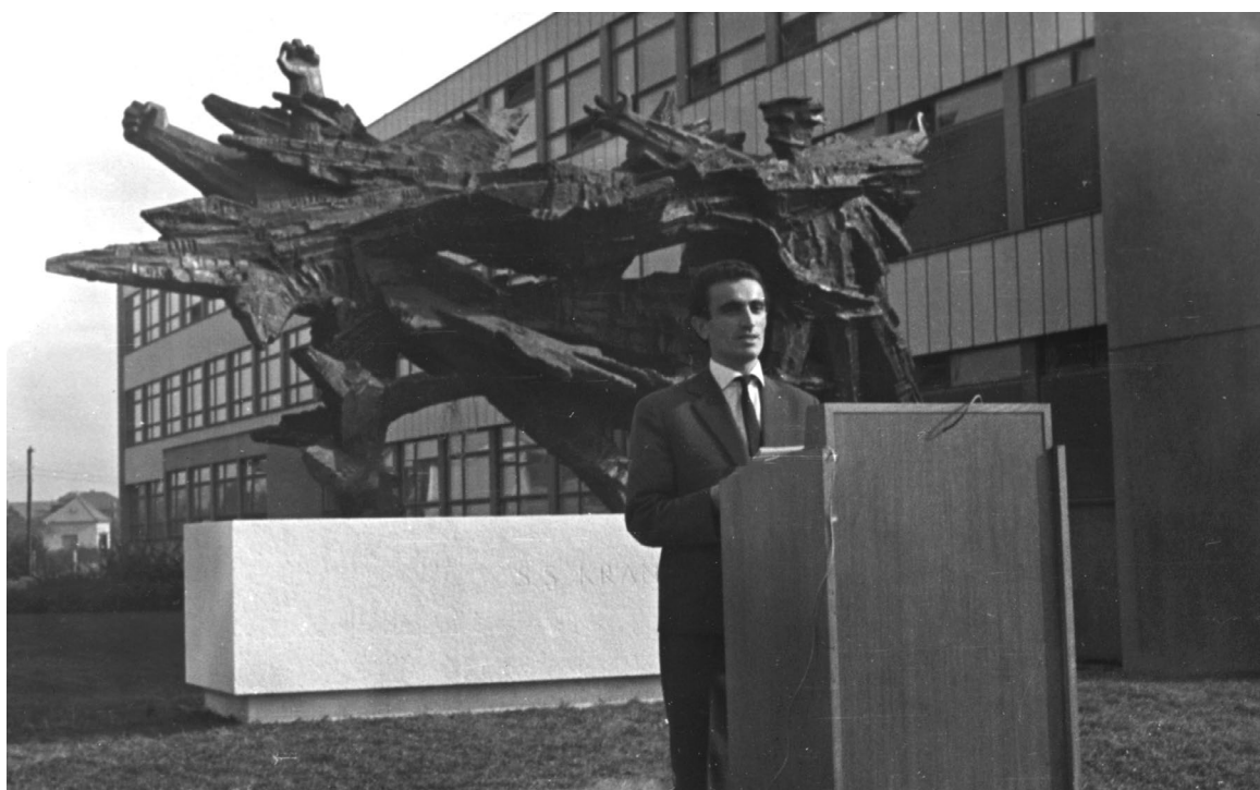
Svečano otkrivanje spomenika Silviju Strahimiru Kranjčeviću uz zgradu Filozofskoga fakulteta, 25. listopada 1962.