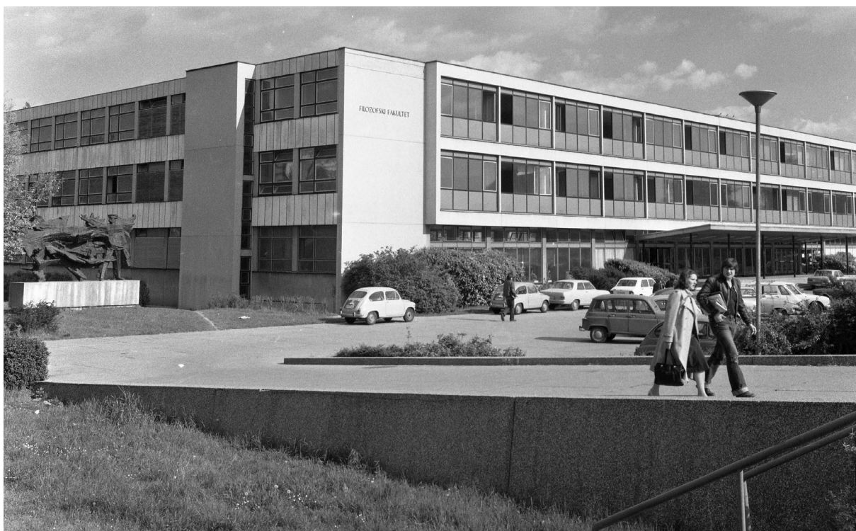
Filozofski fakultet nekad.