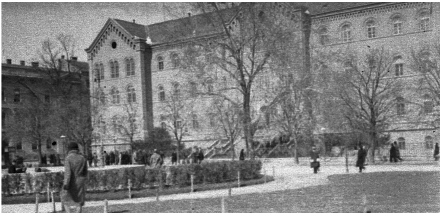
Zgrada Sveučilišta u Zagrebu, pogled iskosa, sredinom 1930-ih godina.