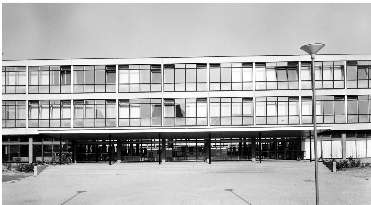
Nova zgrada Filozofskoga fakulteta, 1961.