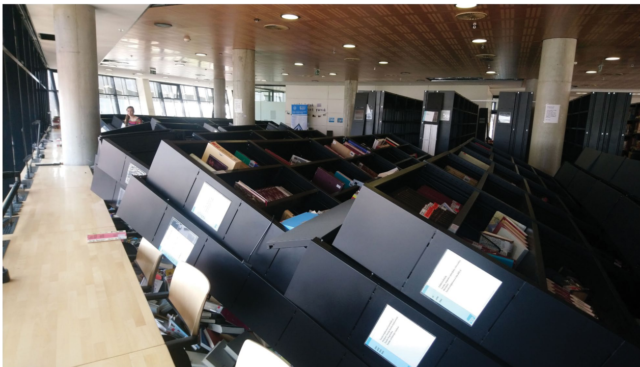
Oštećenja u fakultetskoj Knjižnici nakon potresa 22. ožujka 2020.