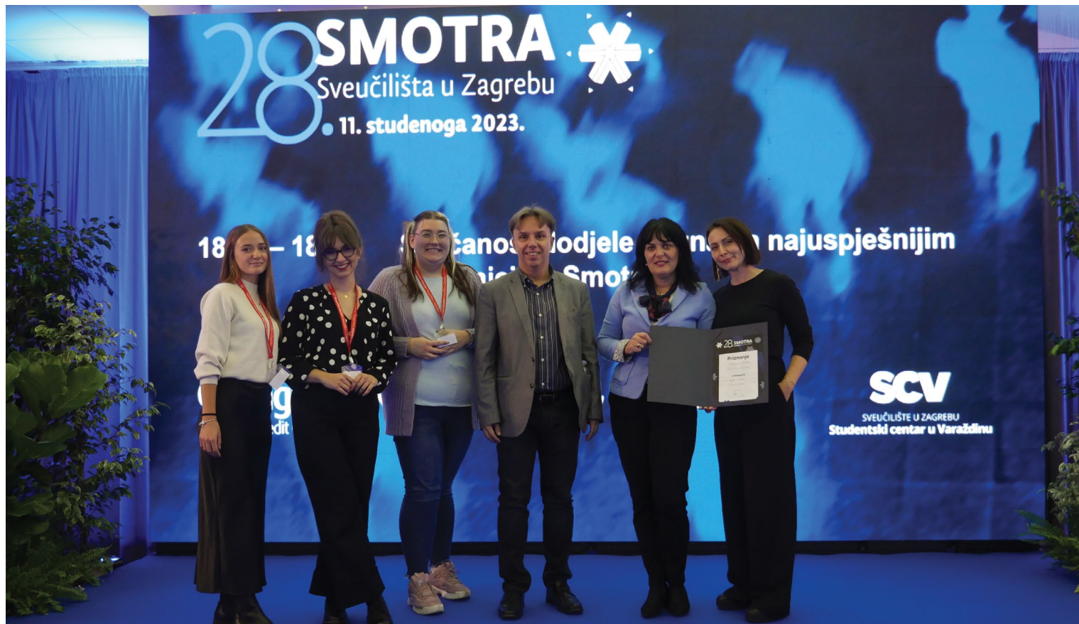
Predstavnici Filozofskoga fakulteta na 28. smotri Sveučilišta u Zagrebu, 2023.