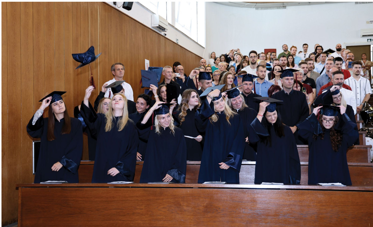
Promocija magistara u dvorani D7, 2024.

Od početka rata u Ukrajini Filozofski je fakultet u suradnji s Ministarstvom znanosti i obrazovanja i Sveučilištem u Zagrebu upisao 15 državljana Ukrajine (u vidu prijelaza ili pak kao redovite studente na cjelokupan studij), koji su se uključili u redovitu nastavu uz veliku podršku svih nastavnika i kolega studenata. Pročelnici, voditelji studija i svi nastavnici iskazali su golemo razumijevanje za prijam studenata i pružili im pomoć u prilagodbi na nov sustav studiranja, koji im je postao svojevrsno utočište. Studenti su upisali tečaj hrvatskoga jezika i kulture u Croaticumu – Centru za hrvatski kao drugi i strani jezik, namijenjen studentima iz Ukrajine koji su pod privremenom zaštitom Republike Hrvatske.