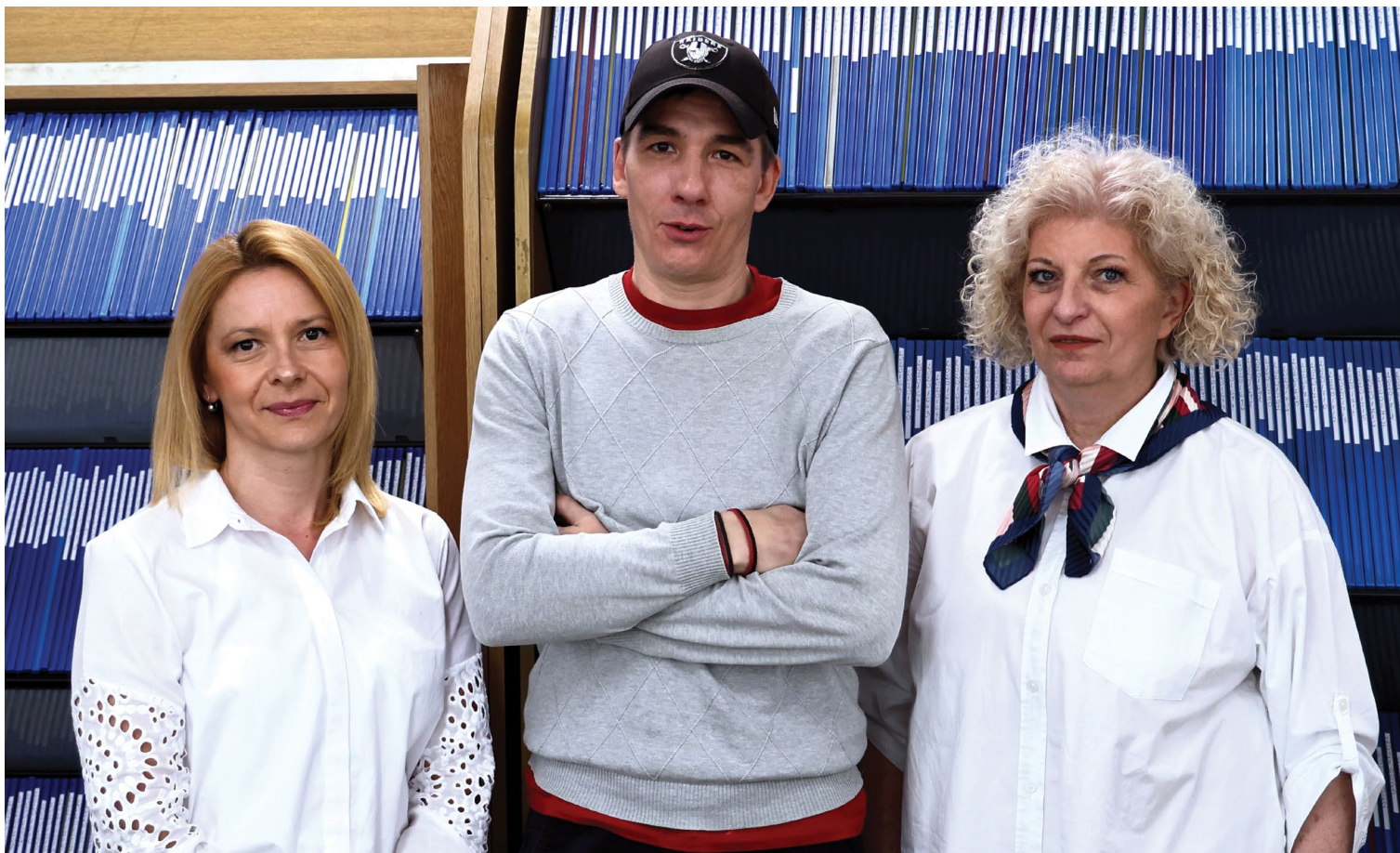
Djelatnici Studentske službe, 2024.

omogućuje da skeniranjem QR-koda s poleđine diplome dobiju potvrdu o njezinoj vjerodostojnosti. Sustav je nastao na temelju inovacije za koju je Hrvoje Stančić, prodekan za organizaciju i razvoj, nagrađen srebrnom medaljom za inovacije na 20. međunarodnoj izložbi inovacija ARCA 2022 održanoj u Zagrebu 2022. godine.