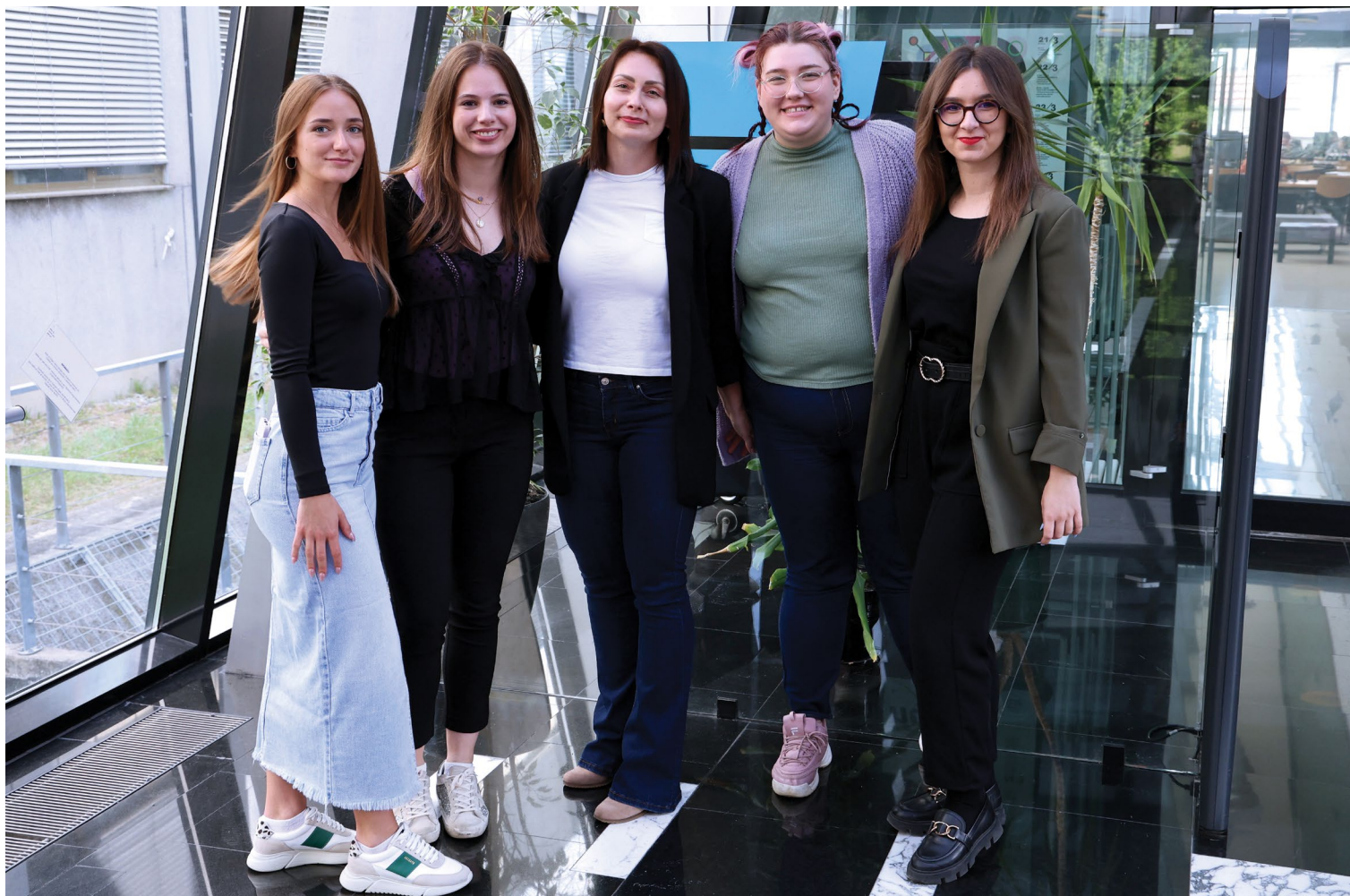
Djelatnice Ureda za informiranje i Informativnoga centra.