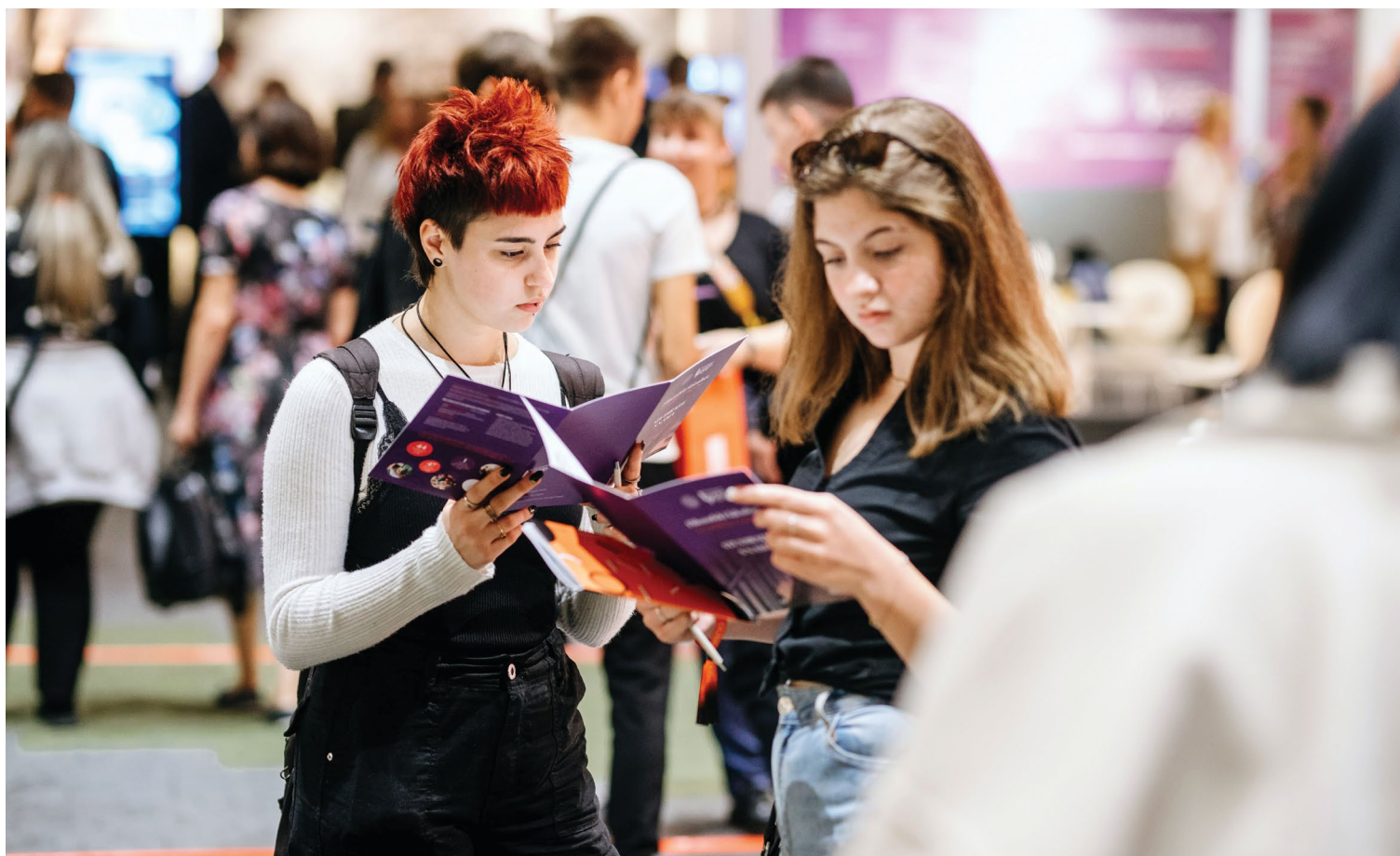
Smotra Sveučilišta u Zagrebu 2023.

uredima, službama, centrima, studentskim udrugama i klubovima te se informirati o studijima koje su upisali, upoznati se sa svojim pravima i obvezama, dobiti savjete o tome kako što uspješnije studirati te se upoznati s mogućnostima koje im se na Fakultetu za vrijeme studiranja pružaju.