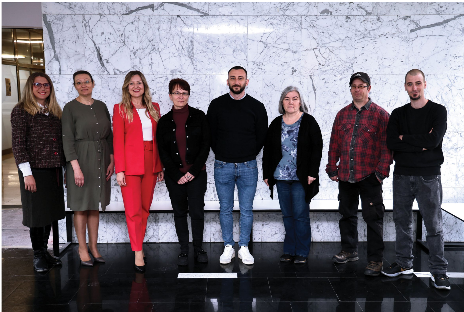
Glavna tajnica Fakulteta, djelatnici Službe za pravne, kadrovske i opće poslove te Službe za javnu nabavu.