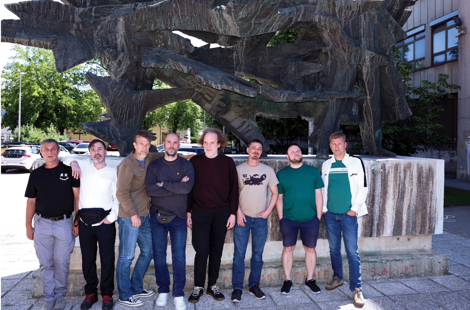
Djelatnici Službe za informatiku.

osuvremeniti mreža i mrežna oprema koja se trenutno koristi. Sve to pridonijet će poboljšanju nastavnoga procesa, znanstvenoistraživačkoga rada i unapređenju mrežne sigurnosti.