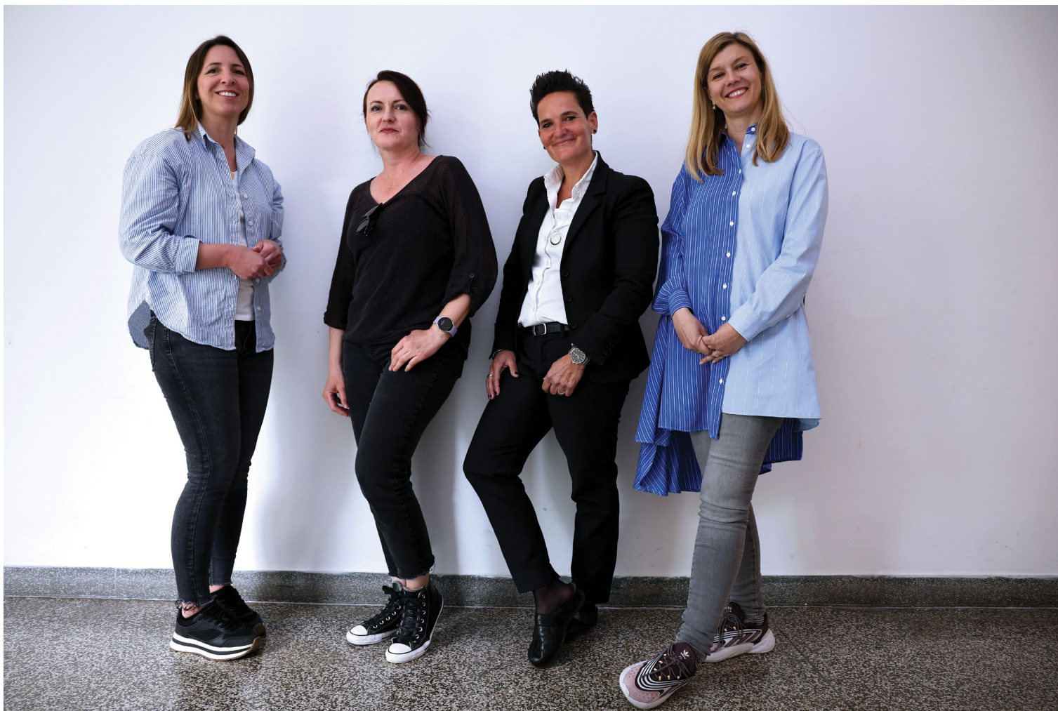
Iz Dekanata – djelatnice Ureda dekana, Ureda za pravne i kadrovske poslove i Tehničke službe.

strana pothodnika postoje liftovi namijenjeni osobama s invaliditetom, tako da su im i ti prostori dostupni bez prepreka.