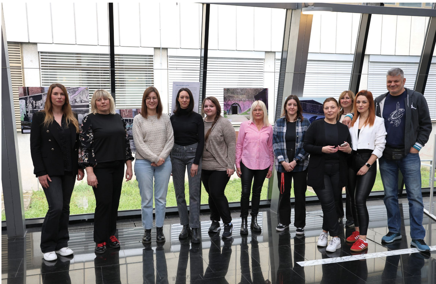
Djelatnici Financijsko-računovodstvene službe.