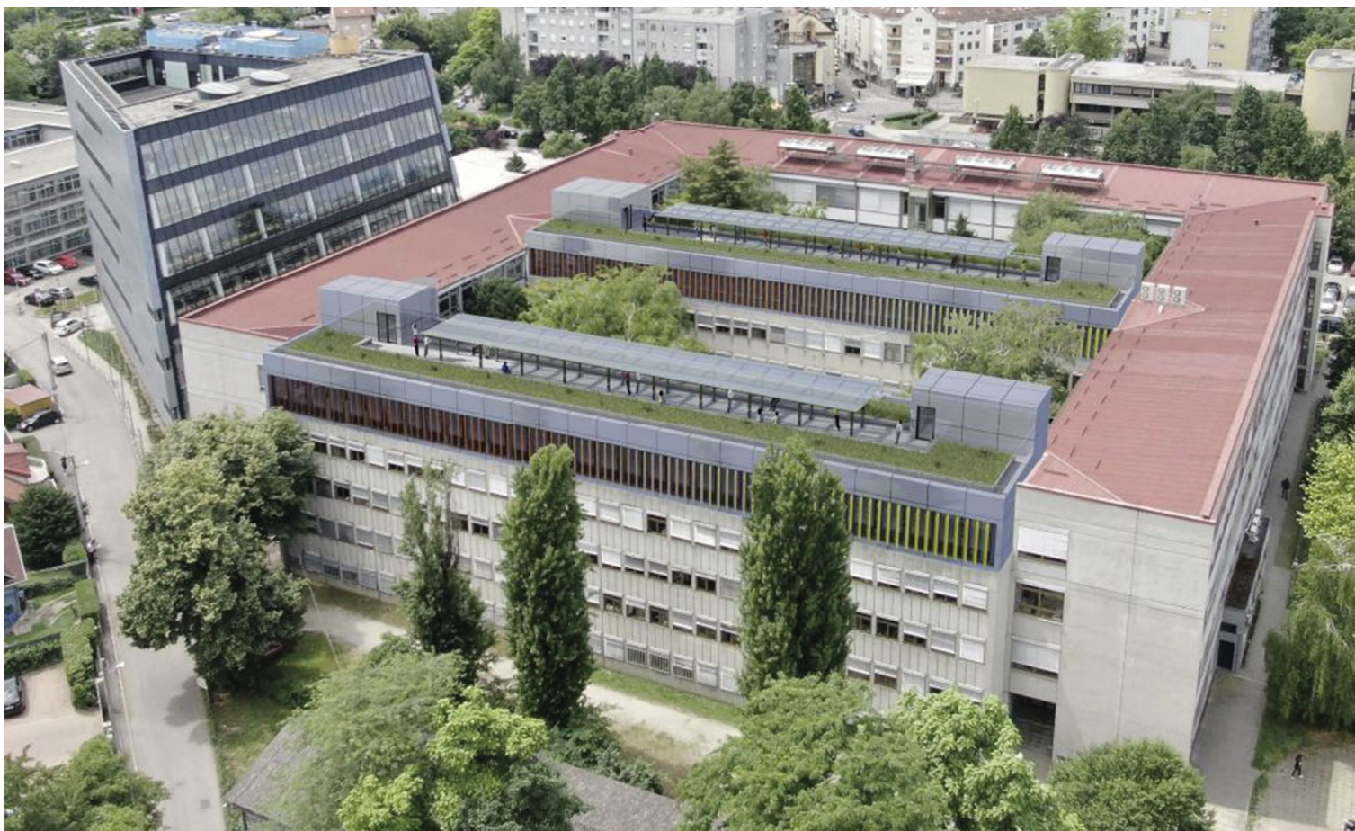
Vizualizacija nadogradnje traktova B i C – pogled na istočno pročelje i trakt C u prvome planu.

Broj djelatnika po službama uočljivo se smanjuje, a primjetan je i trend češće promjene posla pa se dinamika zapošljavanja intenzivirala. Unatoč tomu Fakultet funkcionira dobro, no ipak su jasno vidljive potrebe za dodatnim kadrovima. Uvođenje sustava za digitalno poslovanje omogućit će optimalizaciju poslovanja s postojećim ljudskim kapacitetima, ali i otvoriti potrebe za nekim novim radnim mjestima. Zbog svega toga Fakultet je krenuo u izradu nove sistematizacije radnih mjesta.