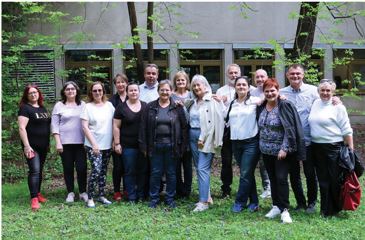
Djelatnici Tehničke službe.

(održavanje i spremačice), bez obzira na godišnje doba, doba dana, godišnje odmore i sl., i pritom ulažu dodatne napore da bi sve optimalno funkcioniralo.