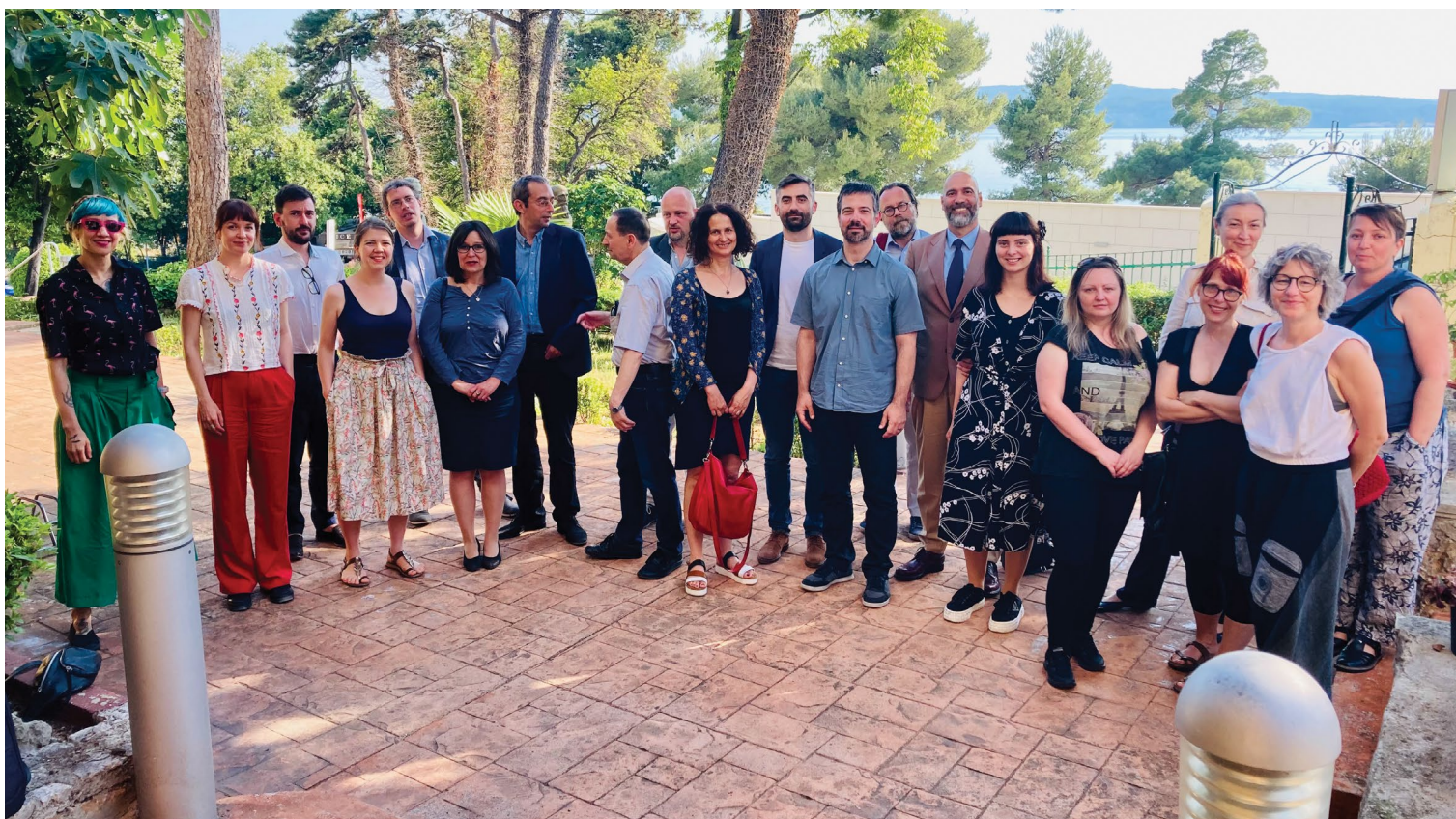
Suradnici Zavoda na konferenciji, Crikvenica, 2022.