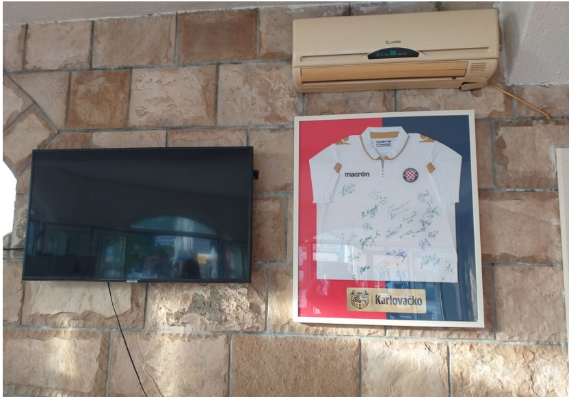
Slika 18: Uokviren dres HNK Hajduka s potpisima igrača, kafić na Pelješcu (ime namjerno izostavljeno), snimila M. Rajković Iveta, srpanj 2021.

no i markeri navijačkog identiteta (zastavice, satovi, šalice, čaše, posteljina, ručnici, deke itd.). Brojni stariji navijači koji žive u Dalmaciji, kao i iseljeništvu, nose prsten s Hajdukovim grbom, a njihova djeca koriste predmete za školu (od bilježnica, olovaka, ruksaka, majica itd.). Također je primjetno da dio navijača ima tetovaže koje pokazuju da su navijači Hajduka i/ili pripadnici Torcide (npr. istetovirano 1950, godina osnutka Torcide). Sve ovo pokazuje da je simbolika Hajduka prisutna u svakodnevnim životima navijača, ali i ljudi povezanih s njima (beba, djece) od rođenja do smrti. Na račun Hajduka smišljaju se i zanimljivi natpisi, poput onog na pogrebnom poduzeću u Pločama: Samo Hajduk živi vječno, svi ostali su moji! (slika 19)