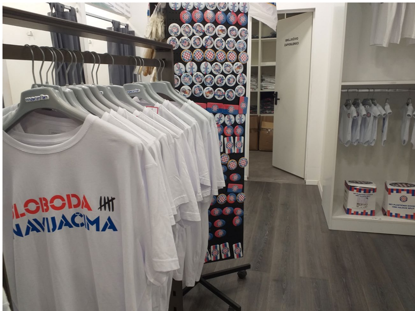
Slika 20: Majice s natpisom Sloboda navijačima. Hajduk fan shop, Poljud, Split. Snimila M. Rajković Iveta, srpanj 2022.

Nakon spomenutog incidenta 2022., uhićenja navijača, navijači i klub su tiskali majice Sloboda navijačima (slika 20), a novac od prodaje se prikupljao za njihovu obranu, što su pojedini kazivači jako hvalili: