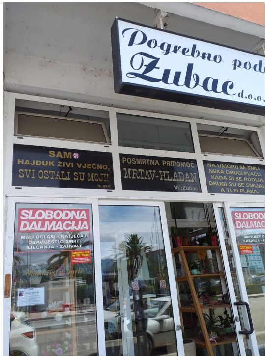
Slika 19: Pogrebno poduzeće, Ploče, srpanj 2020.

no i markeri navijačkog identiteta (zastavice, satovi, šalice, čaše, posteljina, ručnici, deke itd.). Brojni stariji navijači koji žive u Dalmaciji, kao i iseljeništvu, nose prsten s Hajdukovim grbom, a njihova djeca koriste predmete za školu (od bilježnica, olovaka, ruksaka, majica itd.). Također je primjetno da dio navijača ima tetovaže koje pokazuju da su navijači Hajduka i/ili pripadnici Torcide (npr. istetovirano 1950, godina osnutka Torcide). Sve ovo pokazuje da je simbolika Hajduka prisutna u svakodnevnim životima navijača, ali i ljudi povezanih s njima (beba, djece) od rođenja do smrti. Na račun Hajduka smišljaju se i zanimljivi natpisi, poput onog na pogrebnom poduzeću u Pločama: Samo Hajduk živi vječno, svi ostali su moji! (slika 19)