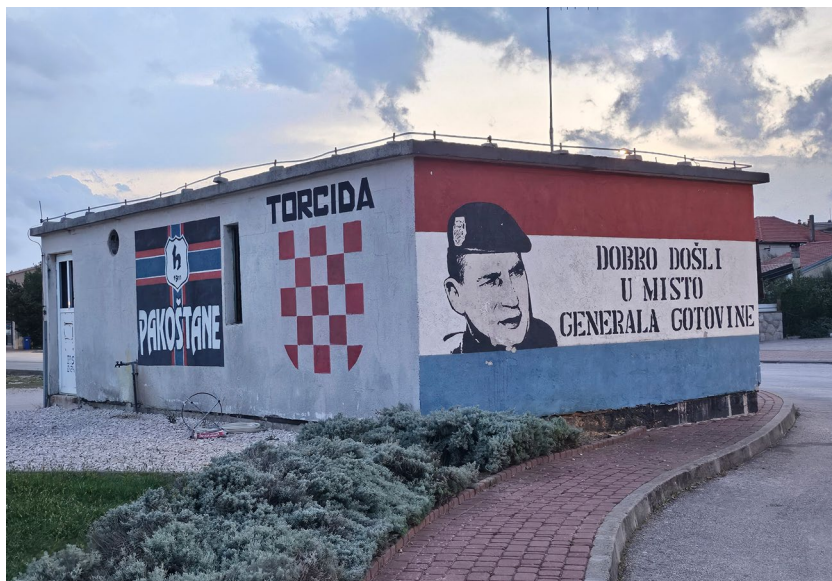
Slika 17: Ulaz u Pakoštane, snimila M. Rajković Iveta, srpanj 2022.

(bez krune, pet povijesnih grbova hrvatskih pokrajina) (slika 17). Većina navijača iz Splita istaknula je grafit THE WORLD'S FINEST – vatra, kotač, Biblija i Hajduk koje su objasnili simbolima najvećih svjetskih izuma, ali i najvažnije stvari za njih. Grafit je napravila Torcida Skalice 2020. koji je i spomen na legendarnu koreografiju s utakmice protiv Evertona 27. 8. 2017. koja je završila rezultatom 1-1. Sve ovo prikazuje jaku isprepletenost navijačkog, nacionalnog, regionalnog i religijskog identiteta, odnosno desna politička uvjerenja. O simboličkom označavanju teritorija navijačkih skupina u Splitu više vidjeti u Nuredinović, 2019.