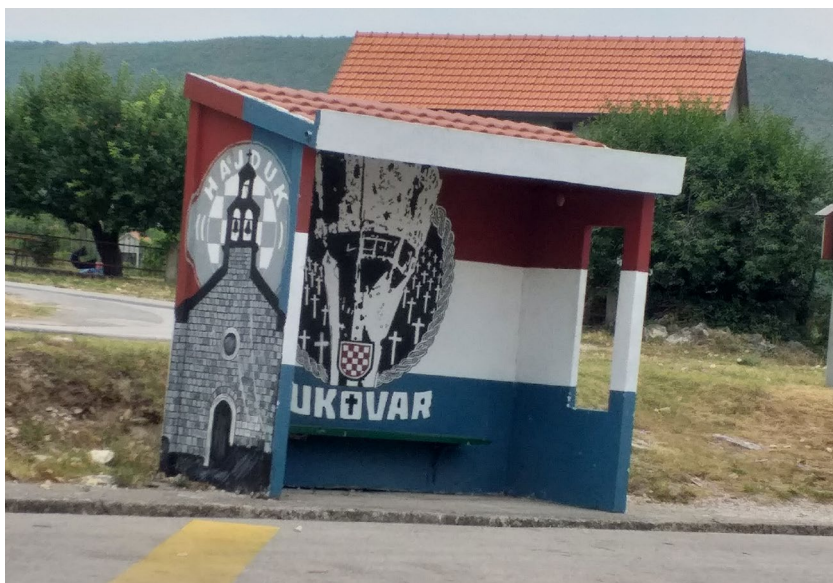
Slika 16: Autobusna stanica na cesti Sinj – Trilj

ustaški pokret). Na ulazu u pojedina dalmatinska mjesta, poput Pakoštana, preko cijelog zida jedne zgrade veliki je mural generala Hrvatske vojske Ante Gotovine, njegova slika je na pozadini zastave crven-bijeli-plavi uz natpis „dobro došli u misto generala Gotovine“, a na drugom zidu natpis Torcida i ispod njega hrvatski grb