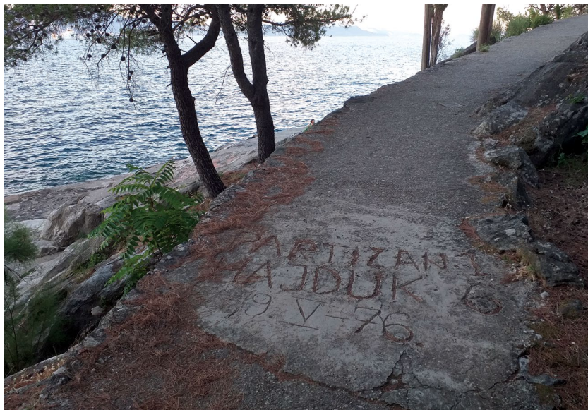
Slika 15: Pobjeda Hajduka nad Partizanom 6:1, 9. 5. 1976. Šetnica Put mora, Trpanj, Pelješac.