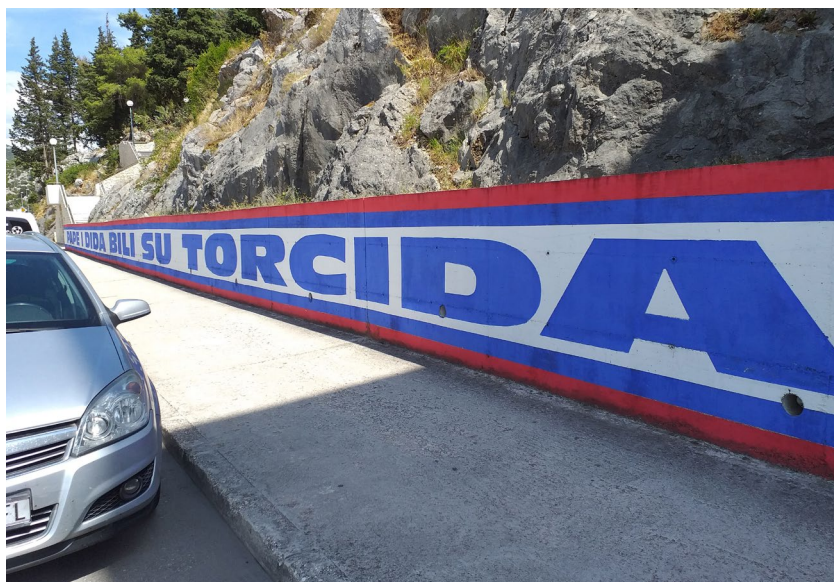
Slika 14b: Pape i dida bili su Torcida, Ploče. Snimila M. Rajković Iveta, srpanj 2020.

(slika 14b), Godine prolaze ljubav ostaje, Da života iman dva ja bi oba tebi da ili uz šetnice kraj mora upisane slavne Hajdukove pobjede, Partizan-Hajduk 1 : 6 (slika 15). Uz markere identiteta Hajduka i Torcide često su marker nacionalnog identiteta (hrvatski grb), križ (kao oznaka religijskog identiteta), nacrtan vukovarski vodotoranj (slika 16), ponekad i hrvatska šahovnica u velikom slovu U (koje označava