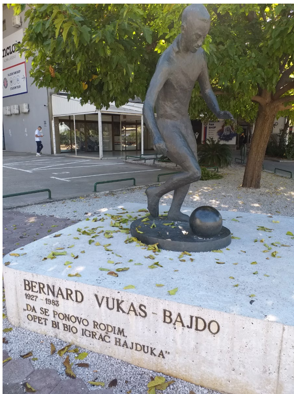
Slika 21: Spomenik Bernardu Vukas, Split 2022., snimila M. Rajković Iveta.

U kazivanjima navijača, ne nužno vezanima uz Hajduk, povremeno bi se javljala kazivanja o netrpeljivosti i prema „Vlajima“ (stanovnicima Dalmatinske zagore, op. a.) bez obzira na njihovu etničku i religijsku pripadnost (oni su danas većinom isto Hrvati i katolici). Kao primjer navijači su spominjali jedan stariji, ali još i danas nezaboravljeni transfer, koji potvrđuje i literatura. To je transfer Vladimira Beara iz Hajduka u beogradsku Crvenu zvezdu. Vladimir Beara (1928. Zelovo kod Sinja – Split 2014.) bio je najbolji hrvatski i jugoslavenski vratar i jedan od najboljih vratara na svijetu. Za Hajduk je