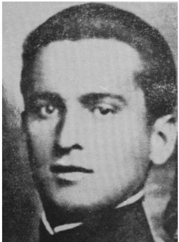
Sl. 6. Vasilj Gaćeša i Josip Marjanović Joso, pučani i narodni heroji. Lijevo: Vasilj Gaćeša (Vlahović, Glina, 1. studenoga 1906. – Brubno, Glina, 29. travnja 1942.), narodni heroj Jugoslavije od 6. prosinca 1944. godine (Gradski muzej u Sisku, II-1002: Vasilj Gaćeša 1927. i 1928. u Beogradu, u artiljerijskom puku Kraljeve garde - reprodukcija). Desno: Josip Marjanović Joso (Velika Solna, Glina, 30. travnja 1905. – šuma Prolom kod Obljaja, Glina, 10. listopada 1941.), narodni heroj Jugoslavije od 20. listopada 1951. godine (Narodni heroji Jugoslavije, Beograd – Titograd 1982., 495)