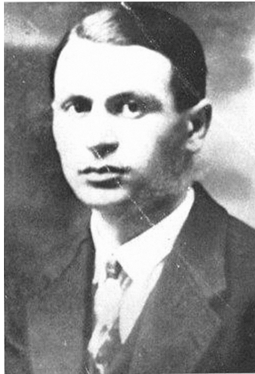
Sl. 5. Ivo Marinković Slavko (Sutivan na Braču, 13. prosinca 1905. – Zagreb, 21. travnja 1943.), narodni heroj Jugoslavije od 26. srpnja 1945. godine. Diplomirani student Filozofskog fakulteta Sveučilišta u Zagrebu, gimnazijski profesor u Senju, Požarevcu, Valjevu i Koprivnici, dugogodišnji je predatni član Komunističke partije Jugoslavije, od 1935. do 1938. godine na robiji u Lepoglavi, Mariboru i Srijemskoj Mitrovici, bio je od 1939. do 1942. godine sekretar Okružnog komiteta KPH Karlovac. Kotarski komitet KPH Glina bio je u sastavu karlovačke partijske organizacije sve do stvaranja Okružnog komiteta KPH Banije 4. prosinca 1941. godine, a Ivo Marinković je s Josipom Krašem (Vuglovec kraj Ivanca, 26. ožujka 1900. – Karlovac, 18. listopada 1941.), također narodnim herojem od 26. srpnja 1945. godine, bio ključna osoba u realizaciji politike CK KPH i CK KPJ na području Karlovca, Korduna i glinskog dijela Banije. ( Dokumenti Druge konferencije KPH za okrug Karlovac 1942. godine (pr. Đuro Zatezalo), Karlovac 1972.)

Umjesto zaključka nužno je vratiti se na početne premissa da bi se ovaj prilog moglo shvatiti kao okvir za istraživanje koje će mikrohistorijskim pristupom u granicama neizbježnih makrohistorijskih perspektiva omogućiti rekonstrukciju onih ljudskih vrijednosti u glinskom puku koje su njegove imaginarije izvele iz tradicijskih okvira i usmjerile oslobođene ljudske i zajedničke energije prema ciljevima jezivo visokih ljudskih cijena u ratu za koji se vjerovalo da neće biti tek puki rat za „goli život“.