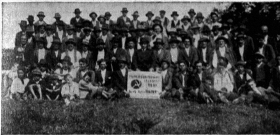
Sl. 8. Osnivačka skupština ogranka Seljačkog kola u Obljaju, srez glinski (Kalendar Seljačko kolo, Zagreb 1939., 79)