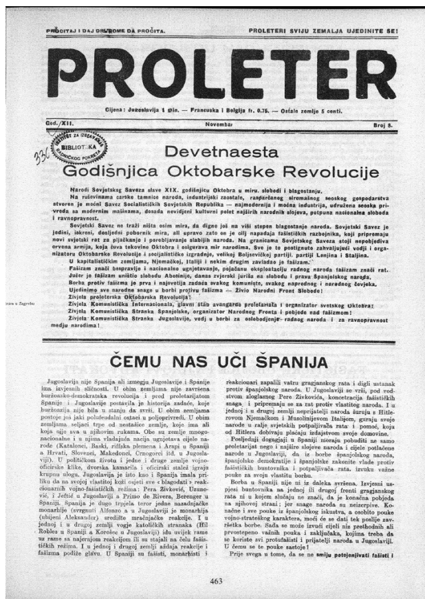
Sl. 2. „Čemu nas uči Španija“, Proleter , god. VII, broj. 8, novembar 1936. (naslovnica)

U Kraljevini Jugoslaviji već nakon ubojstva kralja Aleksandra I. 1934. ništa više nije moglo biti isto, a potpuno je neizvjesno bilo što bi se sve moglo promijeniti. 18 Kviziparlamentarizam u uvjetima dikature bio je posvuda delegitimiran, skupštinski izbori 1935. i 1938. pokazali su u obama slučajevima da se čak ni u takvim uvjetima ne može osigurati izborni legitimitet vlasti, ali i da je moć regentskog Dvora sve više reducirana, međunarodno dezorijentirana i de facto sve ovisnija o manje ili više koordiniranim kapricima fašističke Italije i nacističke Njemačke. Sporazum Cvetković–Maček, koliko god postignut prekasno, uoči samog početka Drugoga svjetskog rata, bio je previše nedorečen, poticao je proturječne aspiracije s različitim nacionalnim atribucijama i, definitivno, nije stvorio toliko priželjkivani potencijal za međunarodnu neutralizaciju Kraljevine Jugoslavije. 19 Kritične mase onih koji u bliskoj budućno-