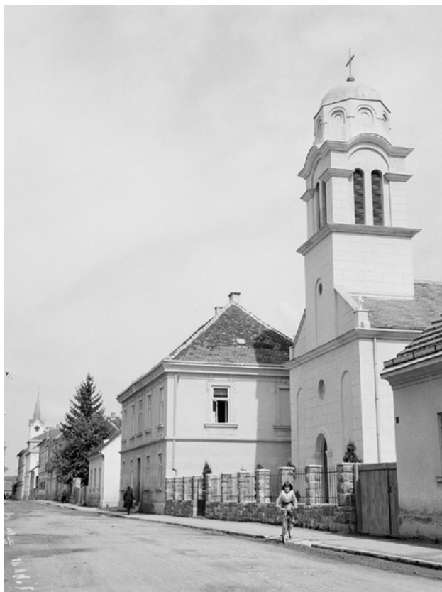
Sl. 2. Ambijentalni snimak nove pravoslavne crkve u Glini. U pozadini je rimokatolička crkva Sv. Ivana Nepomuka, koja je srušena 1991. godine.

rohijskog doma u Kosinji i Ličkoj Jasenici, opravku crkve u Slunju i lokaciju i građevinsku dozvolu i za gradnju crkve u Glini. Sa episkopom Simeonom Zlokovićem nastao je spor oko izgradnje crkve u Donjem Budačkom. Naime, NOO Krnjak je izvršio eksproprijaciju crkvišta sa ostacima zidina u ratu porušene pravoslavne crkve u Krnjaku i na tom mestu sagradio školu. Sa ovom odlukom bile su upoznate i saglasne i republička i Savezna komisija za verske poslove. Episkopu Simeonu je isplaćen odgovarajući iznos nadoknade posle čega je on zatražio lokaciju kako bi započeo sa izgradnjom crkve u D. Budačkom. U međuvremenu među meštanima je počela akcija prikupljanja potpisa protiv gradnje crkve. U Budačkom je pre toga samo šest kuća odbijalo svećenje vodicom, a kada se povelu akcija oko gradnje crkve, svi su odjednom bili protiv toga. Aktivnosti su vodili penzionisani oficiri. 22 Episkop se žalio i na kraju je Narodni odbor kotara Karlovac odredio lokaciju i izdao građevinsku dozvolu.