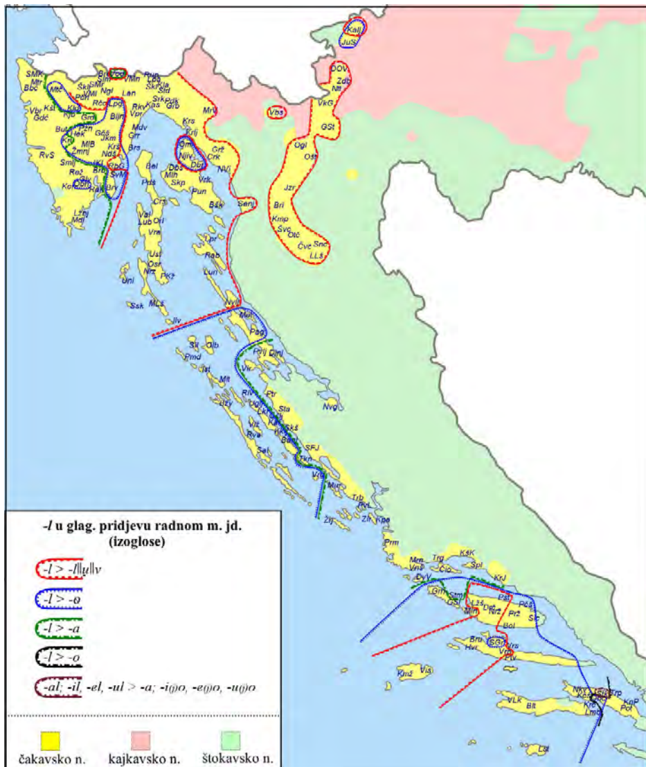
Karta 2. -l u glagolskom pridjevu radnom m. r. jd. (izoglosna karta)