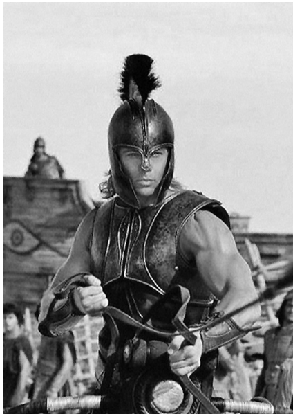
Брэд Питт в фильме Троя

Ахиллес был величайшим ахейским героем Троянской войны. Среди всех ахейцев ему не было равных по силе и смелости, доброте, а также по мужественной красоте. Возможно, вы смотрели Трою , эпический военный фильм 2004 года режиссера Вольфганга Петерсена. Это один из самых дорогих голливудских проектов всех времен с Брэдом Питтом в главной роли. Если не видели, мы настоятельно советуем вам это сделать.