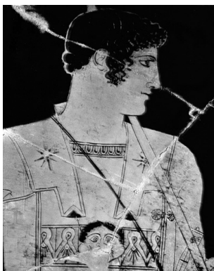
изображение Ахиллеса на аттической амфоре, V век до н.э.

В истории искусства известны многочисленные изображения этого величайшего героя греческой литературы. Мы находим информацию о том, что сохранилось около четырехсот изображений Ахиллеса на вазах. Одно из самых известных – изображение на аттической амфоре, датируемой примерно 450 годом до н. э., которая хранится в музее Ватикана.