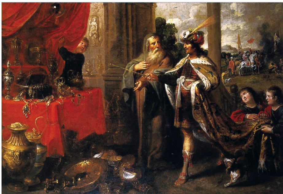
Франс Франкен Второй: Крѣз показывает Солону свое сокровище

Следующие примеры из современного русского языка иллюстрируют, как использовать сравнительный фразеологизм богат, как Крѣз :