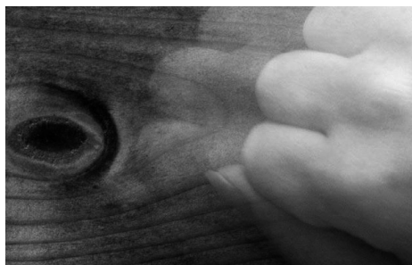
стук по дереву

С незапамятных времен мудрецы и различные эксперты пытались определить понятие счастья в том виде, в каком оно воспринимается отдельными людьми, группами людей, обществами и религиозными сообществами. Согласитесь, что, возможно, лучше всего объяснил его суть древнегреческий философ и ученый Аристотель в одном из своих определений, сказав: «Счастье зависит от нас самих». Психологи утверждают, что счастье — это понятие, смысл которого сильно отличается в представлении разных людей. Оно даже меняется у одного и того же человека в разные периоды его жизни. Тем самым мы могли бы приравнять его к понятию красоты, которую каждый видит по-своему.