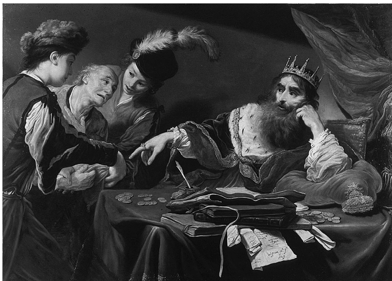
К. Виньон: Крѣз получает дань от лидийских крестьян

Из художественных изображений лидийца Крѣза мы бы выделили картину Крѣз получает дань от лидийских крестьян французского художника в стиле барокко Клода Виньона, написанную в 1629 г., и картину фламандского живописца Франса Франкена Второго Крѣз показывает Солону свое сокровище XVII в.