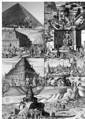
семь чудес Древнего мира*