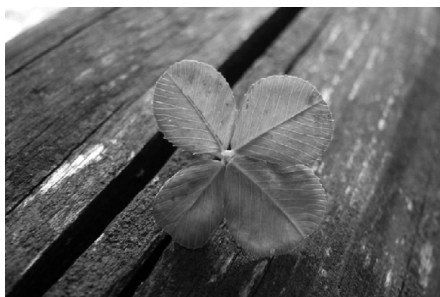
четырехлиственный клевер как символ удачи

Что для вас счастье? Вы счастливы, когда проводите время со своей семьей, друзьями, домашними животными или когда вы делаете что-то для себя? Например, когда посещаете долгожданный курс цифровой фотографии или регулярно проводите еженедельные тренировки, или вы счастливы, когда балуете себя, например, новой моделью кроссовок, которую вам удалось купить на распродаже со скидкой?