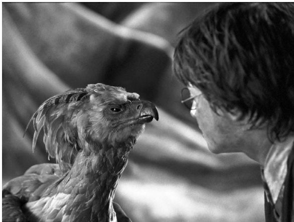
кадр из фильма Гарри Поттер и Орден Феникса

Давайте вернемся к Гарри Поттеру и скажем, что это не единственный пример использования мотивов феникса в литературе. Из наиболее известных произведений мировой литературы, в которых фигурирует это чудесное мифологическое существо, следует обязательно упомянуть Бурю и Тимона Афинского Шекспира, а одну из наиболее интересных трактовок мотивов феникса мы находим в поэзии Сильвии Плат, американской писательницы XX в. В одном из ее самых известных стихотворений Леди Лазарь героиня стихотворения после серии неудачных попыток самоубийства возрождается из пепла.