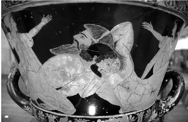
Евфроний: Борьба Геракла с Антеем , около 510 г. до н. э.