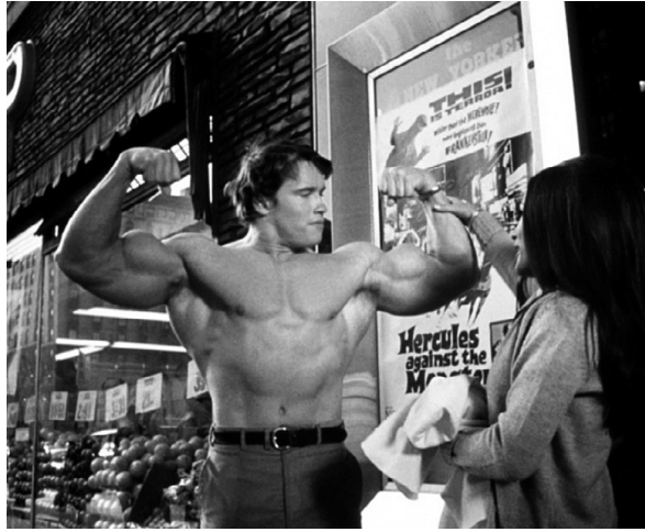
Арнольд Шварценеггер в фильме Геркулес в Нью-Йорке

Возможно, что сильный герой из мира киноискусства кому-то более известен как легендарный герой одноименного комикса Marvel или как персонаж популярной серии компьютерных игр God of War .