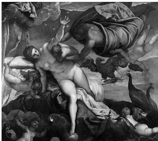
Я. Тинторетто: Происхождение Млечного Пути

Знаете ли вы, что знаменитый сыщик Эркюль Пуаро, созданный британской писательницей Агатой Кристи, получил свое имя именно в честь этого мифического героя? В 1947 году она даже написала книгу Подвиги