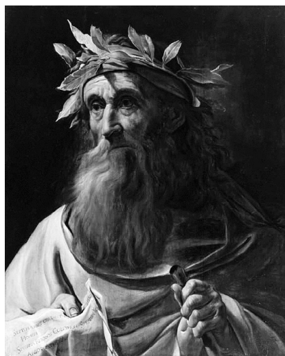
неизвестный художник: Гомер

К тому же, героические эпосы отличаются возвышенным стилем, изображениями разгневанных богов и подвигами могучих героев. Поэтому мы можем справедливо спросить, есть ли в них место для смеха? Илиада и Одиссея — это гораздо больше, чем просто подробное описание сражений. Эти эпосы изображают общечеловеческие переживания любви,