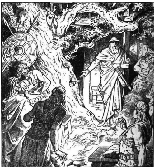
Й. Гергс: Меч Зигмунда