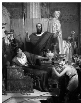
Р. Вестолл: Дамоклов меч