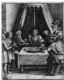
В. Холлар: Дамоклов меч источник: https://commons.wikimedia.org/wiki/File:Wenceslas_Hollar_-_The_sword_of_Damocles.jpg

В политическом контексте дамоклов меч упоминается в речи, в которой популярный американский президент Джона Ф. Кеннеди говорит о постоянной угрозе ядерного оружия, сравнивая его с мечом, висящим над головой современного человека. Поклонники мюзикла Rocky Horror Show и его более известной, но и спорной экранизации под названием Шоу ужасов Рокки Хоррора узнают легенду, берущую свое начало в глубокой древности, в песне Дамоклов меч , исполненной главным героем Рокки и подчеркивающей, как он осознал иллюзию славы и материального богатства.