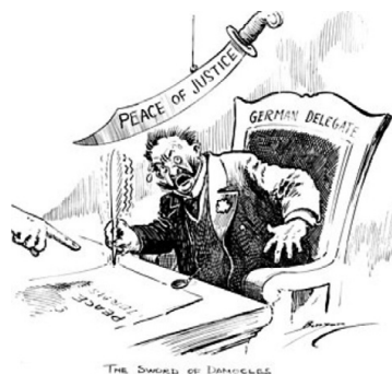
политическая карикатура К. Берриман: Дамоклов меч

Часто для названия и объяснения различных психологических переживаний используются персонажи из истории или мифологии, и одной из таких фигур является Дамокл. Это предание используется и для того, чтобы объяснить, как человек, преодолевший очень опасную и серьезную болезнь, может бояться ее повторного появления. Так, о дамокловом синдроме говорят, когда у человека возникает неоправданный и чрезмерный страх возвращения болезни, чаще всего у больных, преодолевших одно из злокачественных заболеваний.