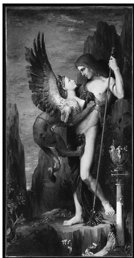
Гюстав Моро: Едип и Сфинкс