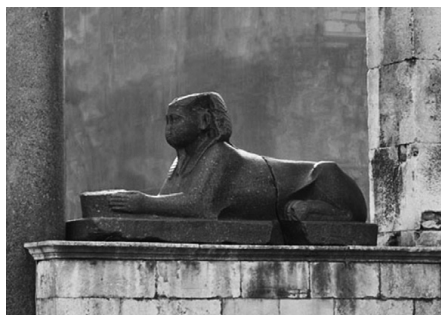
сфинкс в Сплите, Хорватия