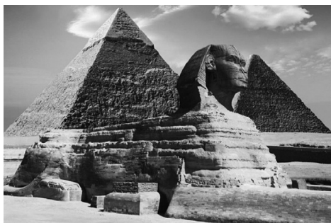
сфинкс в Гизе, Египет