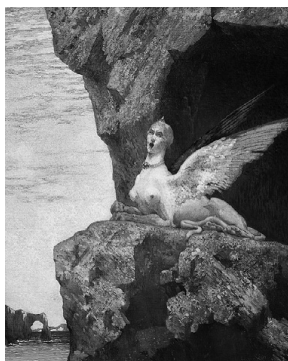
Александр Сеон: Отчаяние Сфинкса