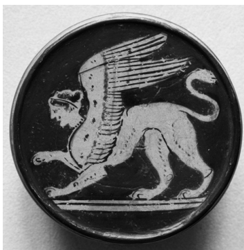
Сфинкс на греческой шкатулке V в. до н. э.

Вы, наверное, заметили, что мы можем писать сфинкс или Сфинкс – с прописной или строчной начальной буквы. Правильно писать с прописной буквы, если это имя чудовища из греческой мифологии, останавливавшего путников при въезде в Фивы, который задавал им неразрешимые загадки, и с маленькой буквы, если речь идет о мифологическом существе с телом льва и головой человека или животного. Поэтому в нашем случае правильно написать загадка Сфинкса .