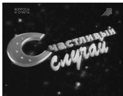
Счастливый случай , логотип любимой телепередачи

Составление хороших вопросов для викторины – это настоящее искусство. Поэтому работа авторов вопросов требует большого мастерства и ответственности, в то время как сами участники викторин, даже самые успешные, не всегда обладают навыками для их создания.