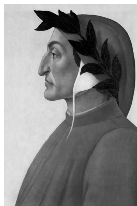
Данте Алигьери

Помните также изображение бога Аполлона в нашем пособии. Правильно, у него тоже лавровый венок на голове. Приписываются ли Аполлону какие-то титулы? И почему именно лавр был выбран в качестве растения, которым увенчивали великих людей? Греческая мифология даст нам ответы на эти вопросы.