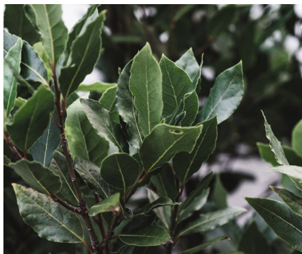
лавр (лат. Laurus nobilis )

Лавр (лавр благородный) (лат. Laurus nobilis ) — древесное многолетнее вечнозеленое растение, широко распространенное в Средиземноморье. Родом со скалистых склонов Греции, он растет в виде куста и может достигать высоты от 10 до 15 м. Ему поклонялись как греки, так и римляне, и он использовался в качестве украшения, хотя лавр также имеет множество целебных свойств в качестве лекарства от многих болезней (например, лавровый лист и плоды используются в качестве лекарства и приправы, а лавровое масло в лечебных целях). Он эффективен в борьбе с кашлем, головной болью, проблемами с волосами и кожей, способствует укреплению иммунитета. Если вы решите приготовить чай или масло из лавровых листьев, будьте осторожны, поскольку лавровый лист может быть ядовитым. Вот почему мы советуем вам ни в коем случае не заниматься этим без присмотра и помощи фитотерапевта и/или других специалистов. А вот если вы собираетесь оттачивать свои кулинарные навыки и использовать лавр в качестве приправы, смело вперед! Лавр – популярное дополнение к мясным блюдам, а также к таким блюдам, как соусы, запеканки и рагу.