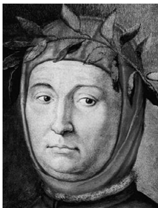
Франческо Петрарка