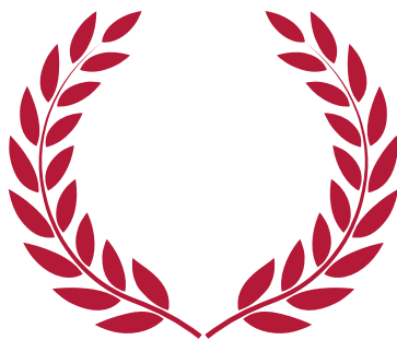
лавровый венок, символ