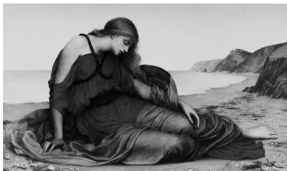
Э. де Морган: Ариадна на Наксосе

источник: https://hr.wikipedia.org/wiki/Tizian