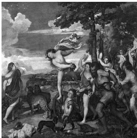
Тициан: Вакх и Ариадна