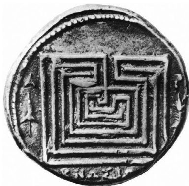
монета из Кноса