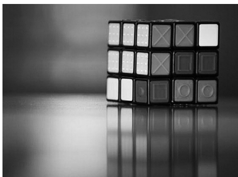
кубик Рубика, или кубик-рубик

Одним поступком – подписью, произнесением судьбоносного слова или нажатием кнопки – мы изменяем свою личную историю. Каждый месяц в течение следующих десятилетий мы соглашаемся возвращать долг банку, связываем свою жизнь с другим человеком, поступаем в желаемый университет... Эти действия символизируют новый период, начинающийся с принятия важного решения. Поэтому неудивительно, что мы долго размышляем, прежде чем решимся изменить привычный ход своей жизни. Иногда мы оказываемся в ситуации, когда даже тщательное взвешивание всех «за» и «против» не может помочь. Тогда нам может прийти на помощь простой жест – подбрасывание монеты или кубика. Достаточно найти обычную монету или игральный кубик, определить, какая сторона представляет какой выбор, бросить их и действовать в соответствии с полученным результатом. Но может ли любой кубик подойти для этой цели?