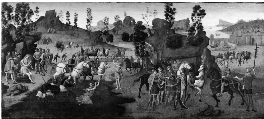
Ф. Граначчи: Переход Цезаря через Рубикон