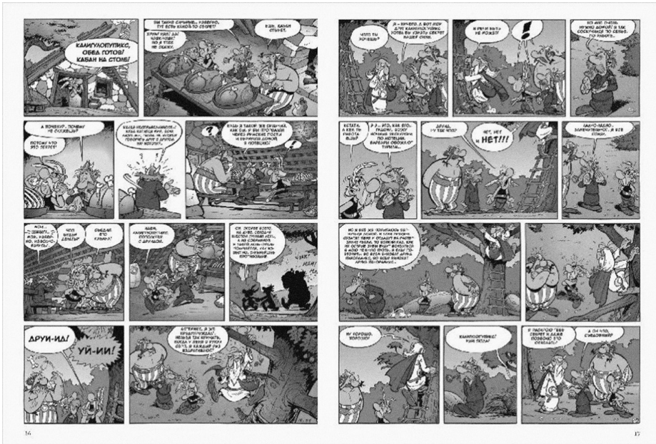
Астерикс и Обеликс