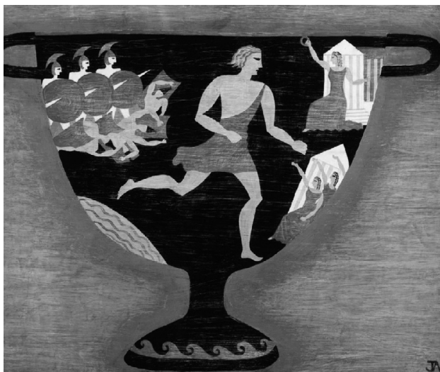
Дж. Армстронг: Фидиппид