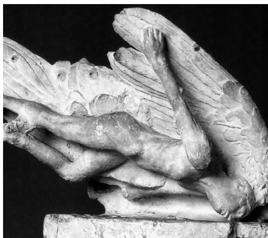
О. Роден: Падение Икара