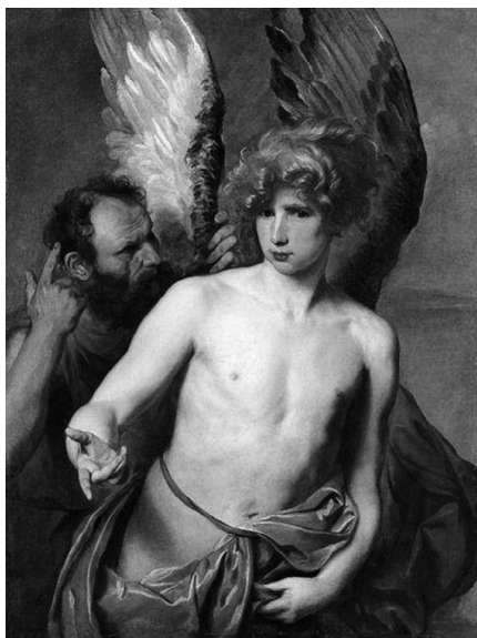
А. Ван Дейк: Дедал и Икар