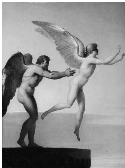
Ш.П. Ландон: Дедал и Икар