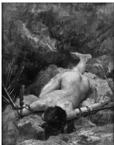
В. Буковац: Икар на скале