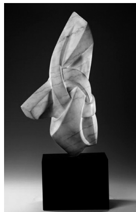
Т. Тевли: Гордиев узел

источник: https://www.mutiralart.com/Artwork/ALEXANDER-CUTTING-THE-GORDIAN-KNOT/0BB073FFD9278665