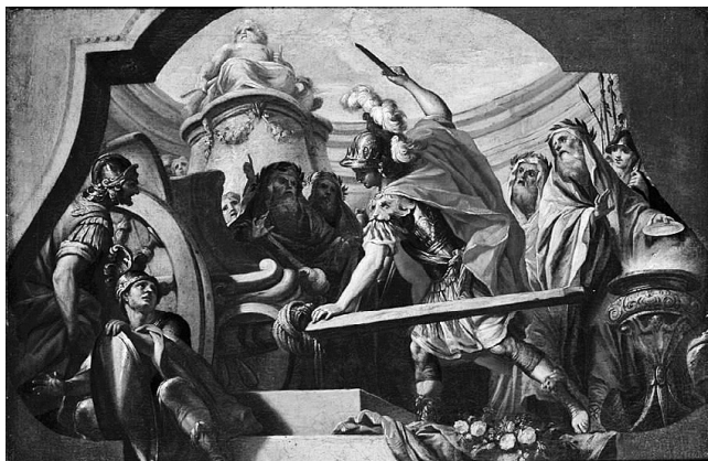
Ф. Фишетти: Александр разрубает гордиев узел

Эта история также появляется как мотив в литературе. Одним из самых ранних упоминаний является, например, пьеса Уильяма Шекспира Генрих V , в которой главный герой хвастается тем, что ему удалось разрубить гордиев узел политики.