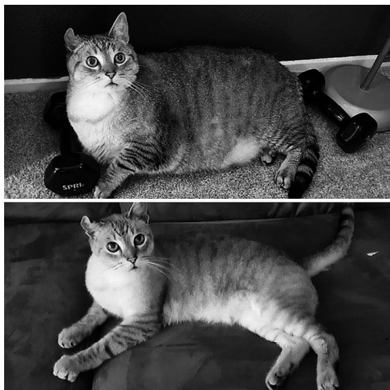
до и после похудения

Сидячий образ жизни, недостаточная физическая активность и несбалансированное питание считаются наиболее распространенными причинами ожирения, одной из самых серьезных проблем современности. Порой избавление от лишних килограммов может стать настоящей пыткой. В основном потому, что на интернет-сайтах и рекламных плакатах часто демонстрируются недостижимые идеалы мужской и женской красоты, а также часто публикуются нереальные фотографии результатов похудения за короткий период времени.