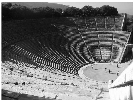
театр в Эпидавре, крупнейший греческий театр, IV в. до н. э.