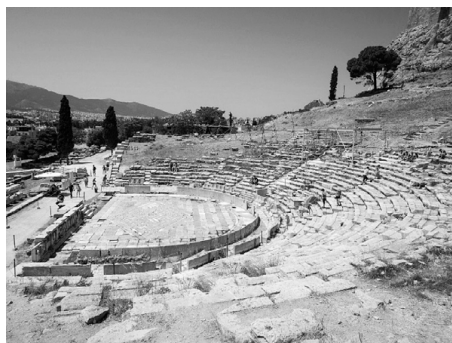
Театр Диониса на склонах Акрополя, старейший греческий театр, VI в. до н. э.