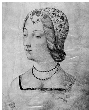
неизвестный художник: Лаура