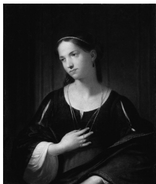
У. Олстон: Беатриче

Вы когда-нибудь оказались в ситуации, когда вам нужно написать сочинение или эссе, а вдохновения нет? Не только с вами такое произошло! Многие великие творцы оказывались в такой же ситуации. В античные времена писатели искали источник вдохновения, обращаясь к божественным музам в начале своего творчества. Музы считались покровительницами искусства, и авторы звали к ним за милостью, защитой и наставлением на пути создания произведений. А начиная с эпохи Возрождения музами стали называть реальных людей, чаще всего любимых женщин. Такие характеристики этих женщин, как доброта, красота, утонченность или чувствительность побуждали авторов создавать произведения искусства. Музы итальянского Возрождения Беатриче Портинари, героиня Божественной комедии Данте Алигьери, и Лаура де Нов, возлюбленная Франческо Петрарки, увековеченная в его произведении Канцоньере , до сих пор являются символами литературного вдохновения, и обе женщины часто становились объектами произведений живописи, и не только вскоре после их смерти, но и спустя века.