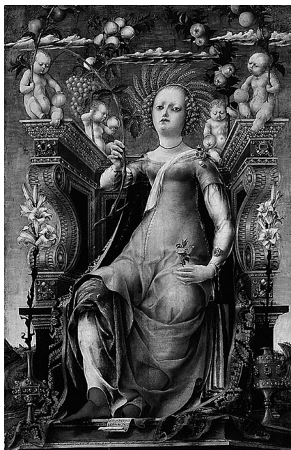
М. Паннонио: Талия

Знаете ли вы, что места, где поклонялись музам, назывались музеями (греч. μουσεῖον )? Музеями считались не только здания, но и любое место под открытым небом, предназначенное для обрядов в честь муз. Поскольку музы помогают и направляют на пути художественного и научного творчества, одним из способов их почитания был интеллектуальный труд. Уже в Академии Платона и Лицее Аристотеля существовали музеи, которые одновременно выполняли религиозную и образовательную функции в училищах, но настоящий расцвет институт музея пришелся на позднюю эллинистическую эпоху. В III веке до н. э., во времена правления царя Птолемея I Сотера и его преемника Птолемея II Филадельфа, были основаны александрийский музей и библиотека. Это был центр культурной и научной мысли и первое государственное учреждение, занимавшееся научной работой и преподаванием. Именно по это образу были созданы известные нам сегодня музеи. Сегодня музеи могут быть не только местами хранения и изучения искусства и исторических артефактов. Всё чаще под этим названием открываются коммерческие пространства: тематические парки, гастрономические музеи, привлекательные центры или тематически объединенные коллекции предметов,