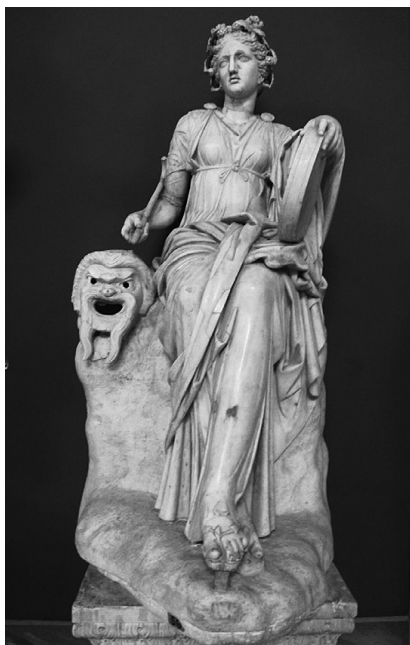
неизвестный художник: Талия