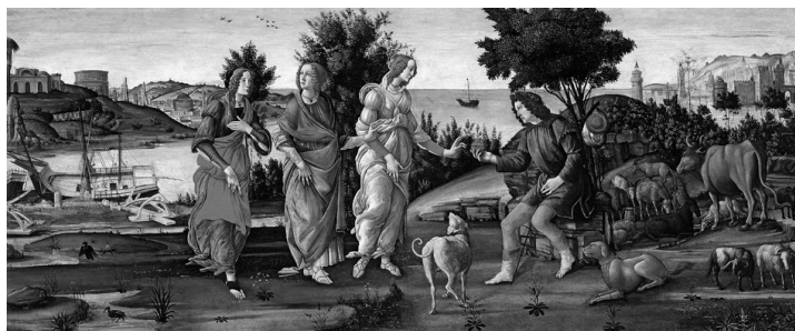
С. Боттичелли: Суд Париса

В живописи эпохи гуманизма и Ренессанса суд Париса был частым мотивом, как и другие античные изображения, но интерес к увековечению причины Троянской войны не угасал и в более поздние периоды. Это привело к тому, что данный мотив стал частью творчества некоторых из величайших художников.